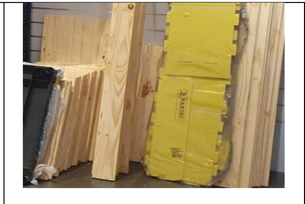
Item 17: Madeiras p/ prateleiras div. tamanhos.