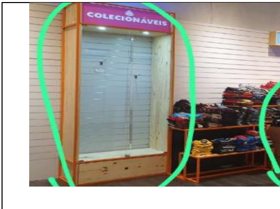
Item 16: Armário expositor de vidro.