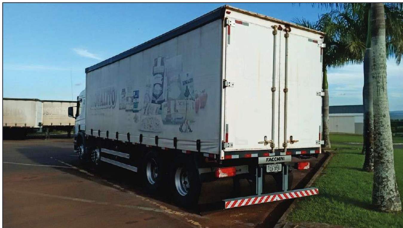
ITEM 032 - BI-TRUCK SCANIA P250 B8X2 PLACA: FEA-3761