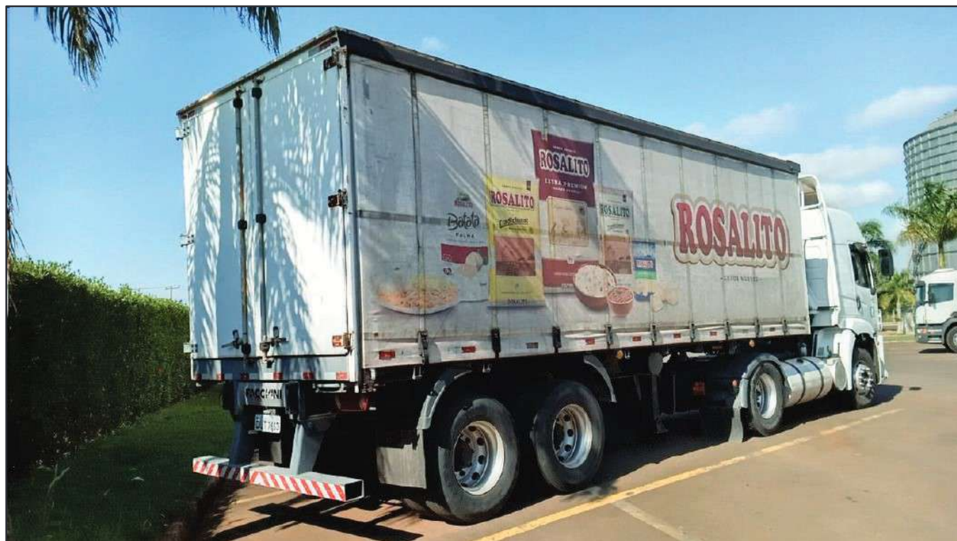
ITEM 012 - SEMI-REBOQUE FURGÃO FACCHINI PLACA: DUT-7663