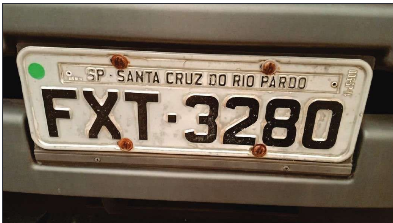
ITEM 043 - CAMINHÃO TOCO VOLKSWAGEM 19-330 CTC PLACA: FXT-3280