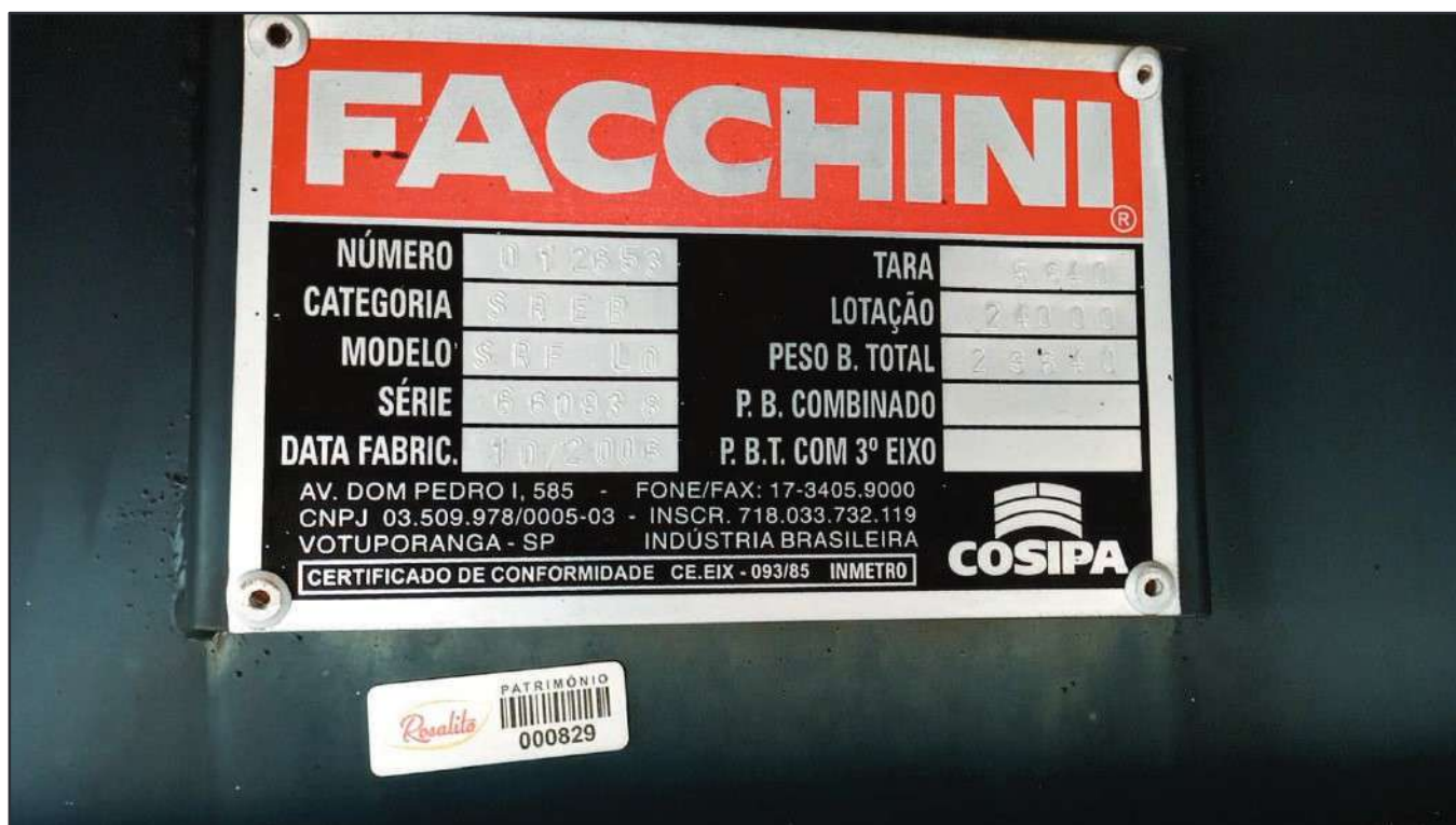
ITEM 010 - SEMI-REBOQUE FURGÃO FACCHINI PLACA: DUT-7416