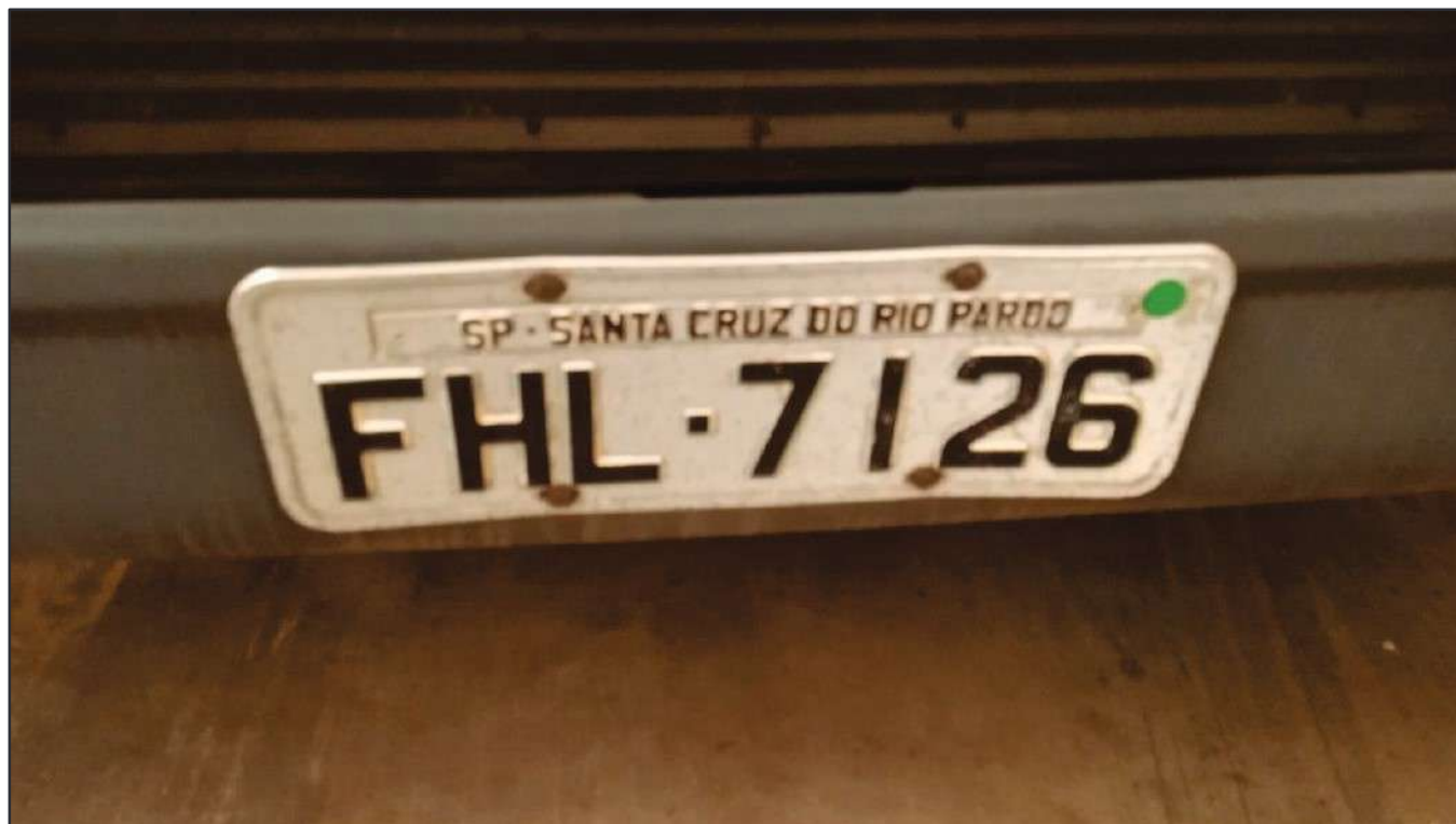
ITEM 035 - BI-TRUCK SCANIA P250 B8X2 PLACA: FHL-7126