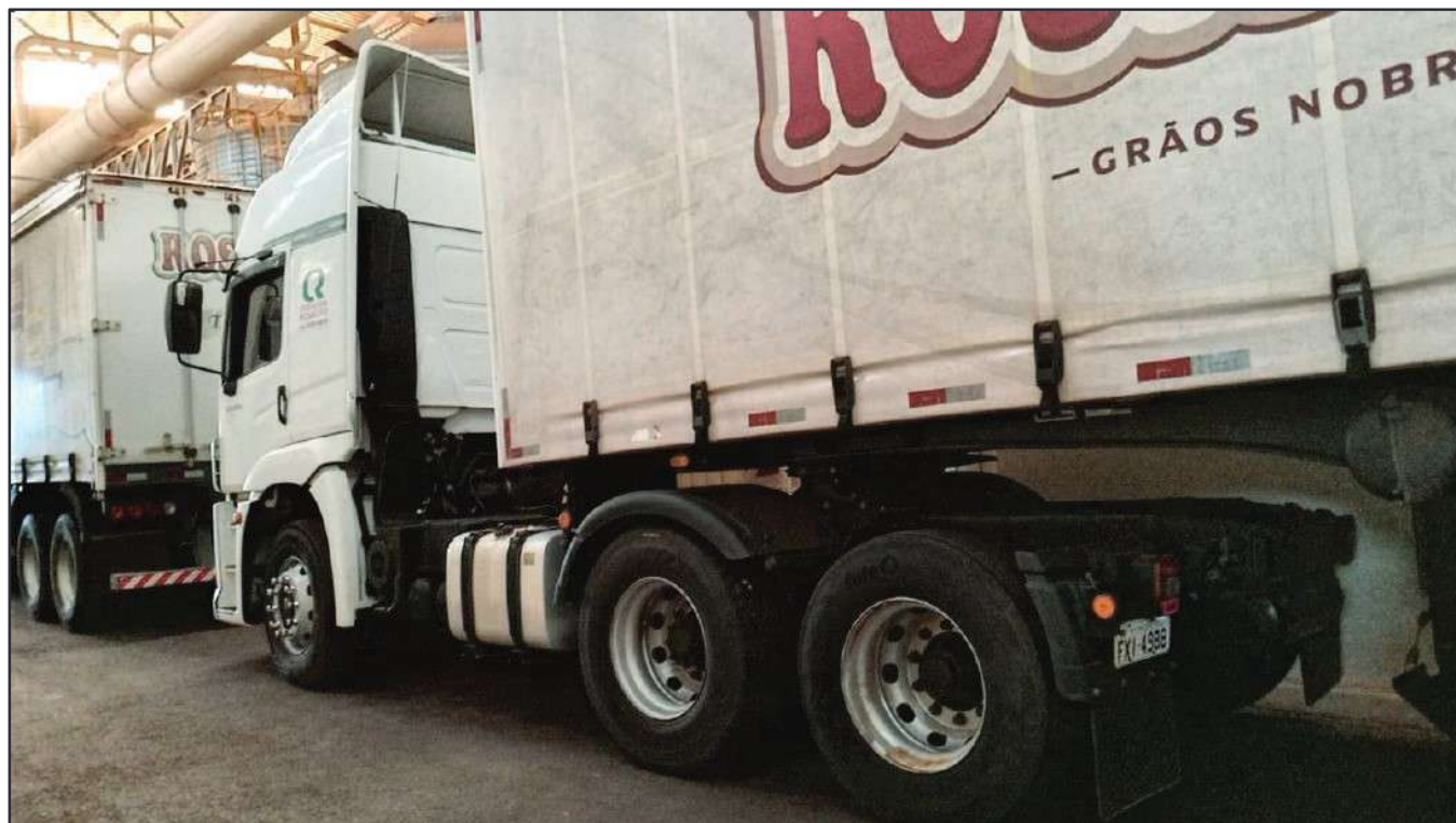
ITEM 041 - CAMINHÃO TRUCK VOLKSWAGEM 25-420 CTC PLACA: FXI-4988