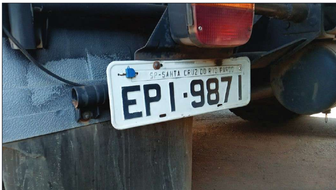
ITEM 026 - CAMINHÃO TOCO VOLKSWAGEM 19-320 CONSTELLATION CLC TT PLACA: EPI-9871