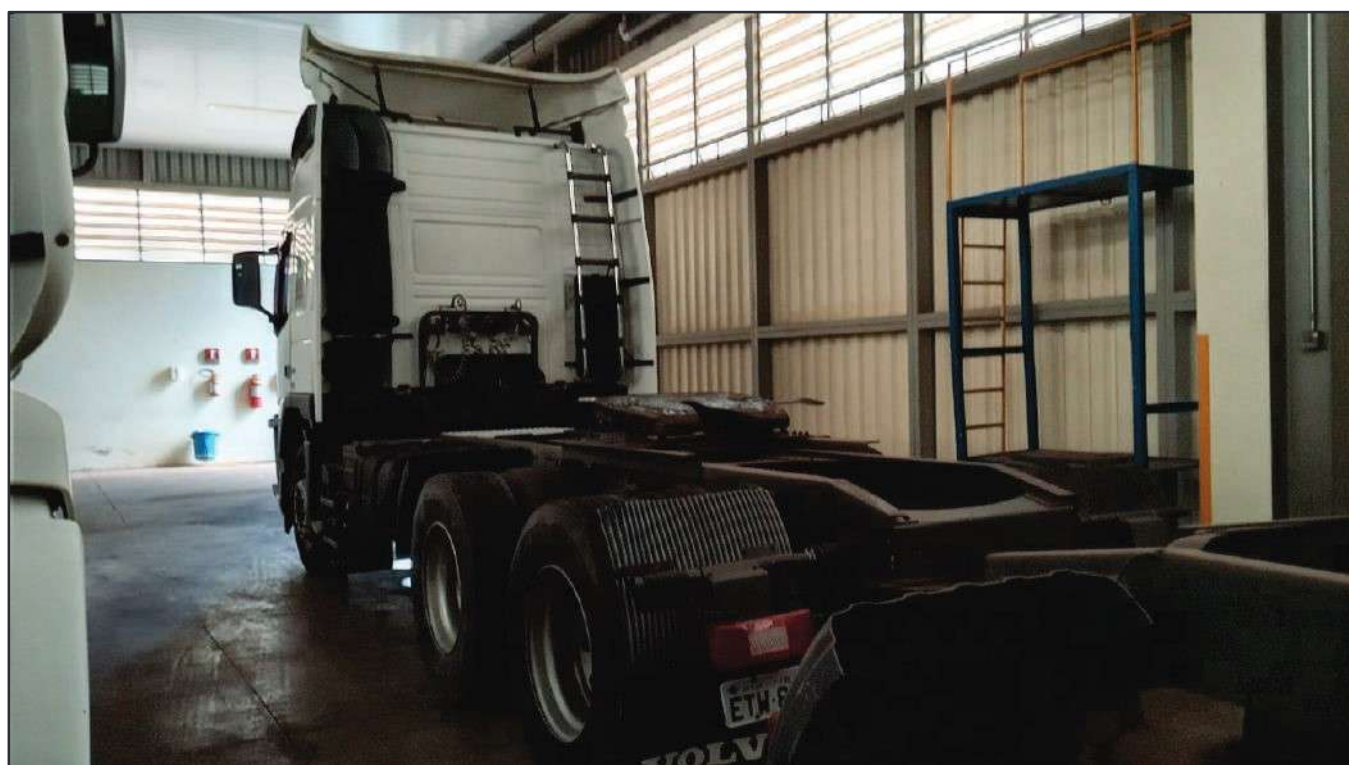
ITEM 027 - CAMINHÃO TRUCK VOLVO FM370 T PLACA: ETW-8947

Este documento é cópia do original, assinado digitalmente por RAFAEL VALERIO BRAGA MARTINS e Tribunal de Justiça do Estado de São Paulo, protocolado em 13/06/2023 às 21:27, sob o número WSCF2023000202130. Para conferir o original, acesse o site https://esaj.tjsp.jus.br/pastadigital/pg/abrirConferenciaDocumento.do , informe o processo 1000701-23.2021.8.26.0539 e código D418770.