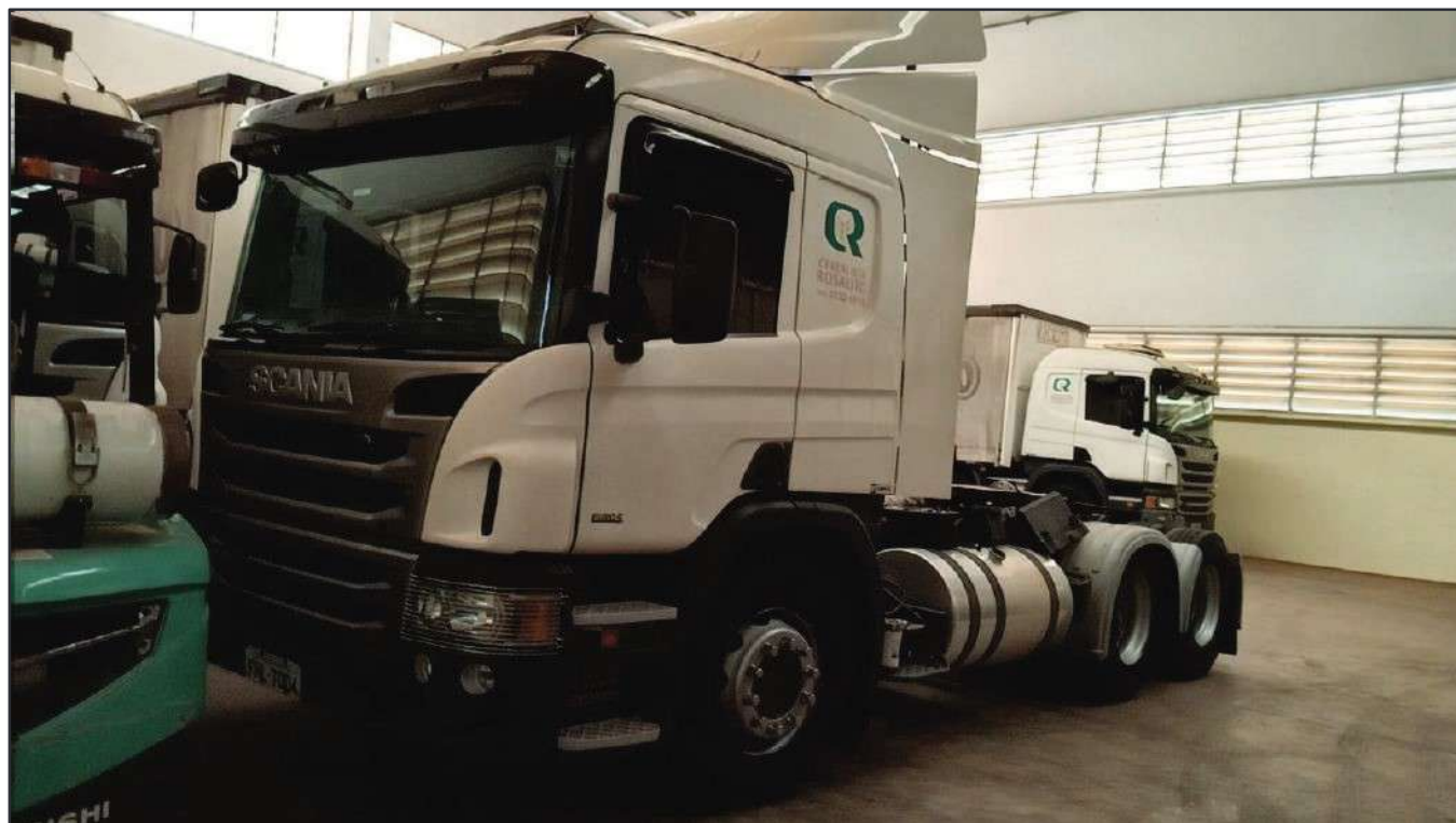
ITEM 048 - CAMINHÃO TRUCK SCANIA P 360 A6X2 PLACA: FHL-7004