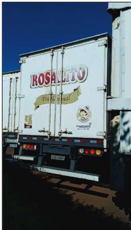
ITEM 006 - SEMI-REBOQUE FURGÃO FACCHINI PLACA: DGQ-0554