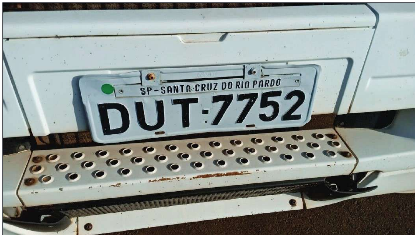
ITEM 013 - CAMINHÃO TOCO MERCEDES-BENZ AXOR 1933 S PLACA: DUT-7752