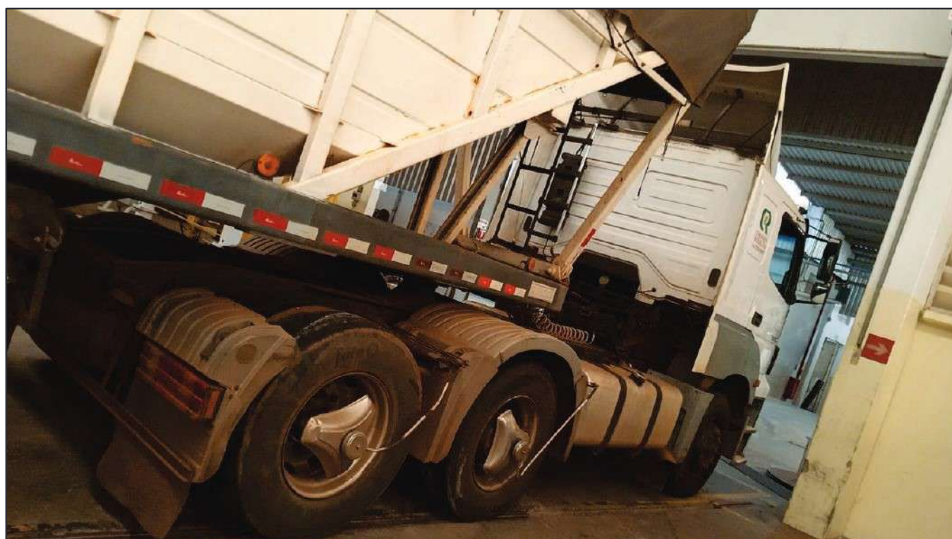
ITEM 015 - CAMINHÃO TRUCK MERCEDES-BENZ 1720 PLACA: DUT-7816