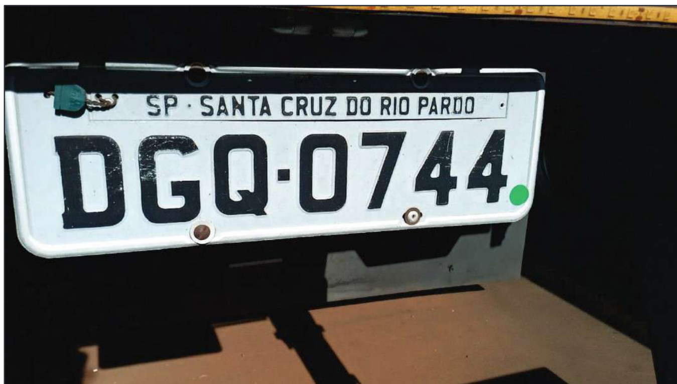
ITEM 007 - SEMI-REBOQUE FURGÃO FACCHINI PLACA: DGQ-0744