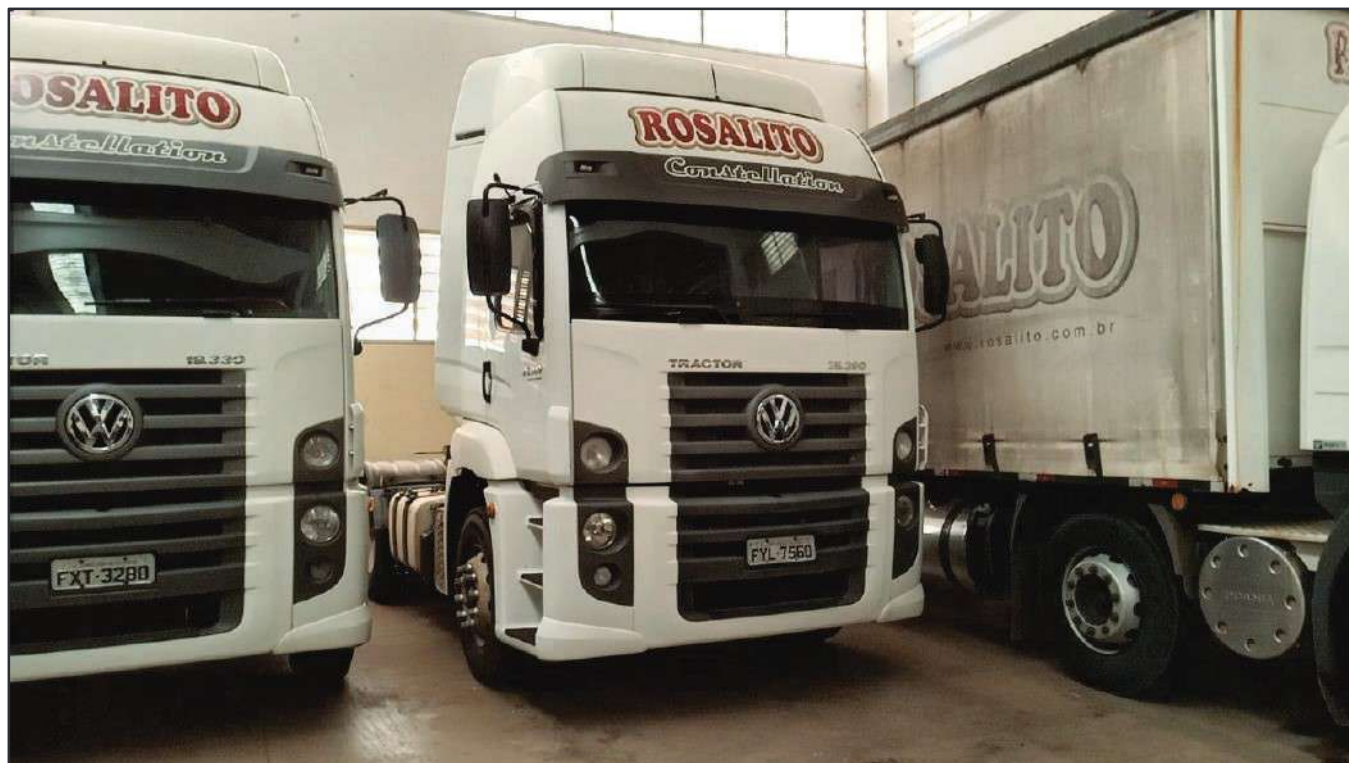
ITEM 044 - CAMINHÃO TRUCK VOLKSWAGEM 25-390 CTC PLACA: FYL-7560