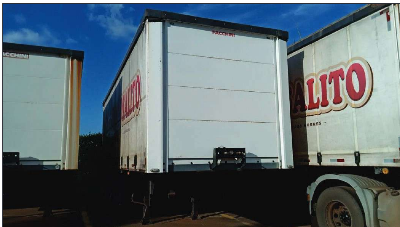
ITEM 028 - SEMI-REBOQUE FURGÃO FACCHINI PLACA: ETW-9375