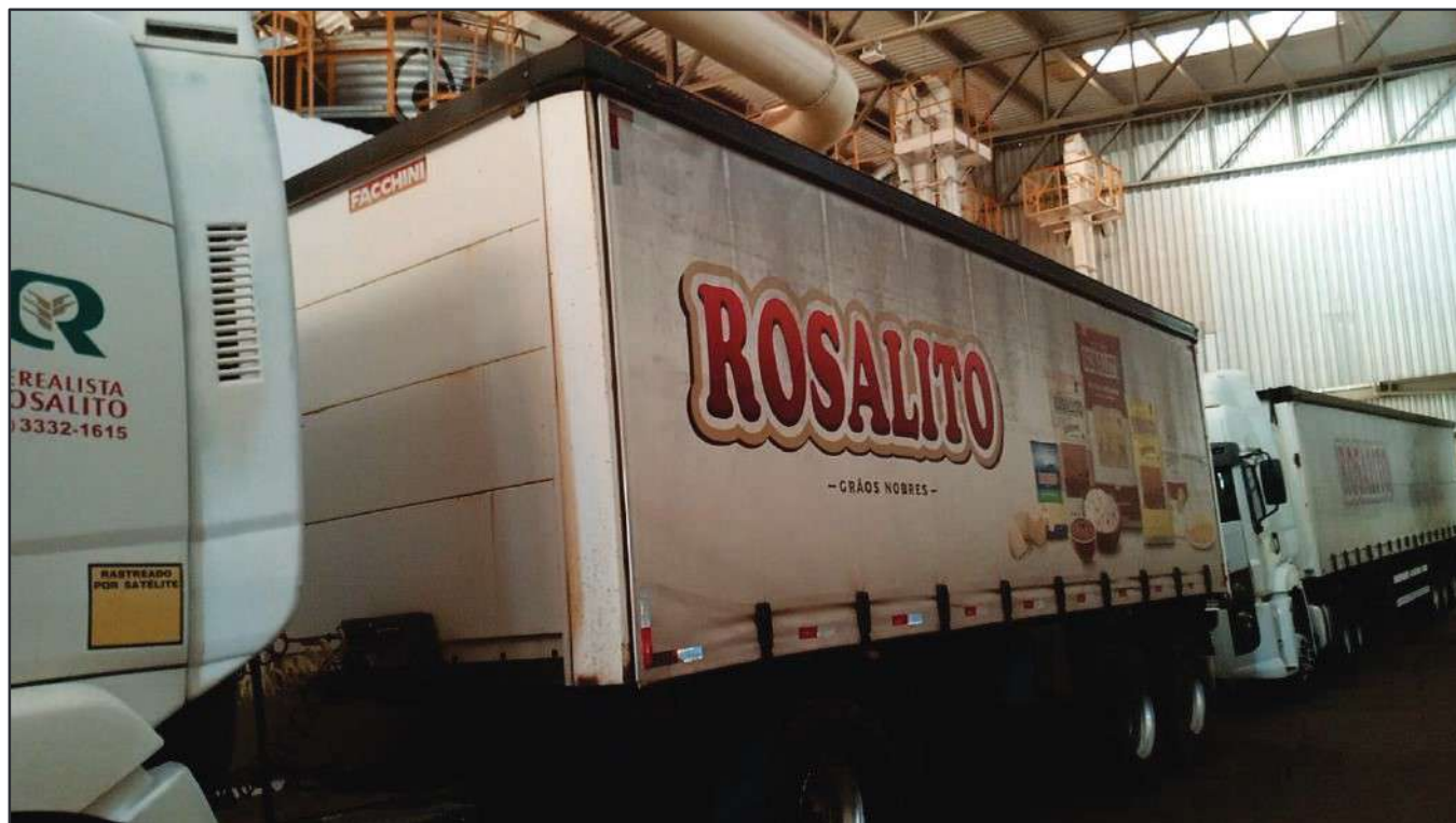
ITEM 009 - SEMI-REBOQUE FURGÃO FACCHINI PLACA: DUT-7415