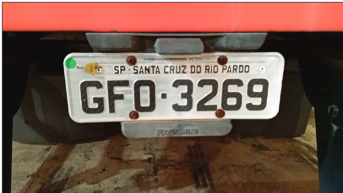
ITEM 045 - SEMI-REBOQUE FURGÃO FACCHINI PLACA: GFO-3269