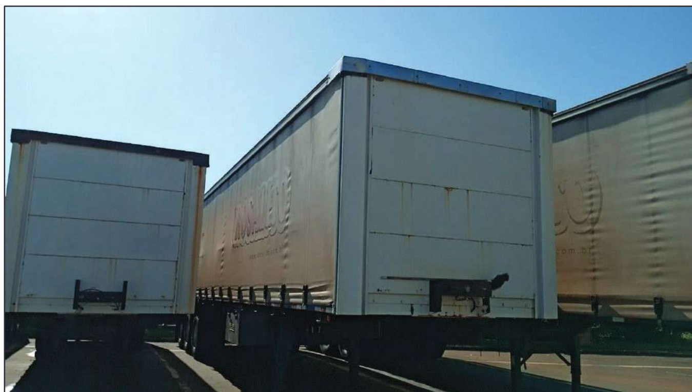
ITEM 006 - SEMI-REBOQUE FURGÃO FACCHINI PLACA: DGQ-0554