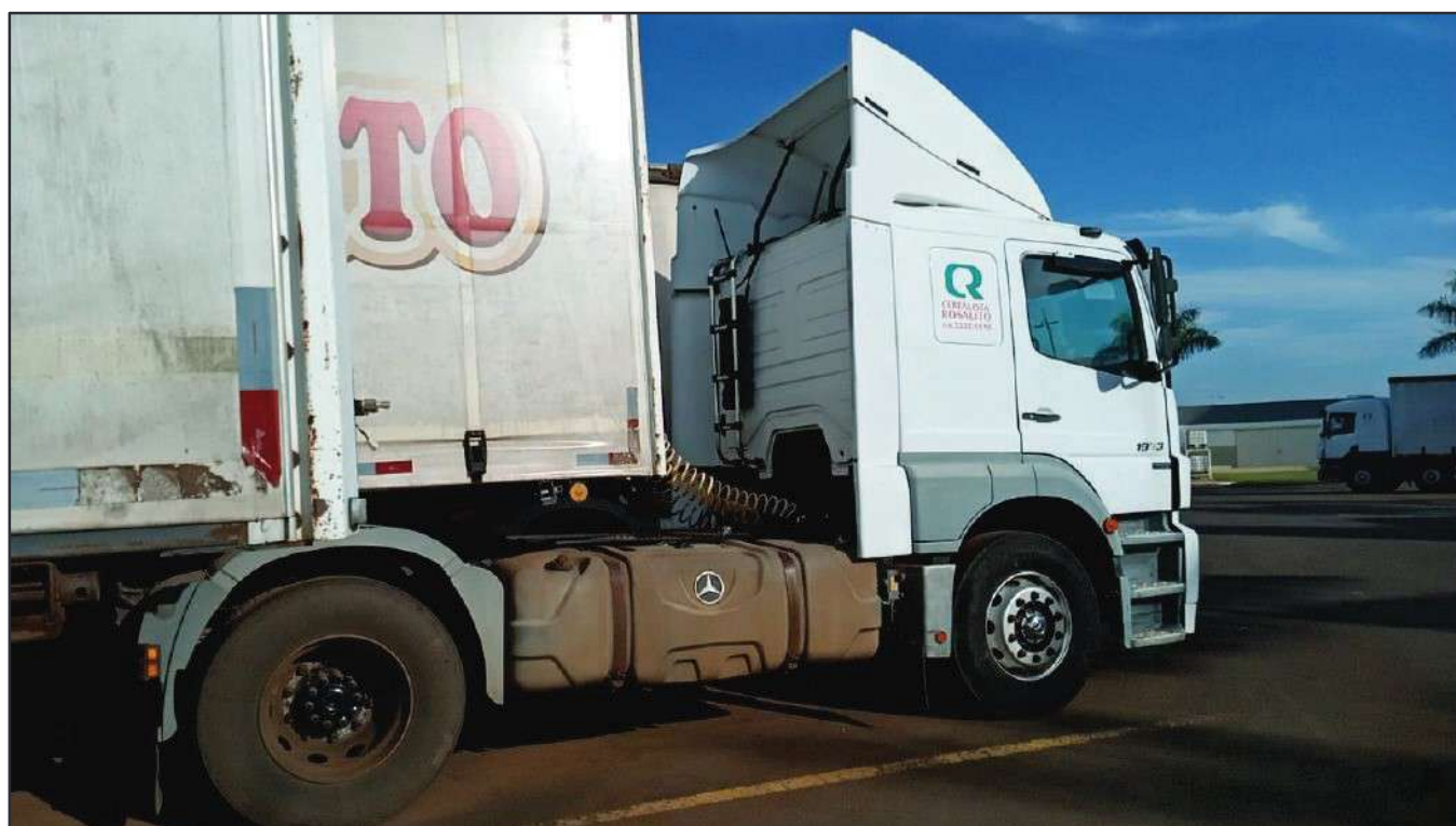
ITEM 025 - CAMINHÃO TOCO MERCEDES-BENZ AXOR 1933 S PLACA: EAC-5029

Este documento é cópia do original, assinado digitalmente por RAFAEL VALERIO BRAGA MARTINS e Tribunal de Justiça do Estado de São Paulo, protocolado em 13/06/2023 às 21:27, sob o número WSCF033700202130. Para conferir o original, acesse o site https://esaj.tjsp.jus.br/pastadigital/pg/abrirConferenciaDocumento.do , informe o processo 1000701-23.2021.8.26.0539 e código D418770.