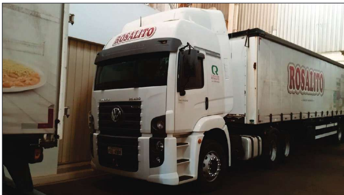
ITEM 041 - CAMINHÃO TRUCK VOLKSWAGEM 25-420 CTC PLACA: FXI-4988