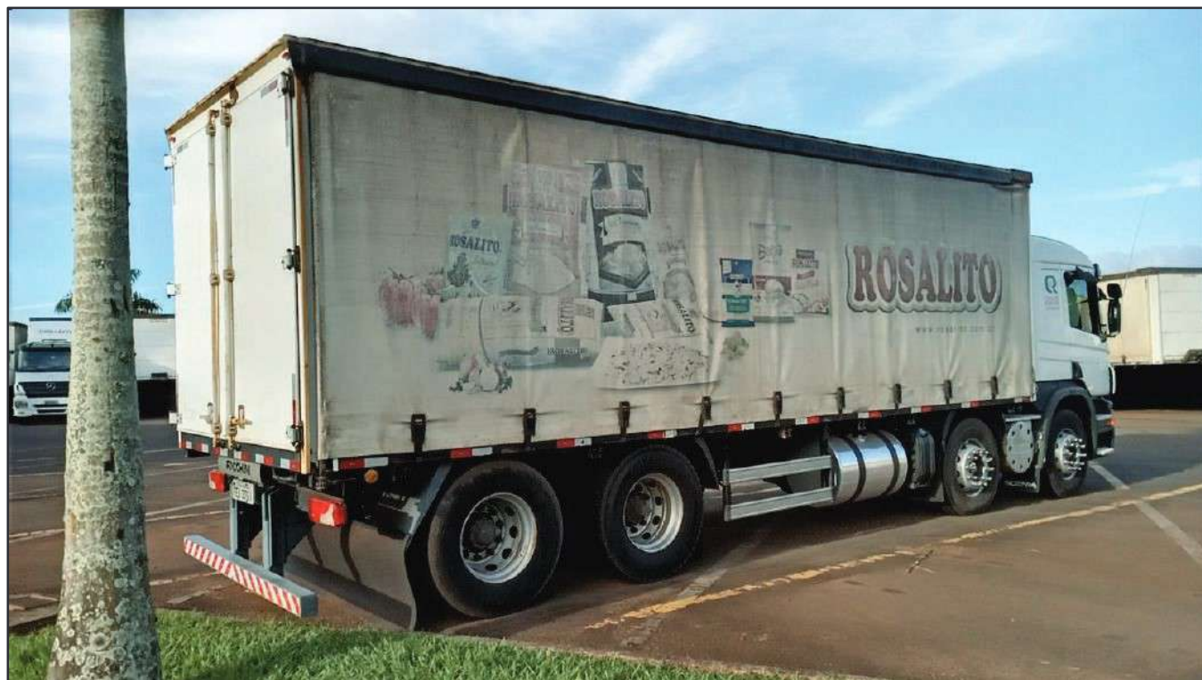
ITEM 032 - BI-TRUCK SCANIA P250 B8X2 PLACA: FEA-3761