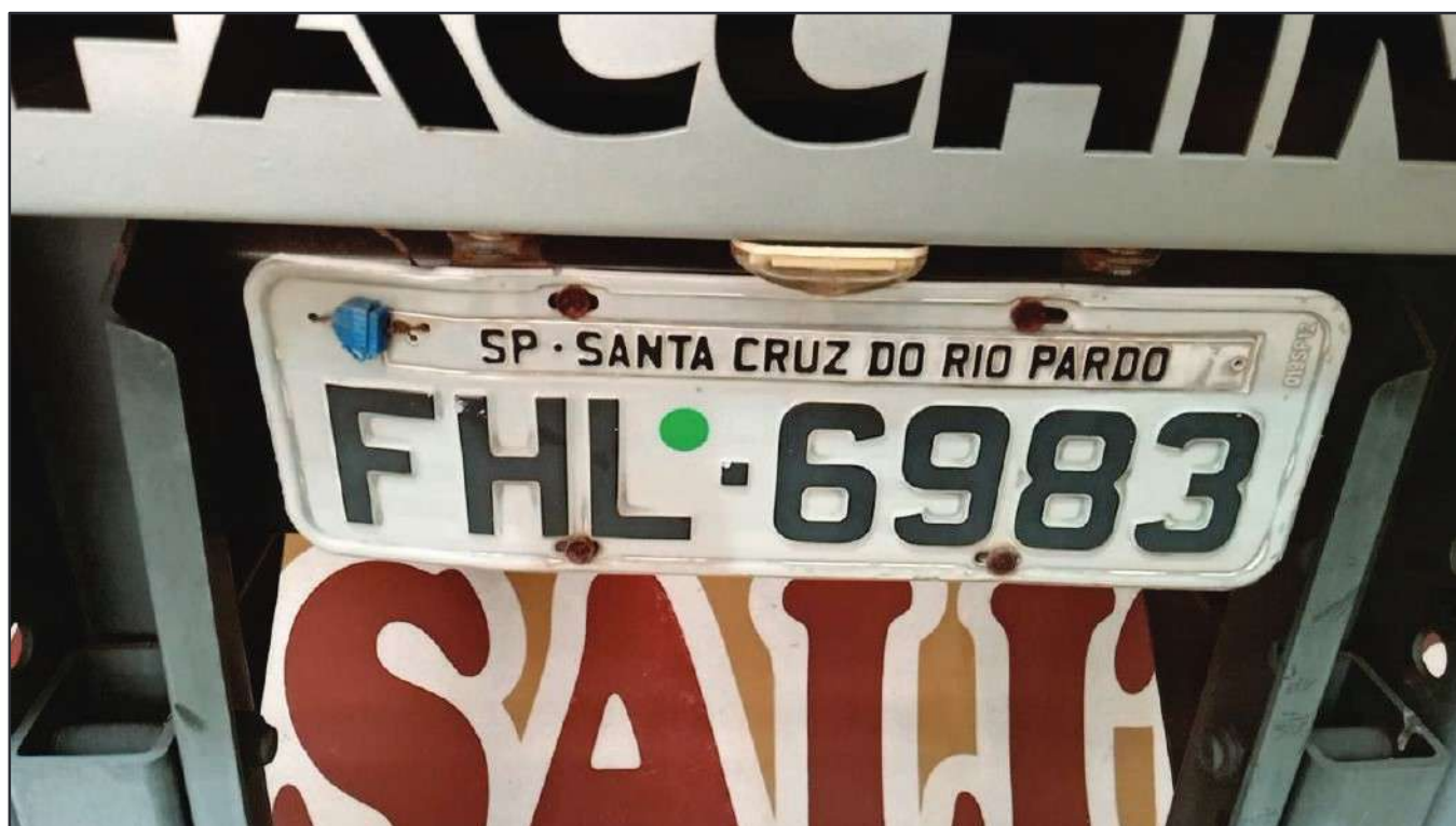
ITEM 034 - BI-TRUCK SCANIA P250 B8X2 PLACA: FHL-6983

Este documento é cópia do original, assinado digitalmente por RAFAEL VALERIO BRAGA MARTINS e Tribunal de Justiça do Estado de São Paulo, protocolado em 13/06/2023 às 21:27, sob o número WSCF133700202130. Para conferir o original, acesse o site https://esaj.tjsp.jus.br/pastadigital/pg/abrirConferenciaDocumento.do , informe o processo 1000101-23.2021.8.26.0539 e código D41877C.