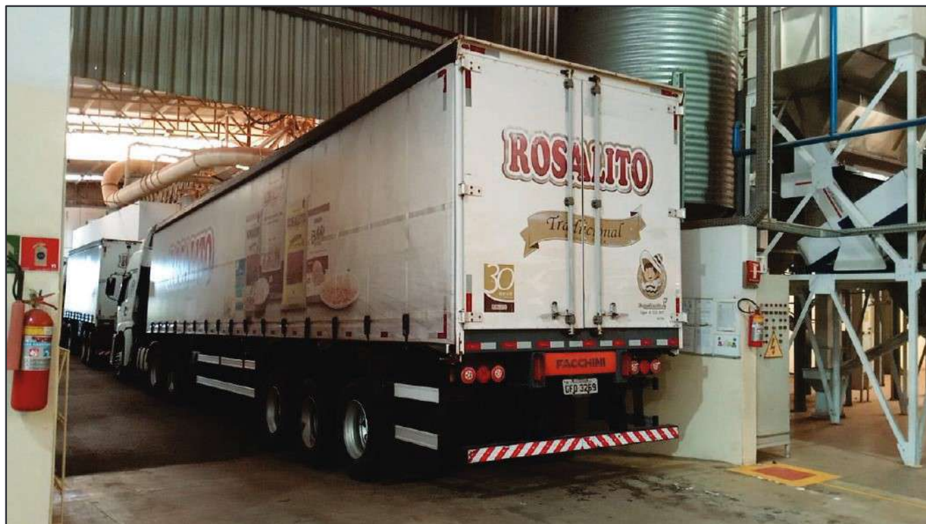
ITEM 045 - SEMI-REBOQUE FURGÃO FACCHINI PLACA: GFO-3269