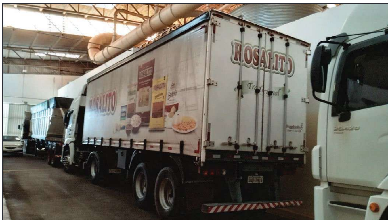
ITEM 009 - SEMI-REBOQUE FURGÃO FACCHINI PLACA: DUT-7415