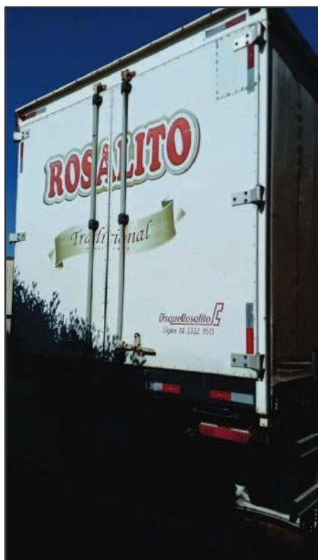
ITEM 036 - SEMI-REBOQUE FURGÃO FACCHINI PLACA: FHL-7257