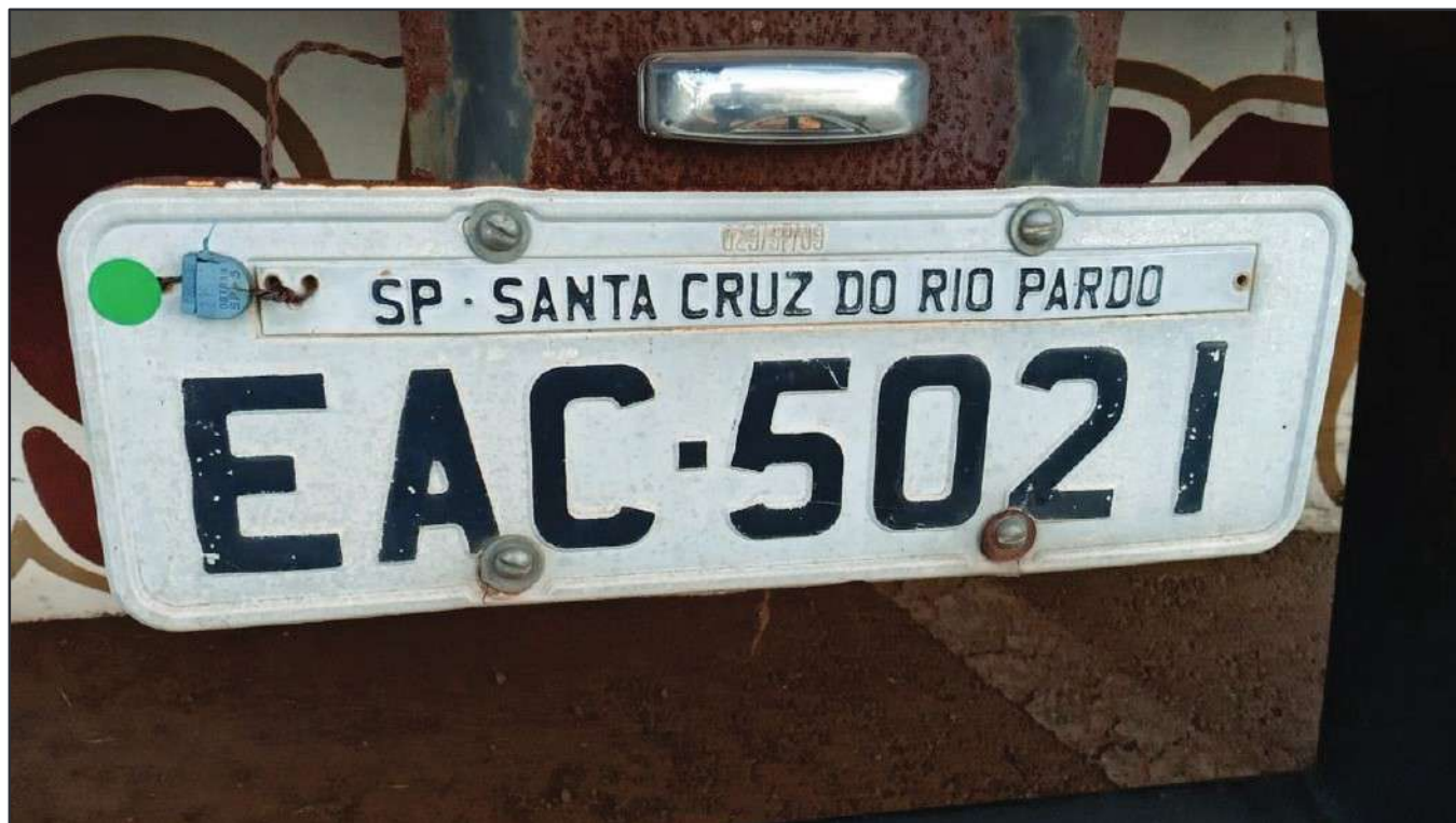
ITEM 023 - SEMI-REBOQUE FURGÃO FACCHINI PLACA: EAC-5021