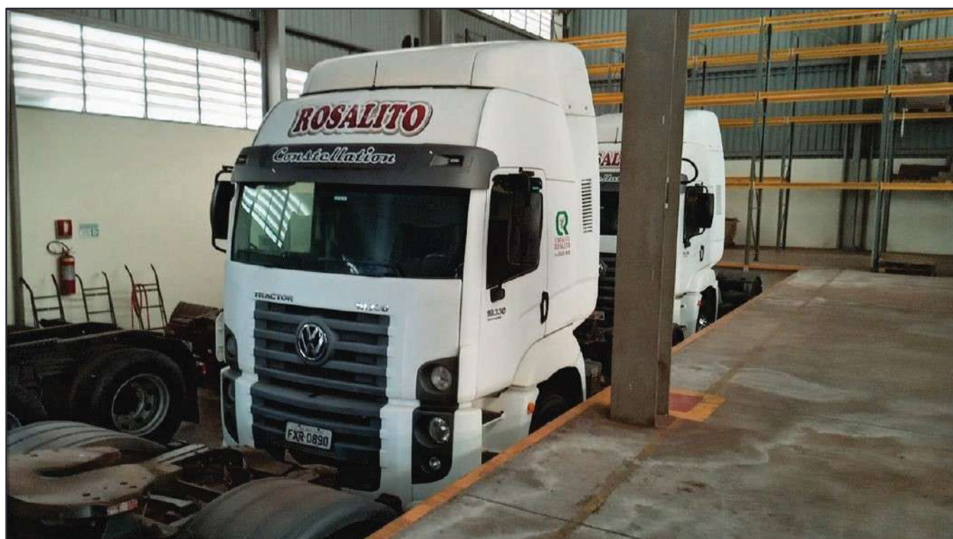
ITEM 042 - CAMINHÃO TOCO VOLKSWAGEM 19-330 CTC PLACA: FXR-0890

Este documento é cópia do original, assinado digitalmente por RAFAEL VALERIO BRAGA MARTINS e Tribunal de Justiça do Estado de São Paulo, protocolado em 13/06/2023 às 21:27, sob o número WSCF033700202130. Para conferir o original, acesse o site https://esaj.tjsp.jus.br/pastadigital/pg/abrirConferenciaDocumento.do , informe o processo 1000101-23.2021.8.26.0539 e código D41877C.