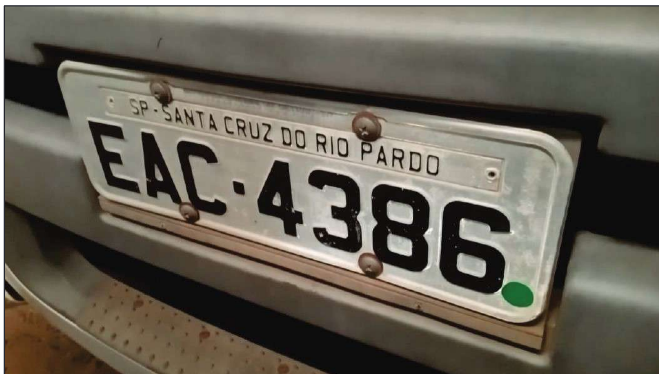
ITEM 018 - CAMINHÃO TOCO VOLKSWAGEM 19-320 CONSTELLATION CLC TT PLACA: EAC-4386