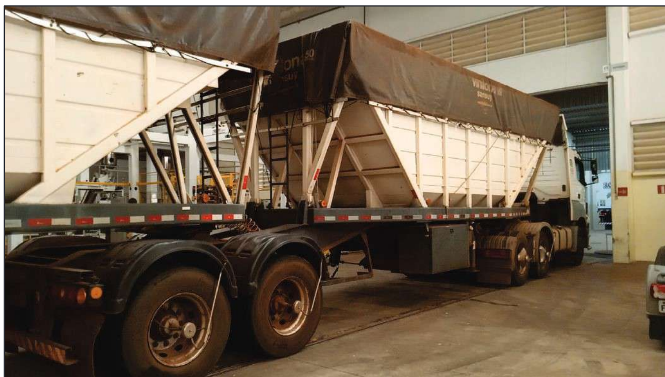
ITEM 004 - BI-TREM RANDON PLACA: DGQ-0481