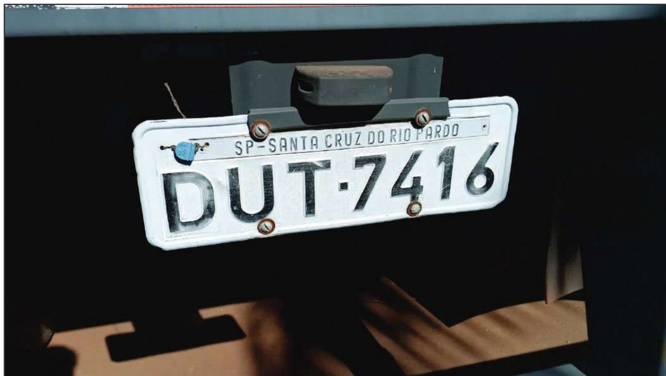
ITEM 010 - SEMI-REBOQUE FURGÃO FACCHINI PLACA: DUT-7416