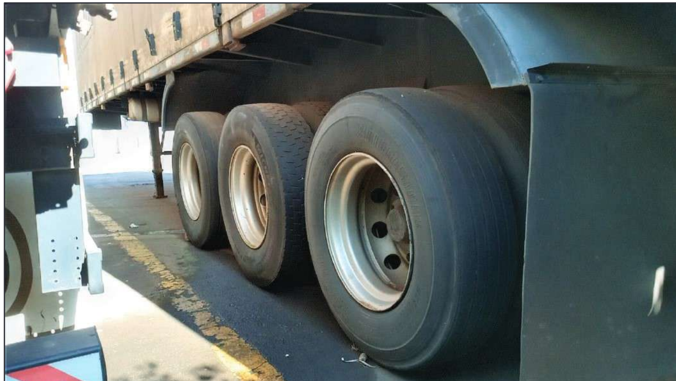
ITEM 002 - SEMI-REBOQUE FURGÃO RANDON PLACA: CTX-5979