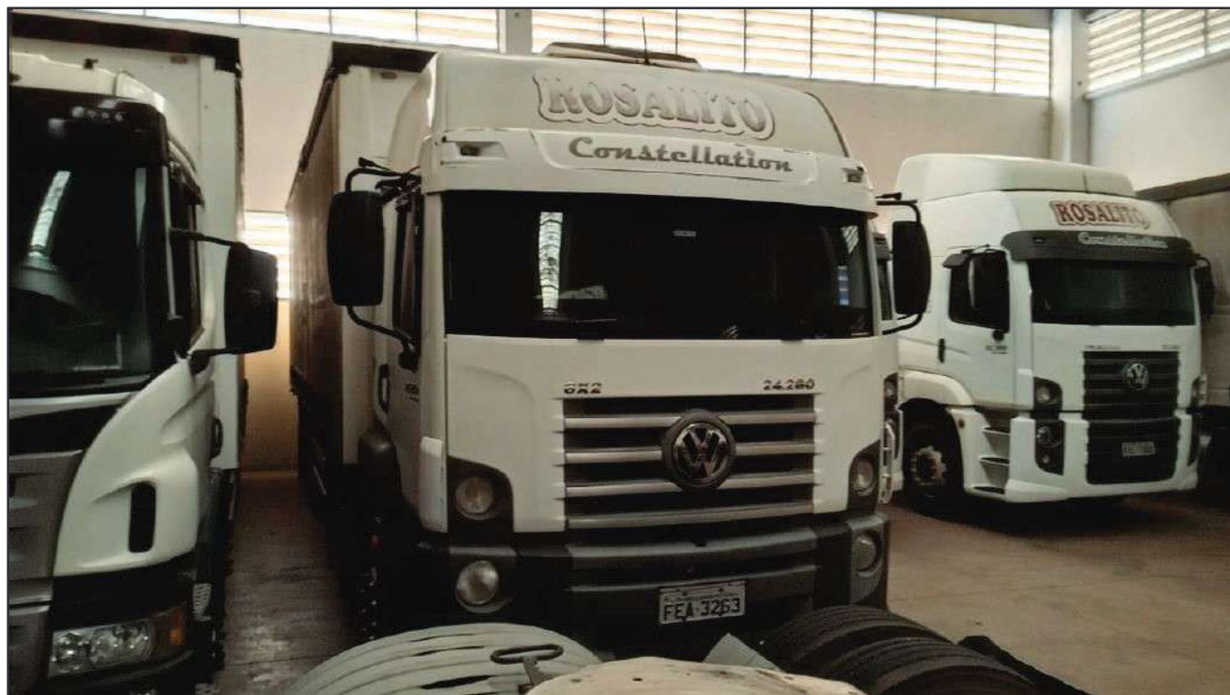
ITEM 031 - BI-TRUCK VOLKSWAGEM 24-280 CRM PLACA: FEA-3263