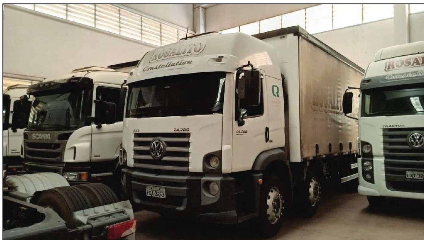
ITEM 031 - BI-TRUCK VOLKSWAGEM 24-280 CRM PLACA: FEA-3263

Este documento é cópia do original, assinado digitalmente por RAFAEL VALERIO BRAGA MARTINS e Tribunal de Justiça do Estado de São Paulo, protocolado em 13/06/2023 às 21:27, sob o número WSCF033700202130. Para conferir o original, acesse o site https://esaj.tjsp.jus.br/pastadigital/pg/abrirConferenciaDocumento.do , informe o processo 1000701-23.2021.8.26.0539 e código D418770.