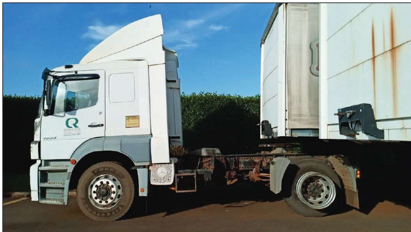
ITEM 013 - CAMINHÃO TOCO MERCEDES-BENZ AXOR 1933 S PLACA: DUT-7752