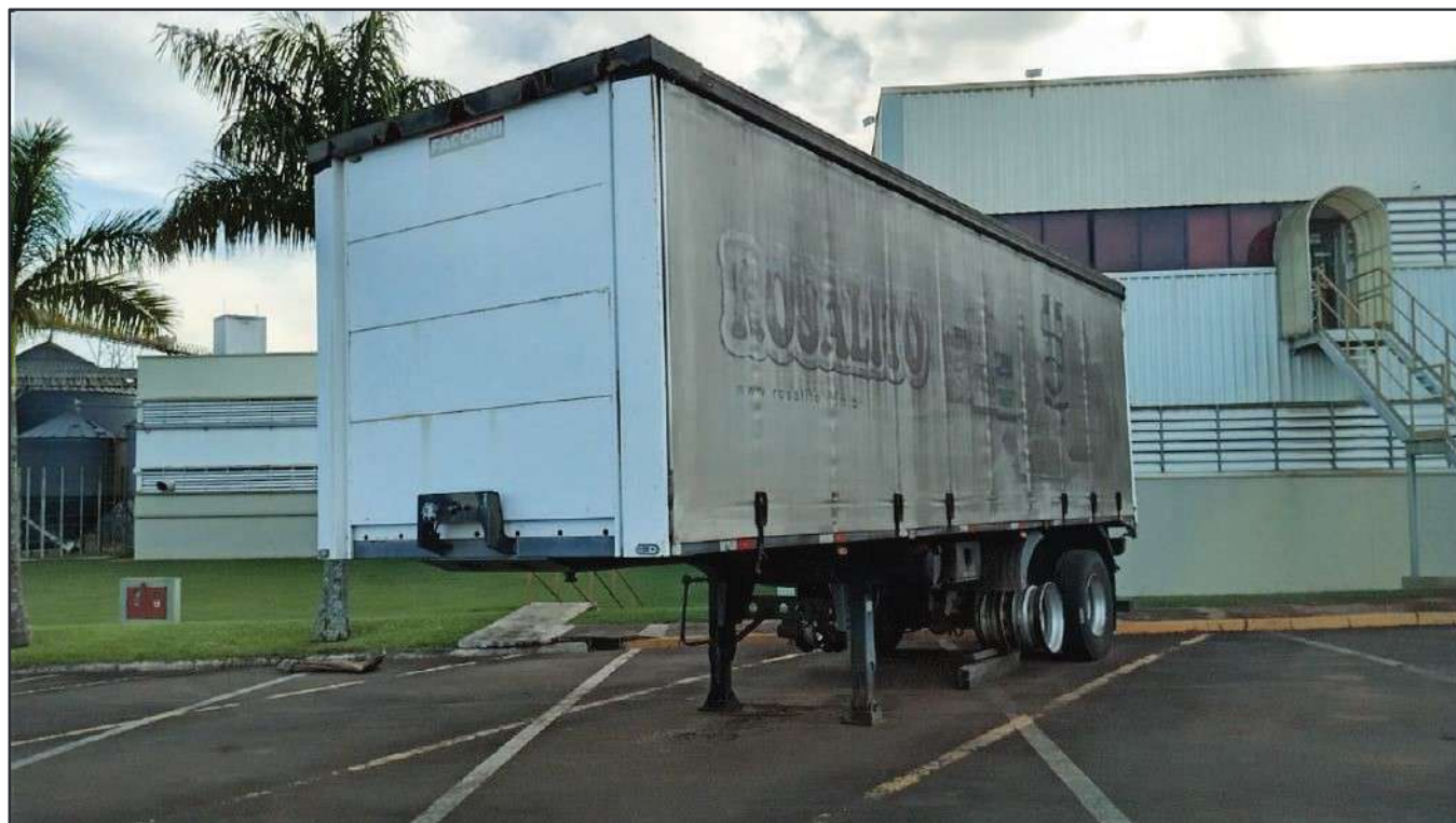
ITEM 023 - SEMI-REBOQUE FURGÃO FACCHINI PLACA: EAC-5021