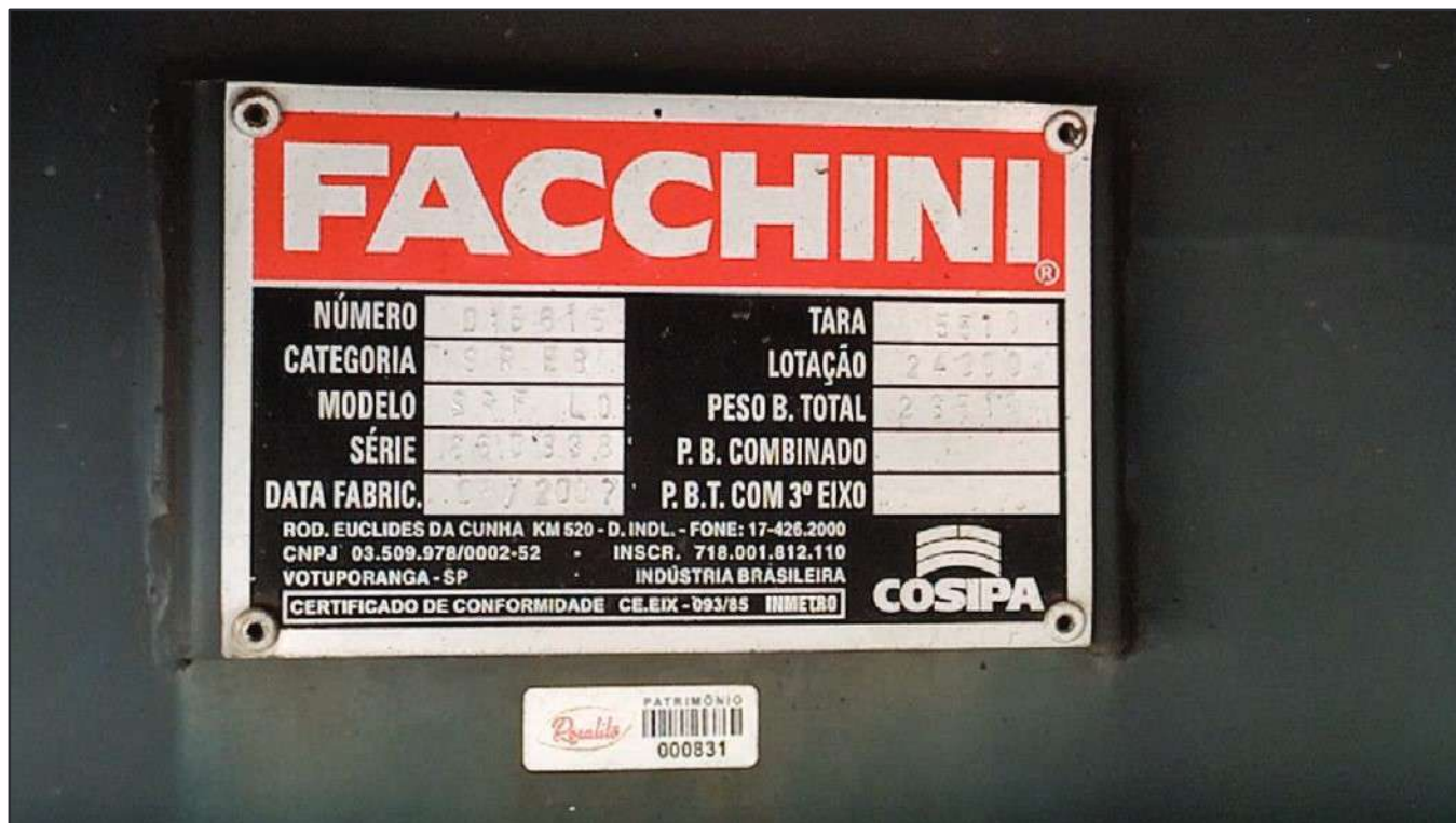
ITEM 012 - SEMI-REBOQUE FURGÃO FACCHINI PLACA: DUT-7663