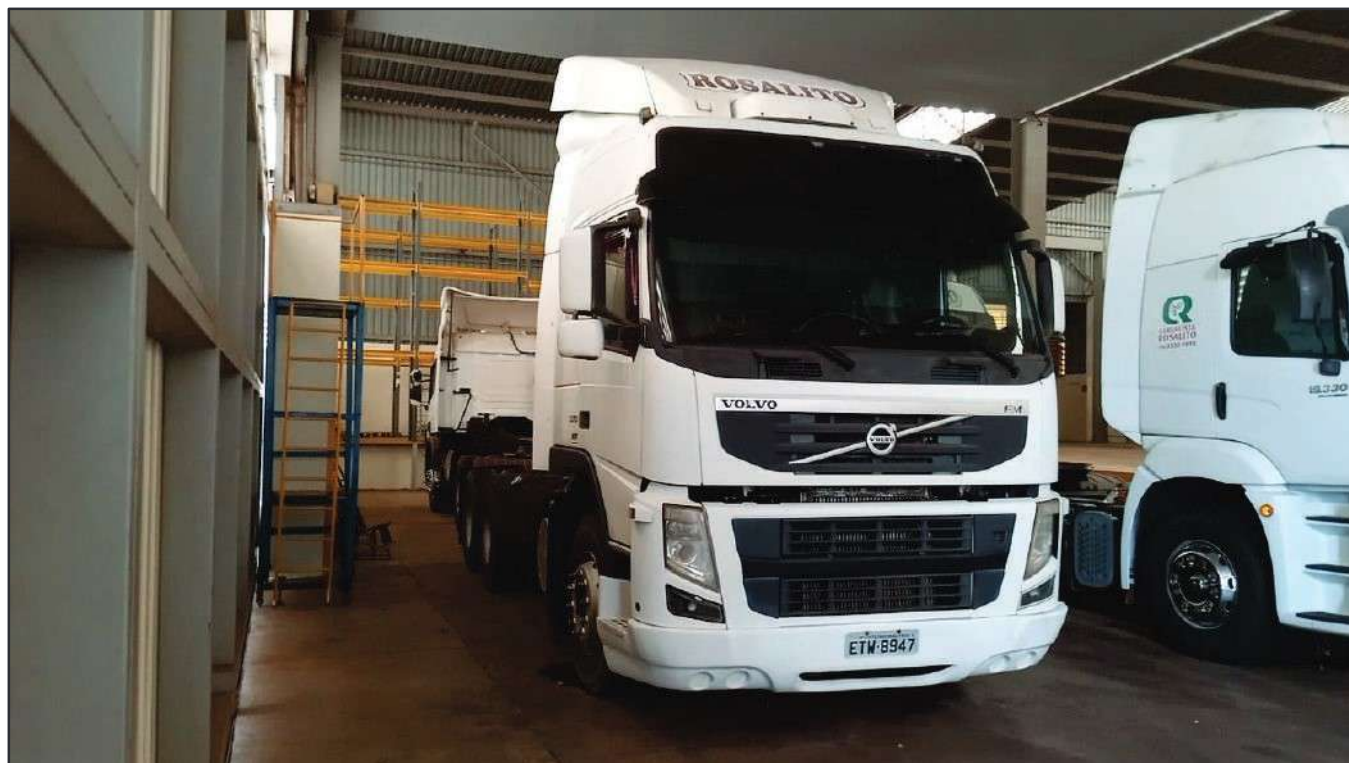
ITEM 027 - CAMINHÃO TRUCK VOLVO FM370 T PLACA: ETW-8947