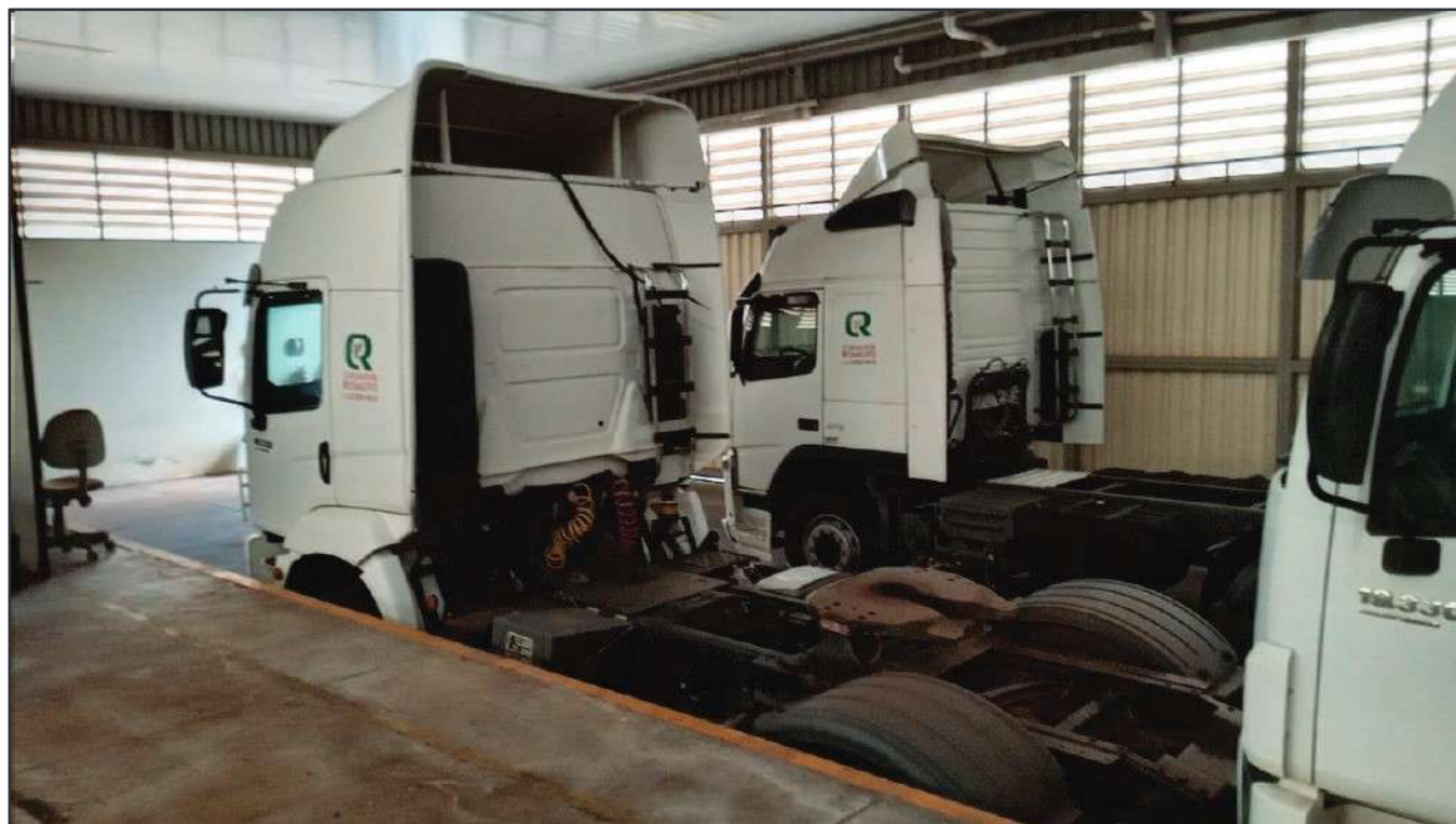
ITEM 040 - CAMINHÃO TOCO VOLKSWAGEM 19-330 CTC PLACA: FSP-2520