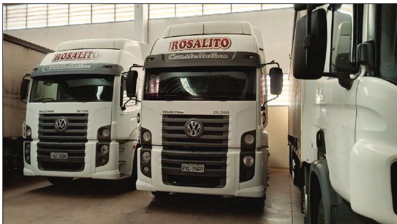
ITEM 044 - CAMINHÃO TRUCK VOLKSWAGEM 25-390 CTC PLACA: FYL-7560