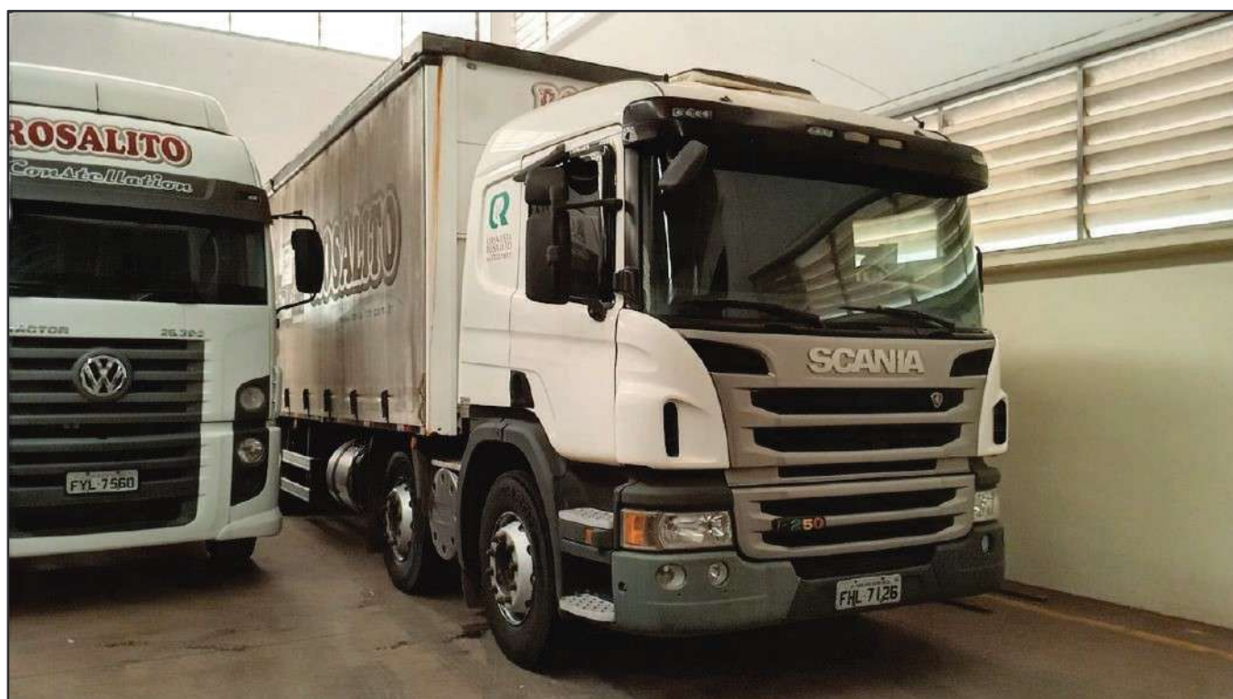
ITEM 035 - BI-TRUCK SCANIA P250 B8X2 PLACA: FHL-7126