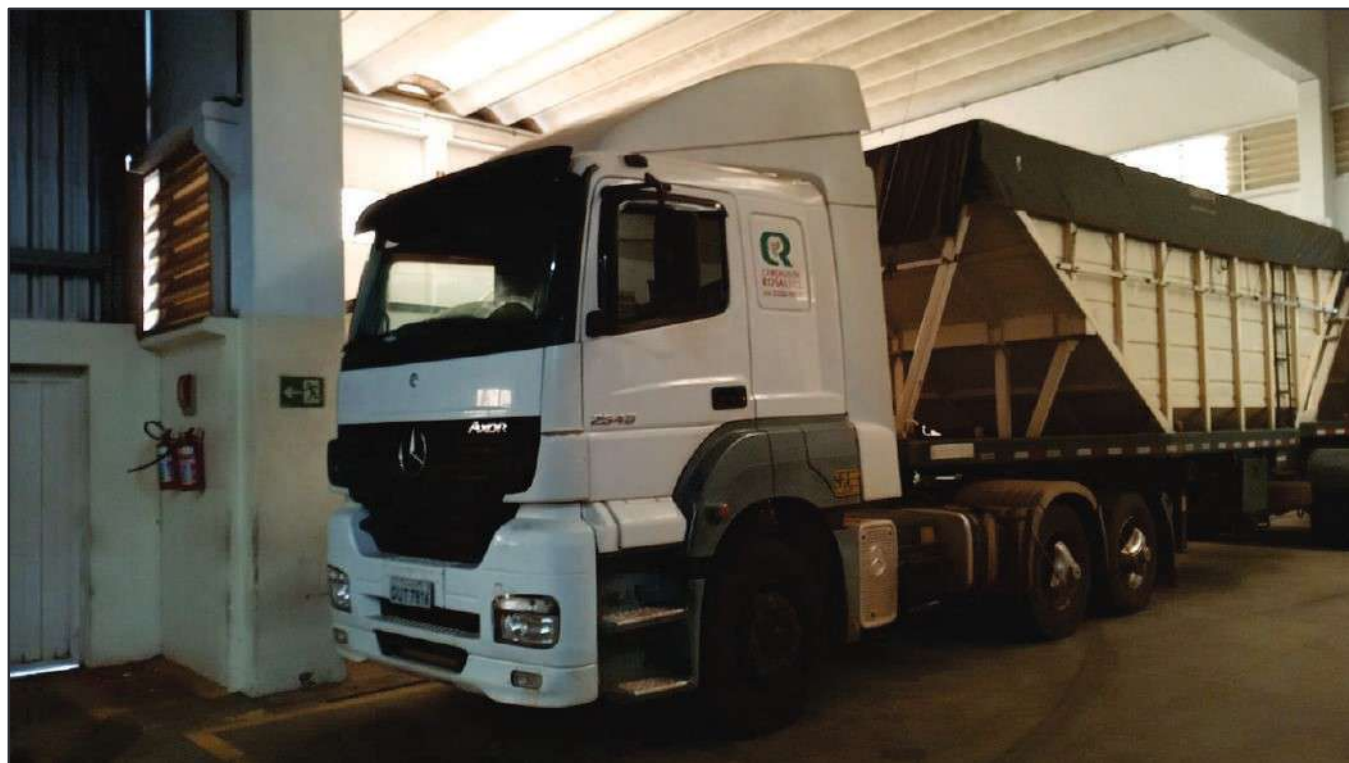
ITEM 015 - CAMINHÃO TRUCK MERCEDES-BENZ 1720 PLACA: DUT-7816