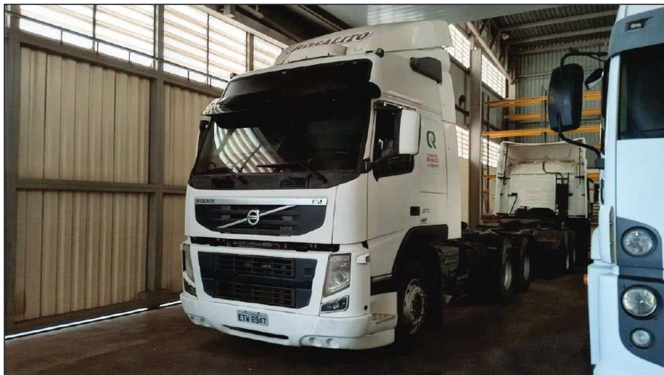
ITEM 027 - CAMINHÃO TRUCK VOLVO FM370 T PLACA: ETW-8947