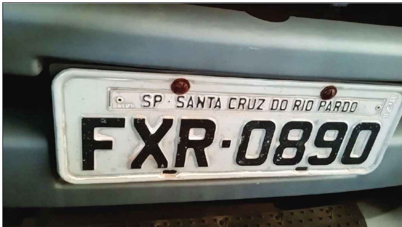
ITEM 042 - CAMINHÃO TOCO VOLKSWAGEM 19-330 CTC PLACA: FXR-0890