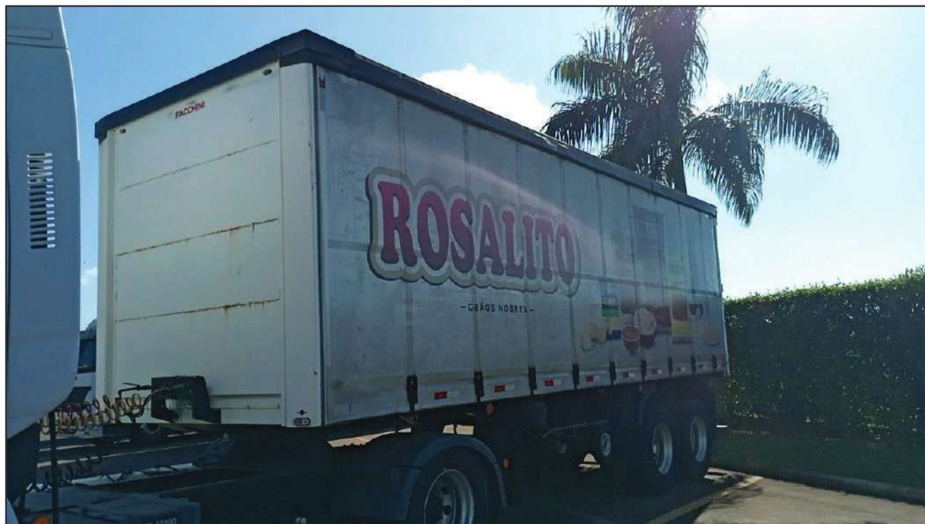
ITEM 012 - SEMI-REBOQUE FURGÃO FACCHINI PLACA: DUT-7663