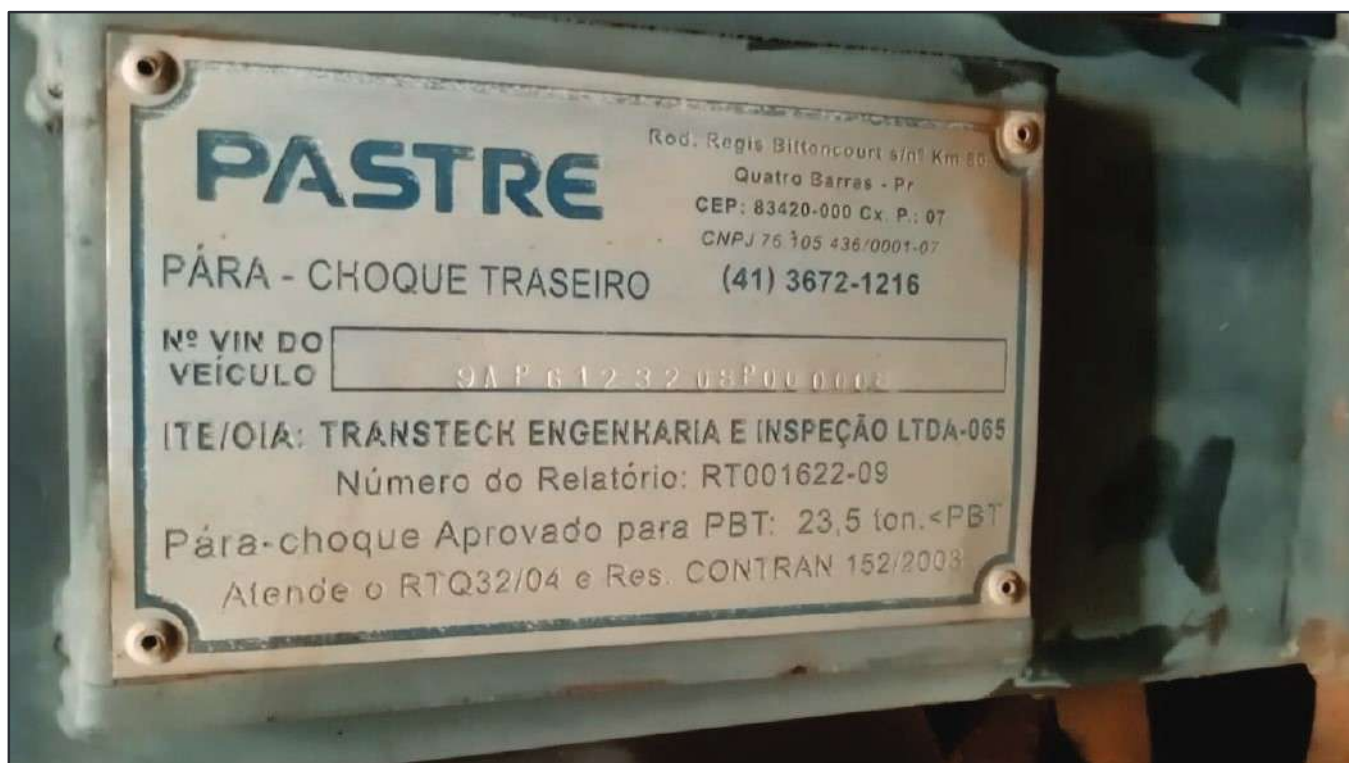
ITEM 014 - SEMI-REBOQUE GRANELEIRO PASTRE PLACA: DUT-7802