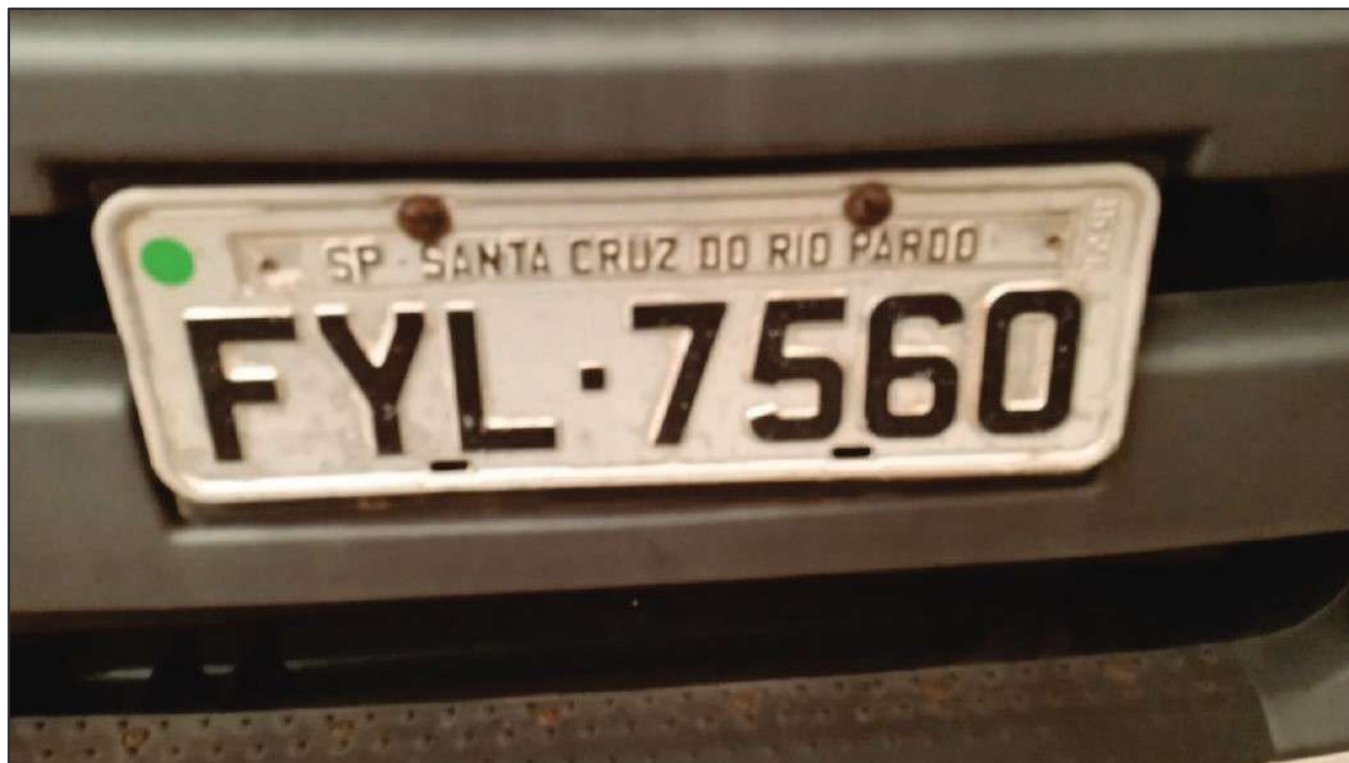
ITEM 044 - CAMINHÃO TRUCK VOLKSWAGEM 25-390 CTC PLACA: FYL-7560