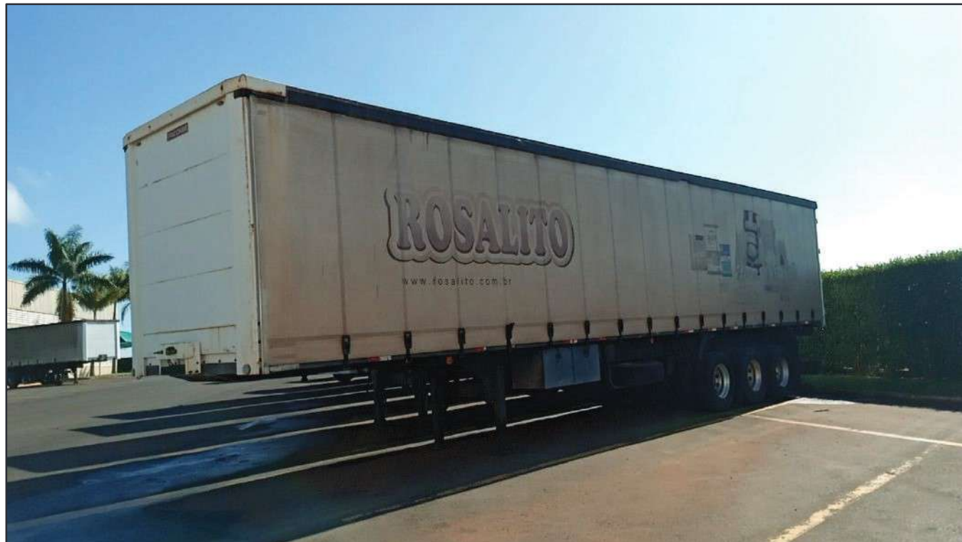
ITEM 007 - SEMI-REBOQUE FURGÃO FACCHINI PLACA: DGQ-0744