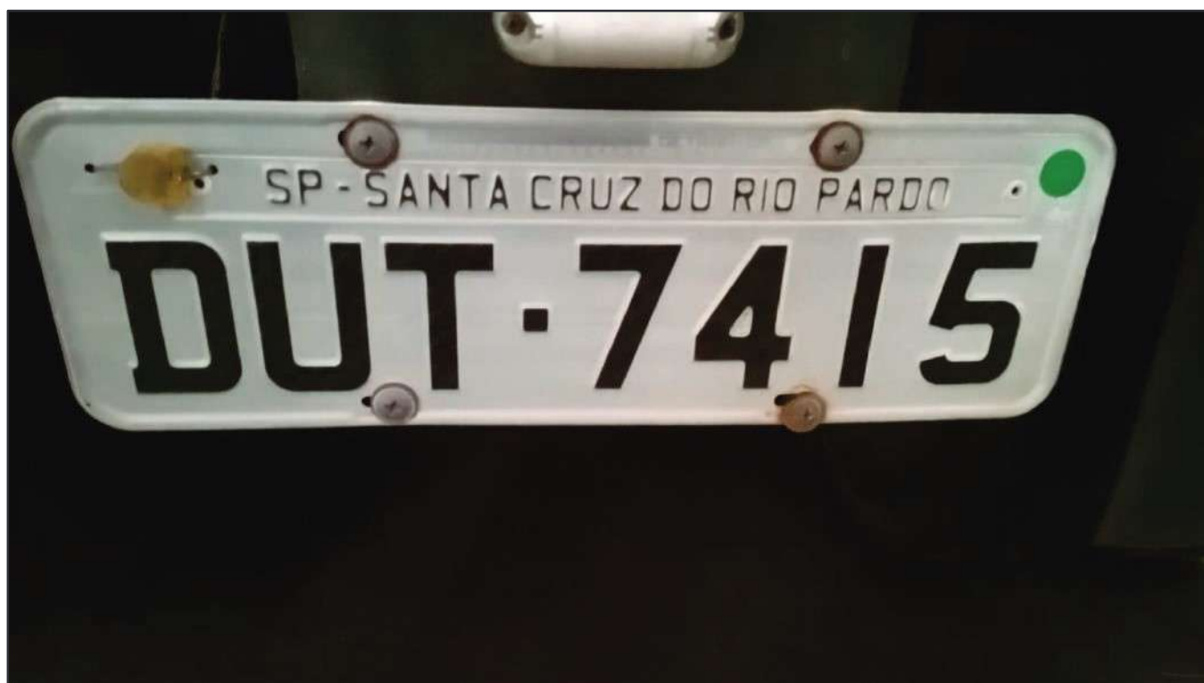
ITEM 009 - SEMI-REBOQUE FURGÃO FACCHINI PLACA: DUT-7415