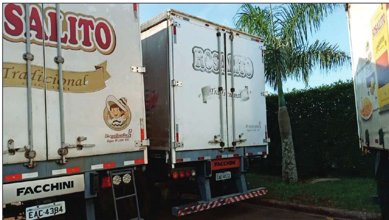
ITEM 020 - SEMI-REBOQUE FURGÃO FACCHINI PLACA: EAC-4532