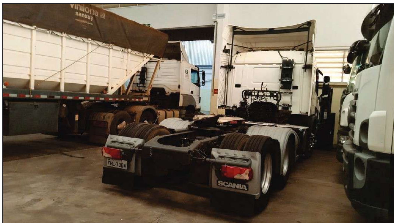
ITEM 048 - CAMINHÃO TRUCK SCANIA P 360 A6X2 PLACA: FHL-7004