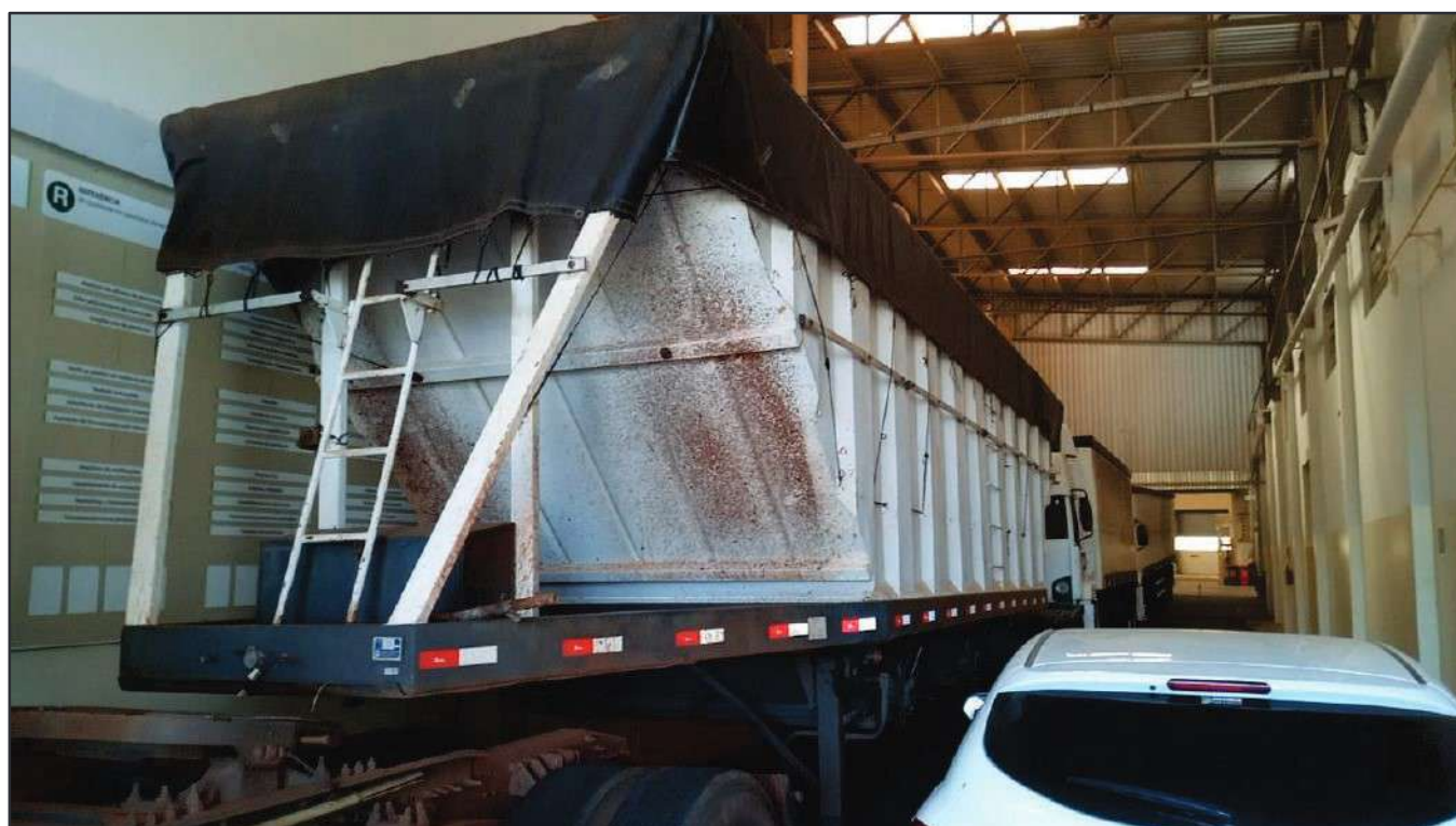
ITEM 014 - SEMI-REBOQUE GRANELEIRO PASTRE PLACA: DUT-7802