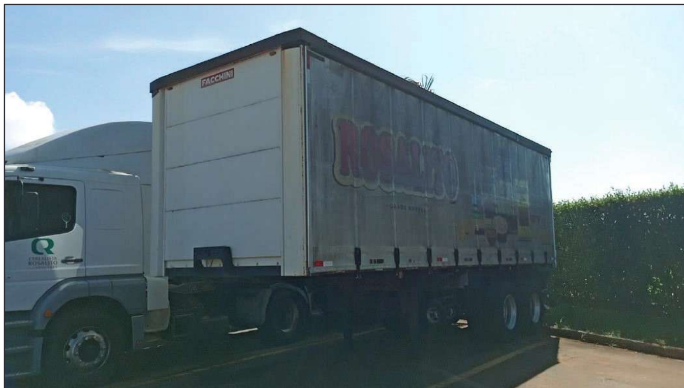
ITEM 010 - SEMI-REBOQUE FURGÃO FACCHINI PLACA: DUT-7416