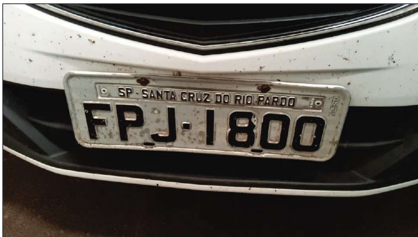
ITEM 039 - AUTOMÓVEL CHEVROLET (GM) ONIX PLACA: FPJ-1800