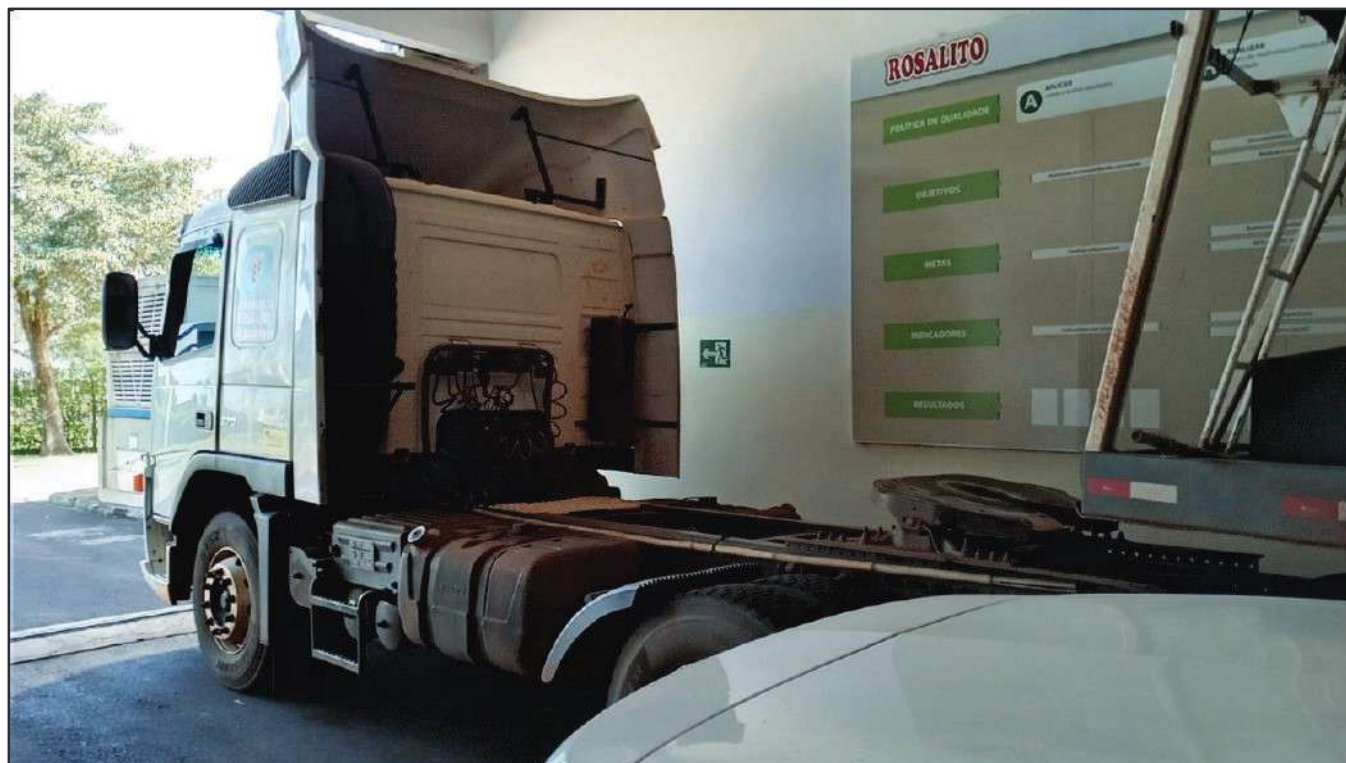
ITEM 022 - CAMINHÃO TRUCK VOLVO FM370 T PLACA: EAC-4927