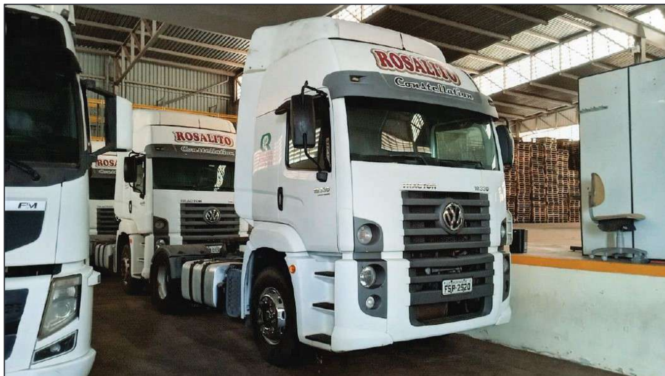
ITEM 040 - CAMINHÃO TOCO VOLKSWAGEM 19-330 CTC PLACA: FSP-2520