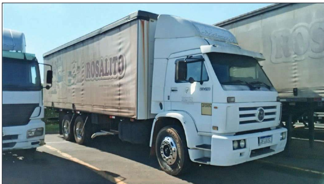
ITEM 046 - CAMINHÃO TRUCK VOLKSWAGEM 23.210 MOTOR CUMMINS PLACA: DFI-3C92