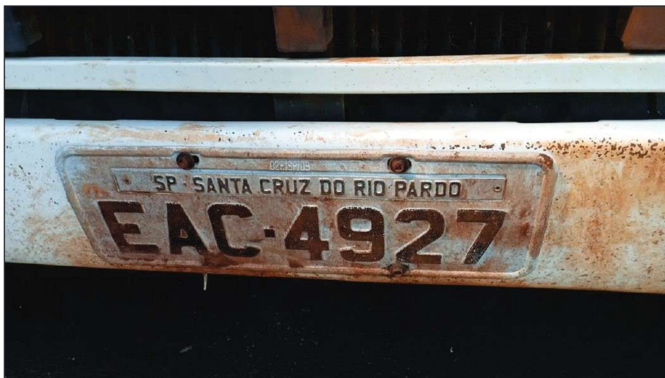
ITEM 022 - CAMINHÃO TRUCK VOLVO FM370 T PLACA: EAC-4927