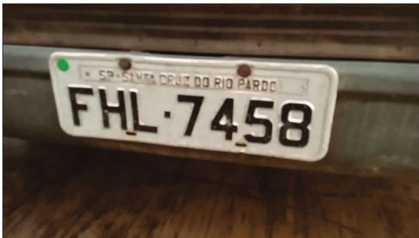
ITEM 037 - BI-TRUCK SCANIA P250 B8X2 PLACA: FHL-7458