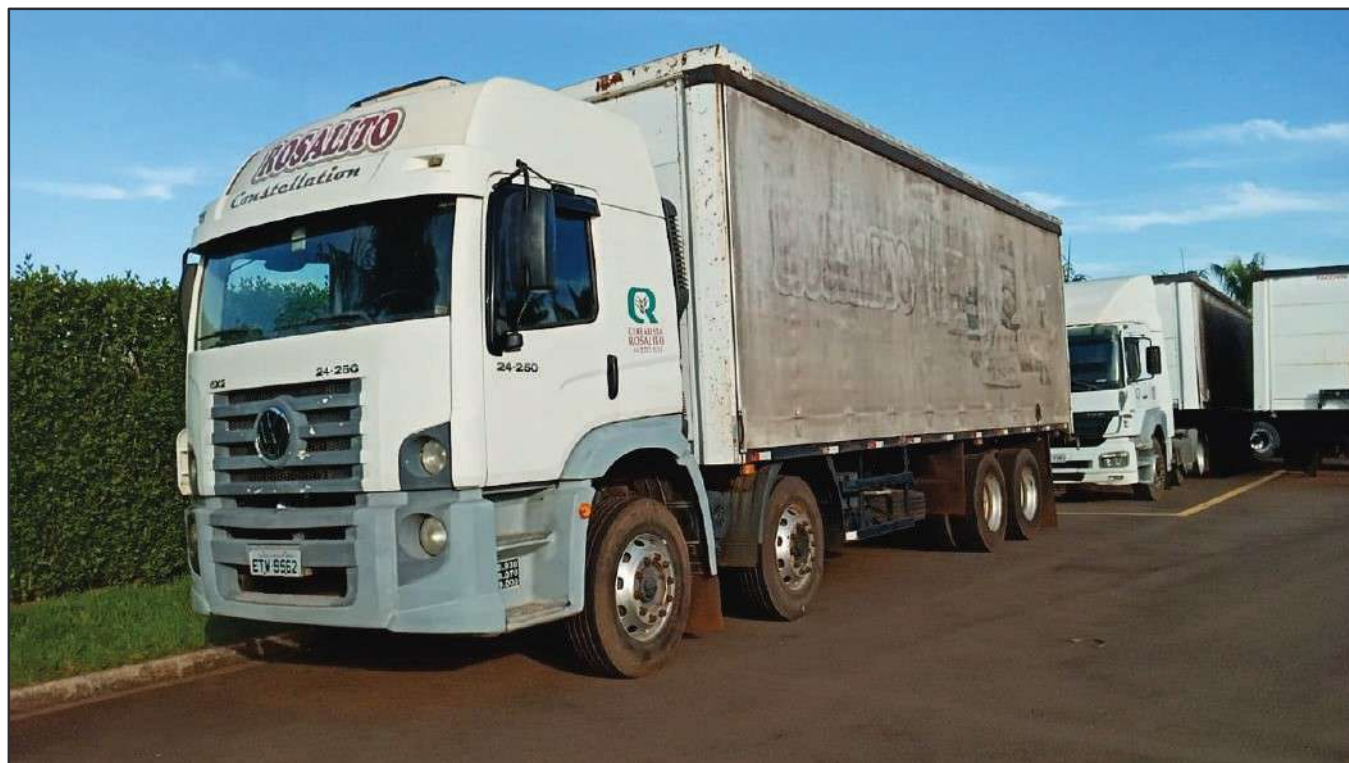
ITEM 029 - BI-TRUCK VOLKSWAGEM 24-250 CLC PLACA: ETW-9562