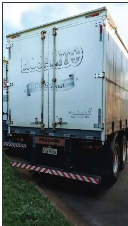
ITEM 028 - SEMI-REBOQUE FURGÃO FACCHINI PLACA: ETW-9375