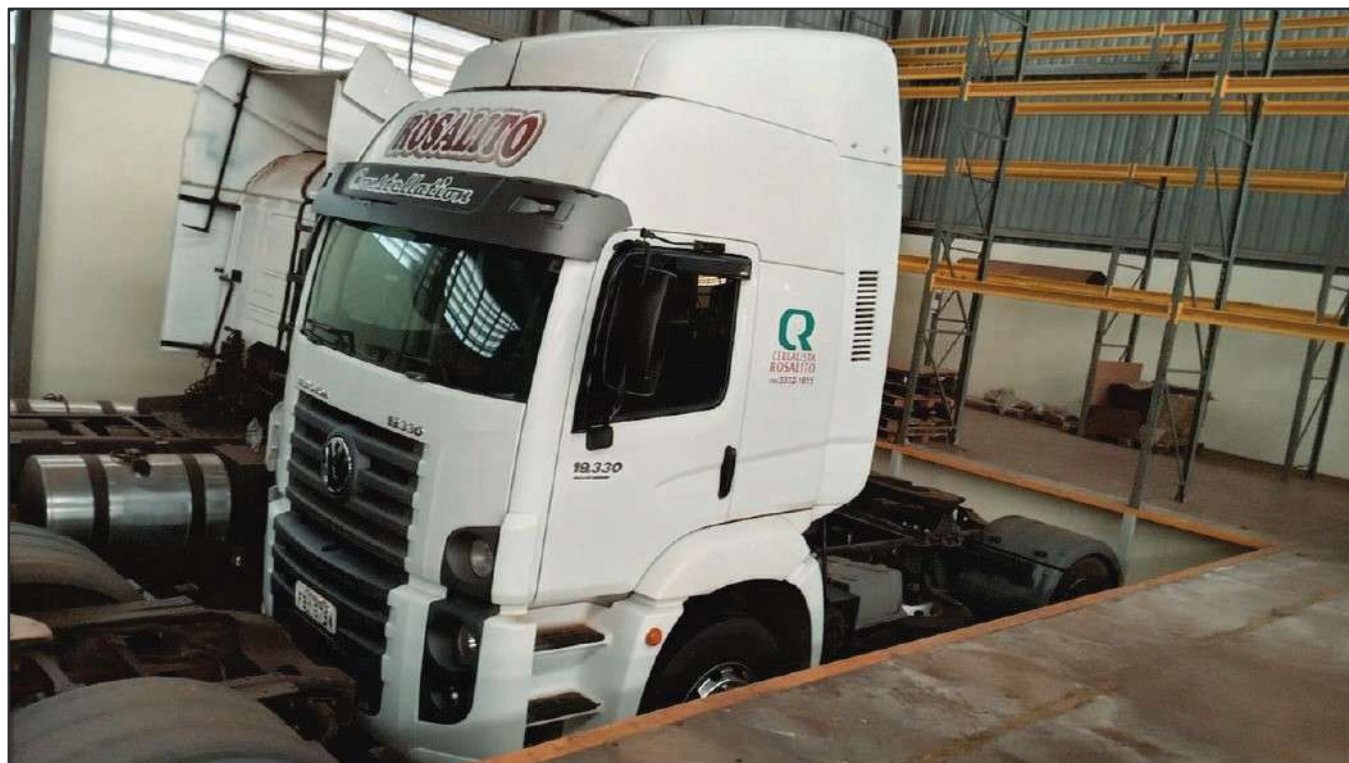
ITEM 030 - CAMINHÃO TOCO VOLKSWAGEM 19-330 CTC PLACA: FBY-6754