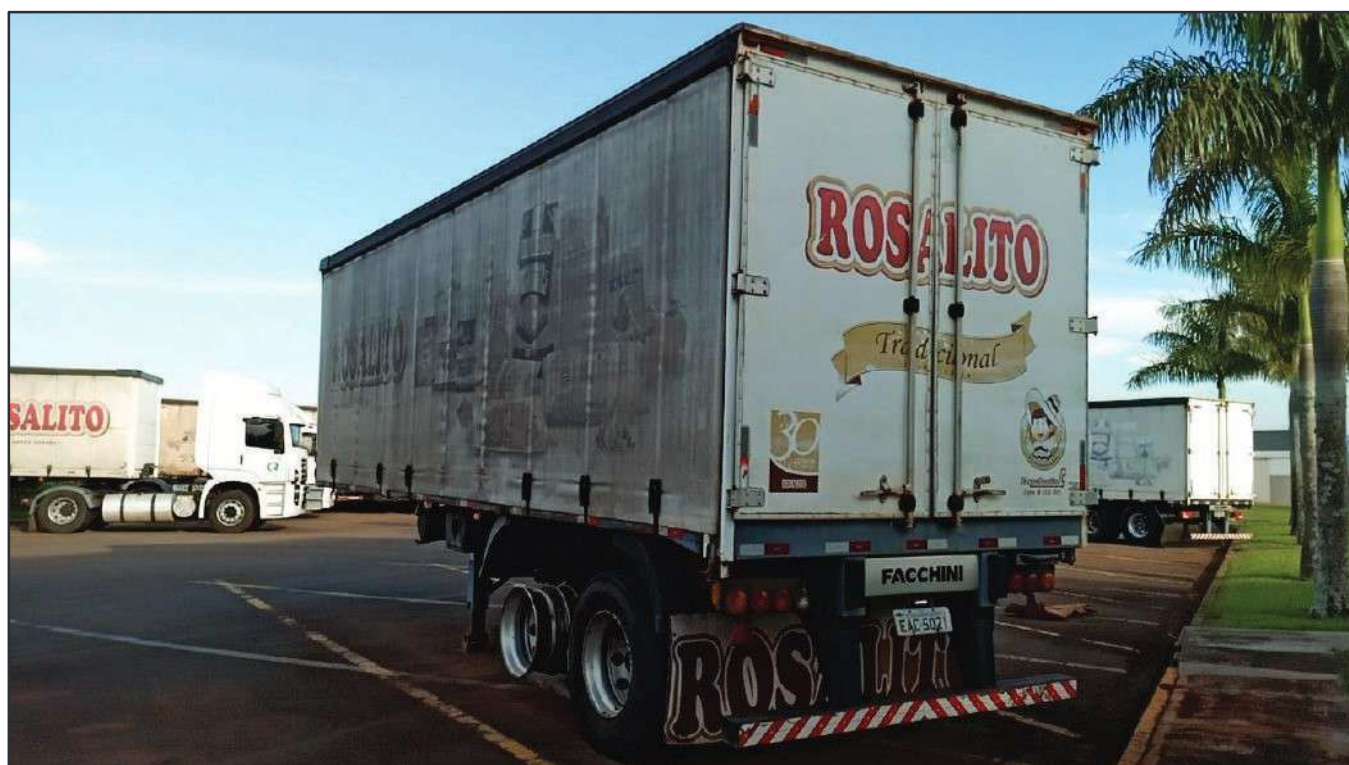
ITEM 023 - SEMI-REBOQUE FURGÃO FACCHINI PLACA: EAC-5021