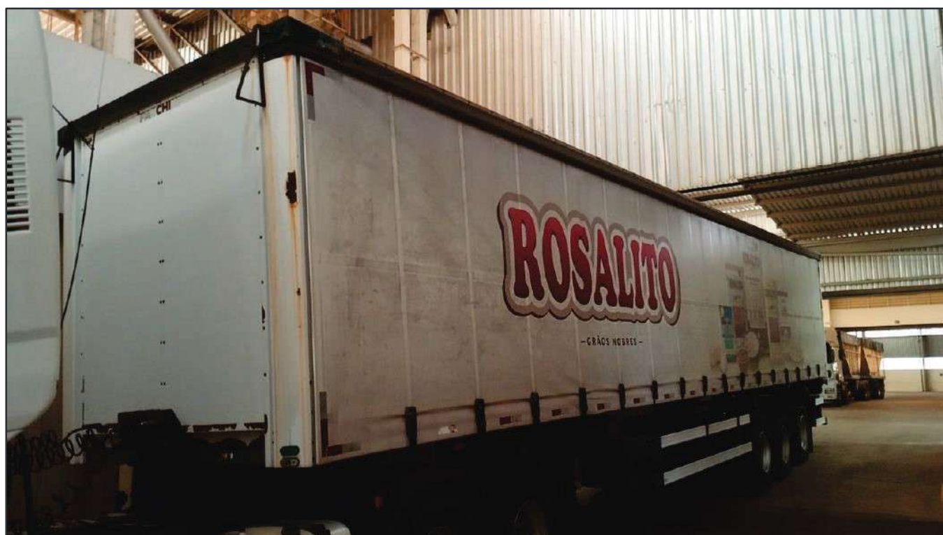
ITEM 045 - SEMI-REBOQUE FURGÃO FACCHINI PLACA: GFO-3269