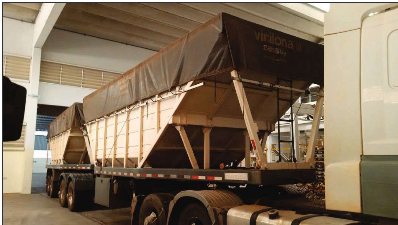
ITEM 004 - BI-TREM RANDON PLACA: DGQ-0481