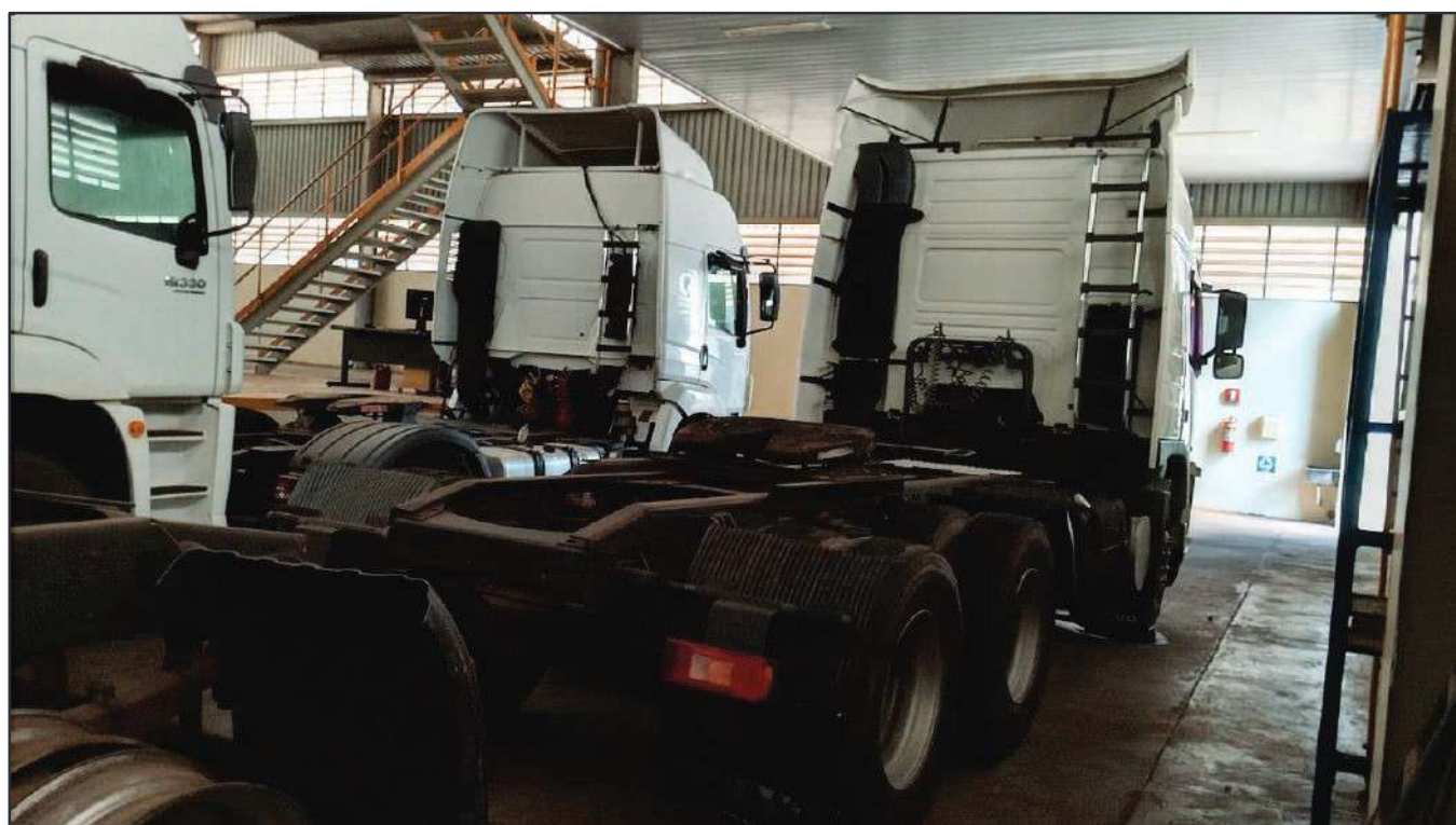
ITEM 027 - CAMINHÃO TRUCK VOLVO FM370 T PLACA: ETW-8947