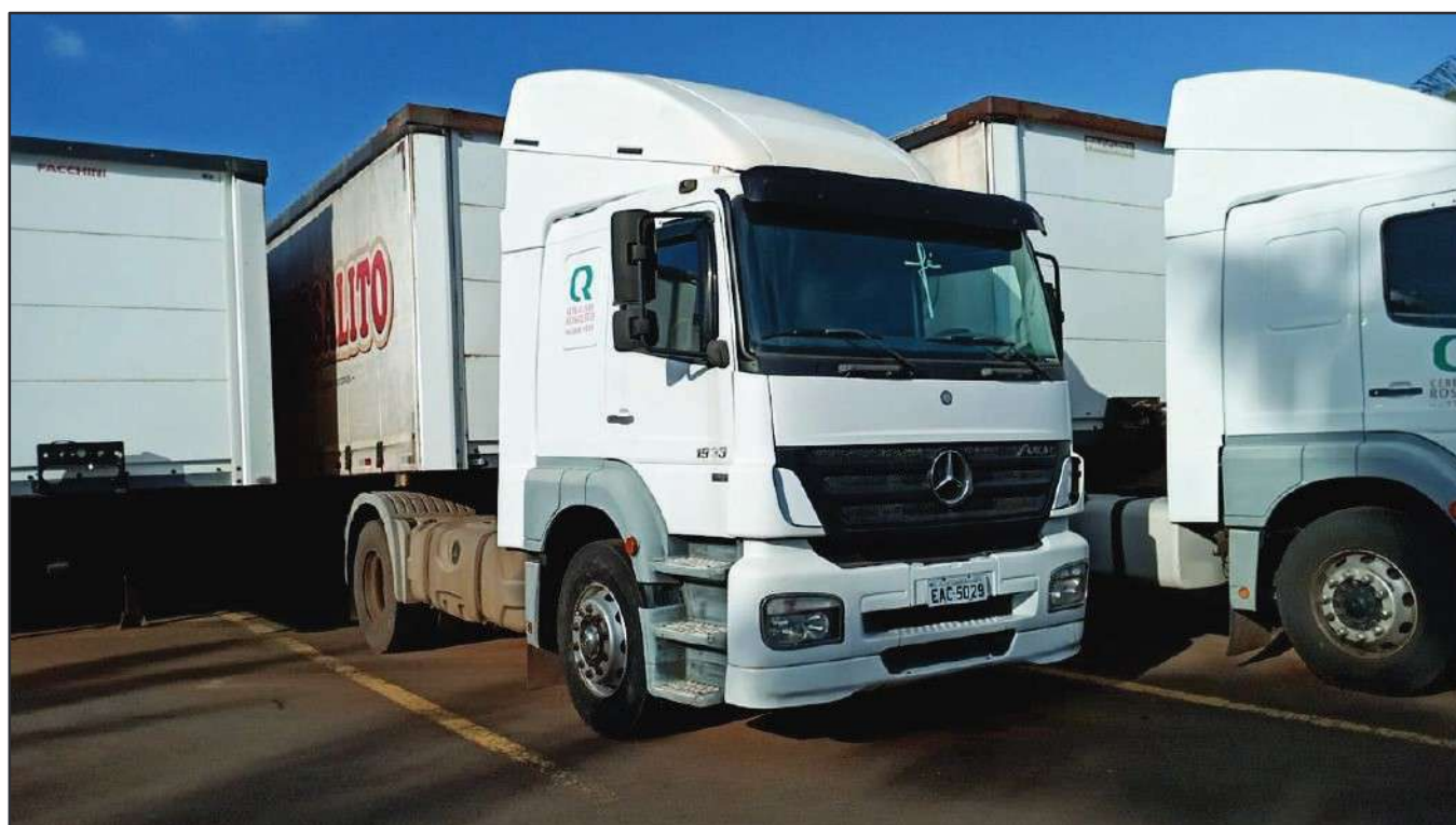
ITEM 025 - CAMINHÃO TOCO MERCEDES-BENZ AXOR 1933 S PLACA: EAC-5029