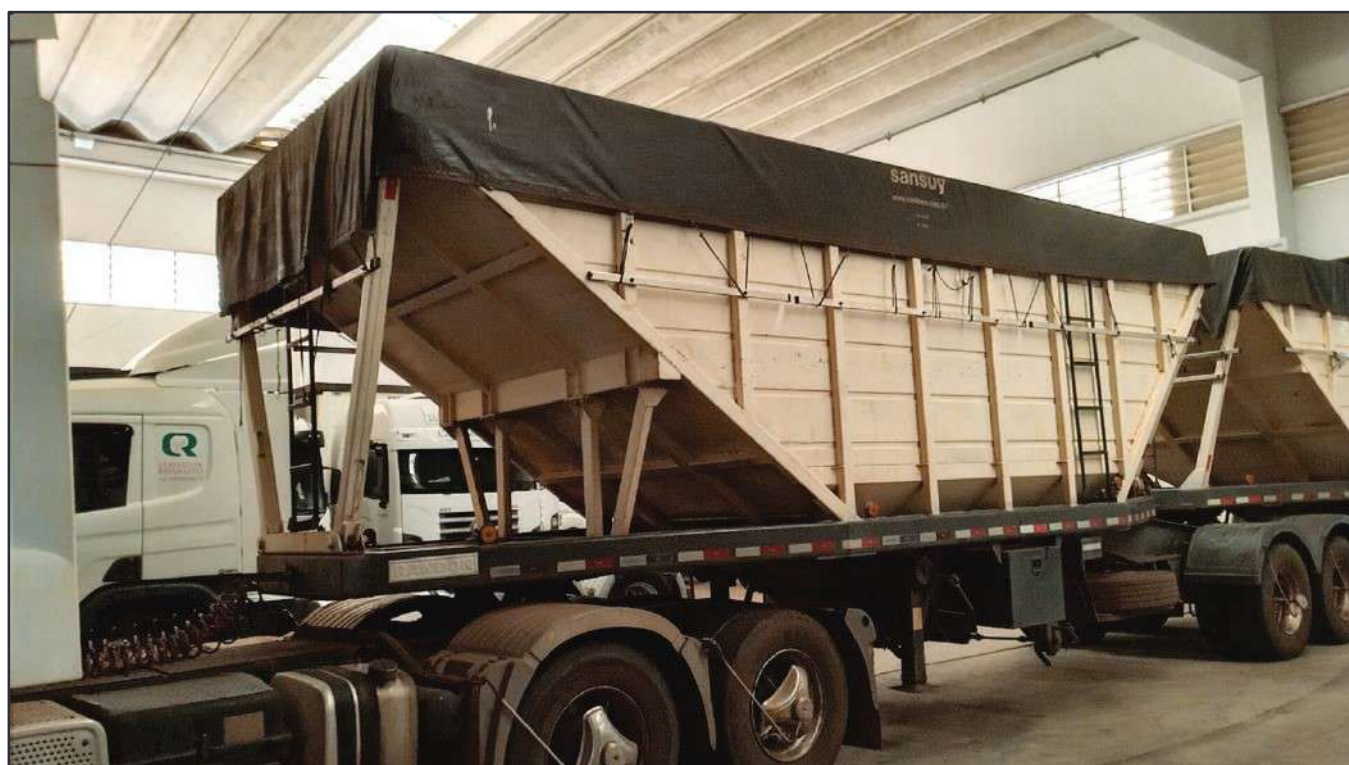
ITEM 004 - BI-TREM RANDON PLACA: DGQ-0481