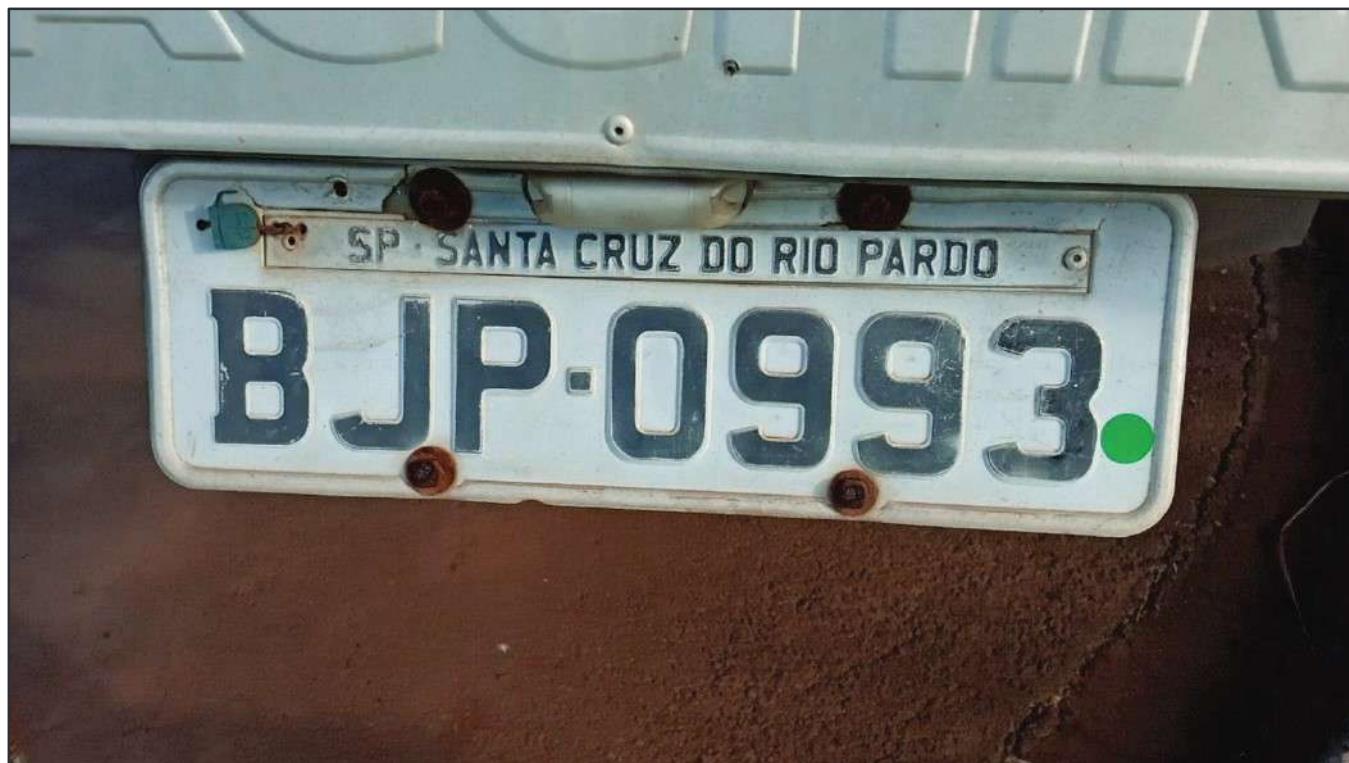
ITEM 001 - SEMI-REBOQUE FURGÃO NOMA PLACA: BJP-0993