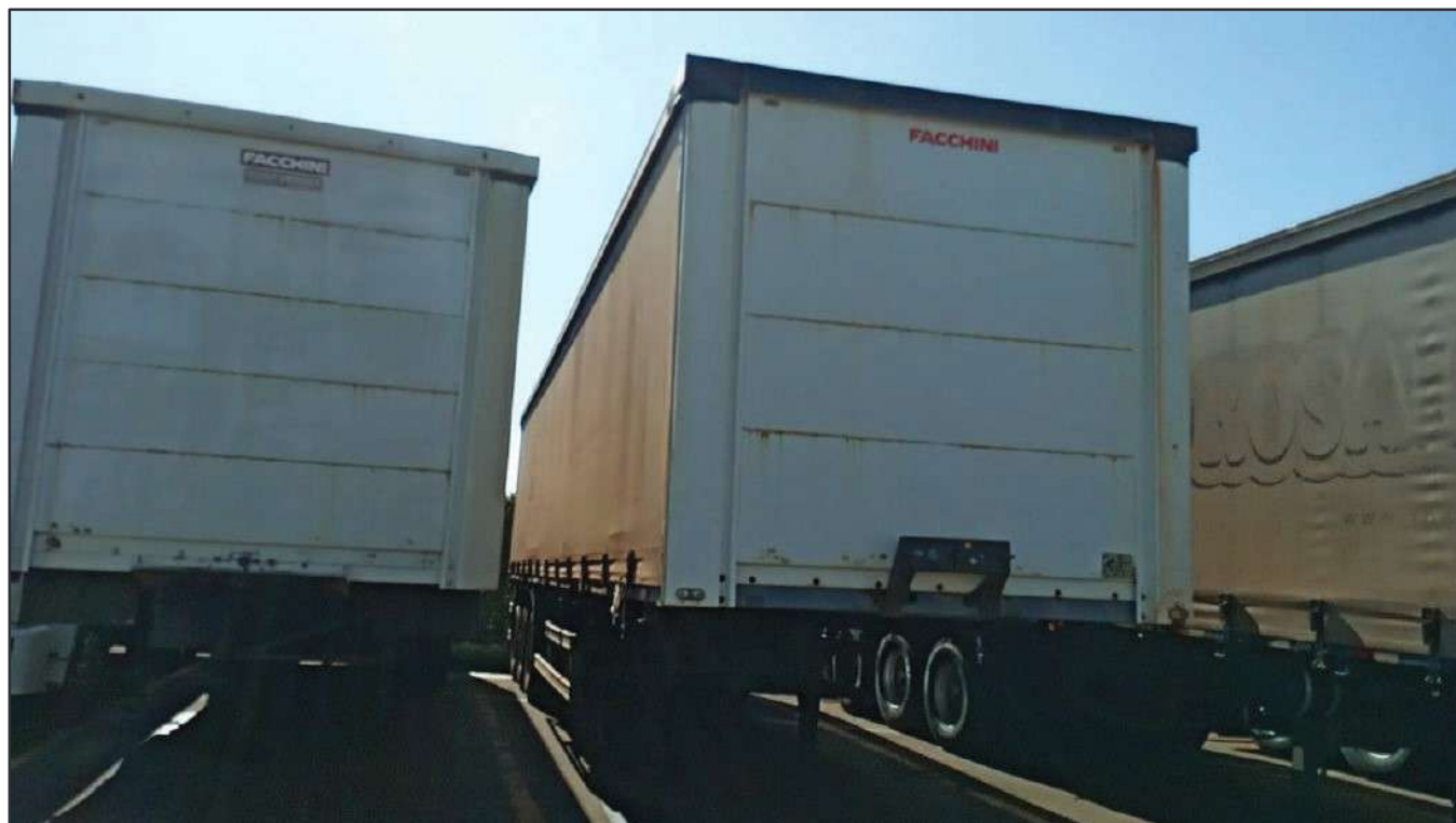
ITEM 036 - SEMI-REBOQUE FURGÃO FACCHINI PLACA: FHL-7257