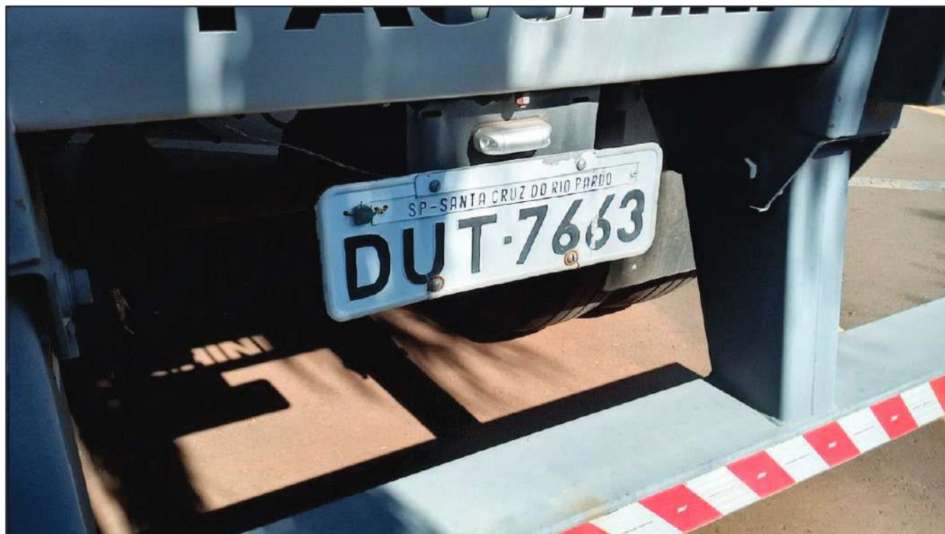
ITEM 012 - SEMI-REBOQUE FURGÃO FACCHINI PLACA: DUT-7663