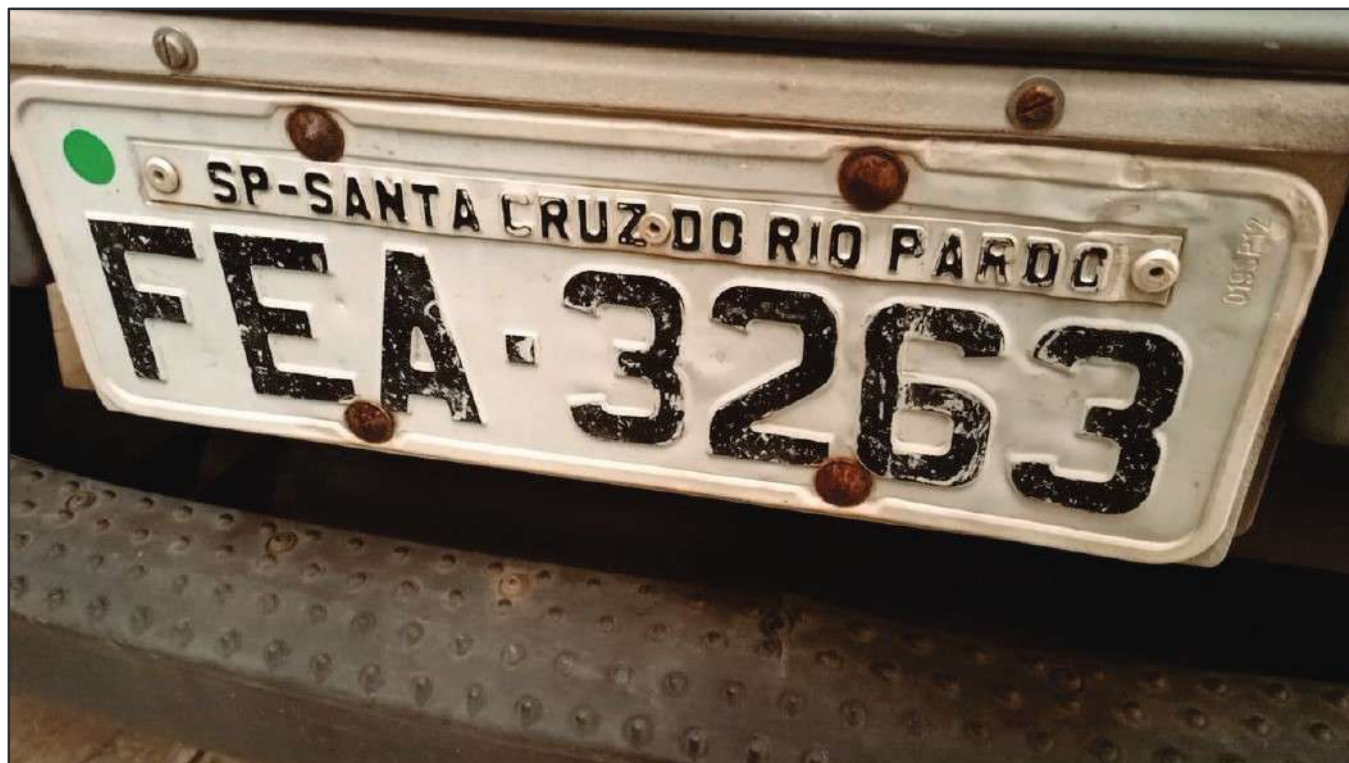
ITEM 031 - BI-TRUCK VOLKSWAGEM 24-280 CRM PLACA: FEA-3263