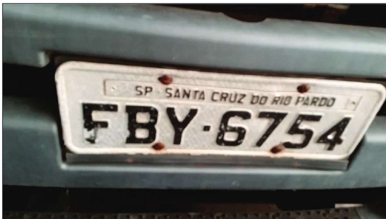
ITEM 030 - CAMINHÃO TOCO VOLKSWAGEM 19-330 CTC PLACA: FBY-6754