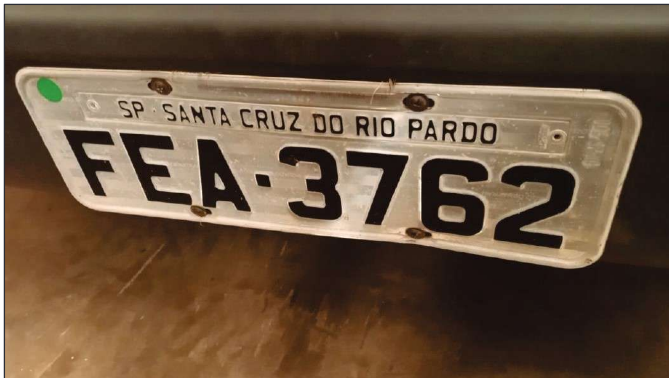
ITEM 033 - BI-TRUCK SCANIA P250 B8X2 PLACA: FEA-3762