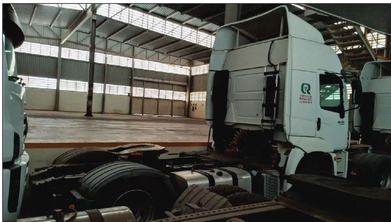
ITEM 042 - CAMINHÃO TOCO VOLKSWAGEM 19-330 CTC PLACA: FXR-0890