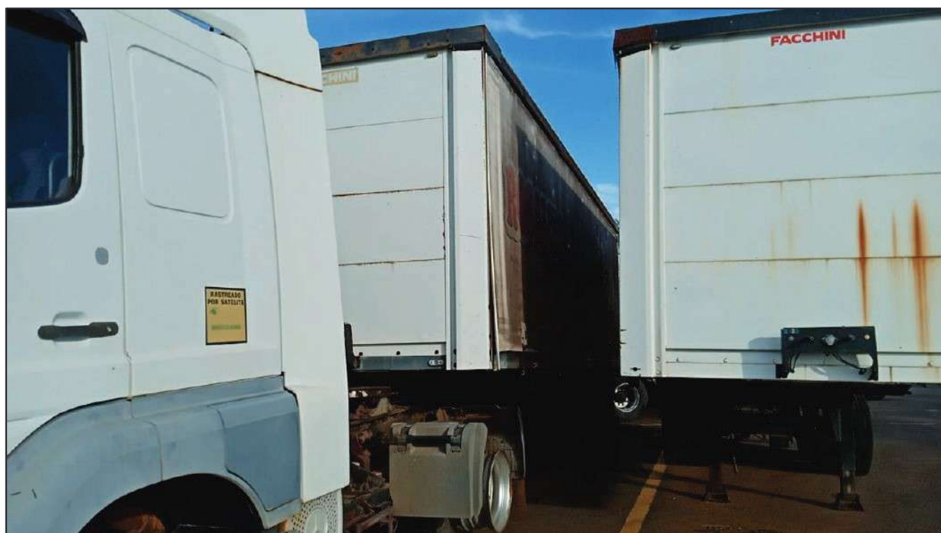
ITEM 020 - SEMI-REBOQUE FURGÃO FACCHINI PLACA: EAC-4532