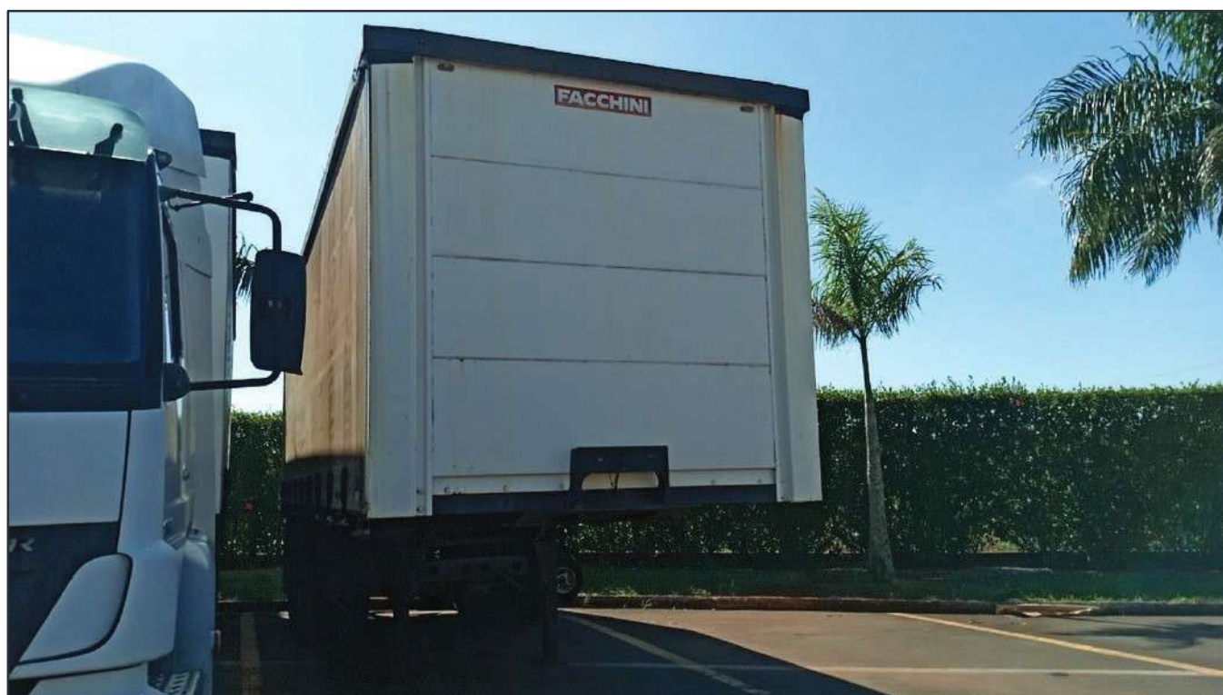
ITEM 010 - SEMI-REBOQUE FURGÃO FACCHINI PLACA: DUT-7416

Este documento é cópia do original, assinado digitalmente por RAFAEL VALERIO BRAGA MARTINS e Tribunal de Justiça do Estado de São Paulo, protocolado em 13/06/2023 às 21:27, sob o número WSCF033700202130. Para conferir o original, acesse o site https://esaj.tjsp.jus.br/pastadigital/pg/abrirConferenciaDocumento.do , informe o processo 1000701-23.2021.8.26.0539 e código D418766.