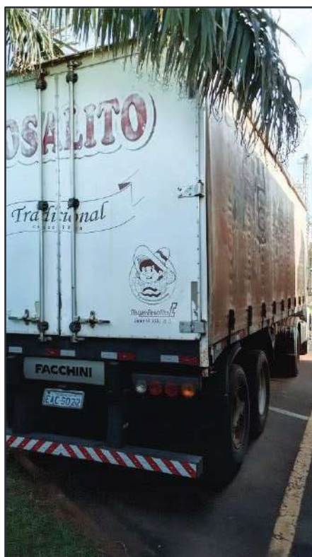
ITEM 024 - SEMI-REBOQUE FURGÃO FACCHINI PLACA: EAC-5022