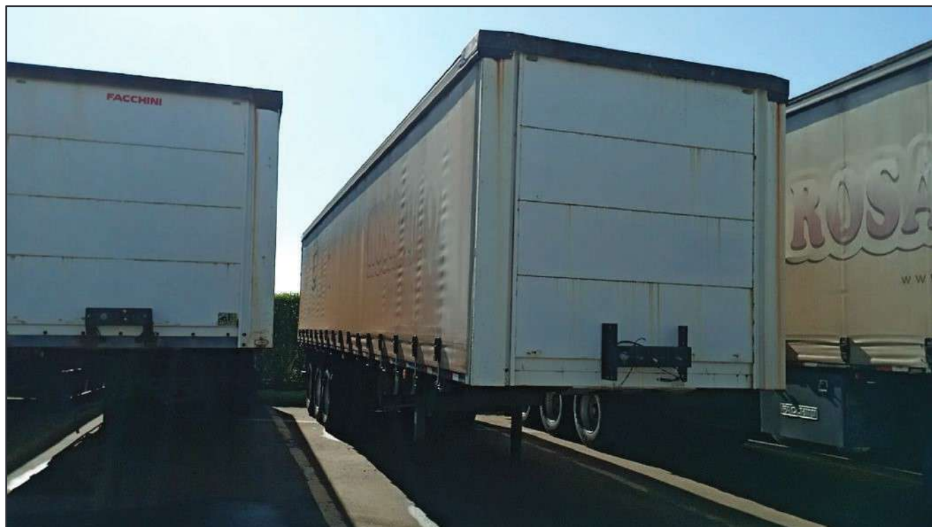
ITEM 003 - SEMI-REBOQUE FURGÃO FACCHINI PLACA: DGQ-0369