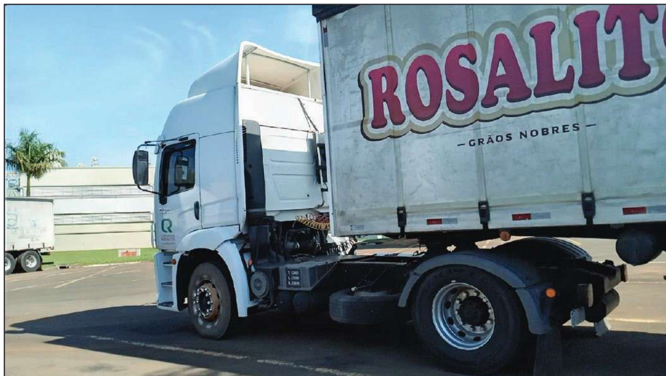
ITEM 026 - CAMINHÃO TOCO VOLKSWAGEM 19-320 CONSTELLATION CLC TT PLACA: EPI-9871