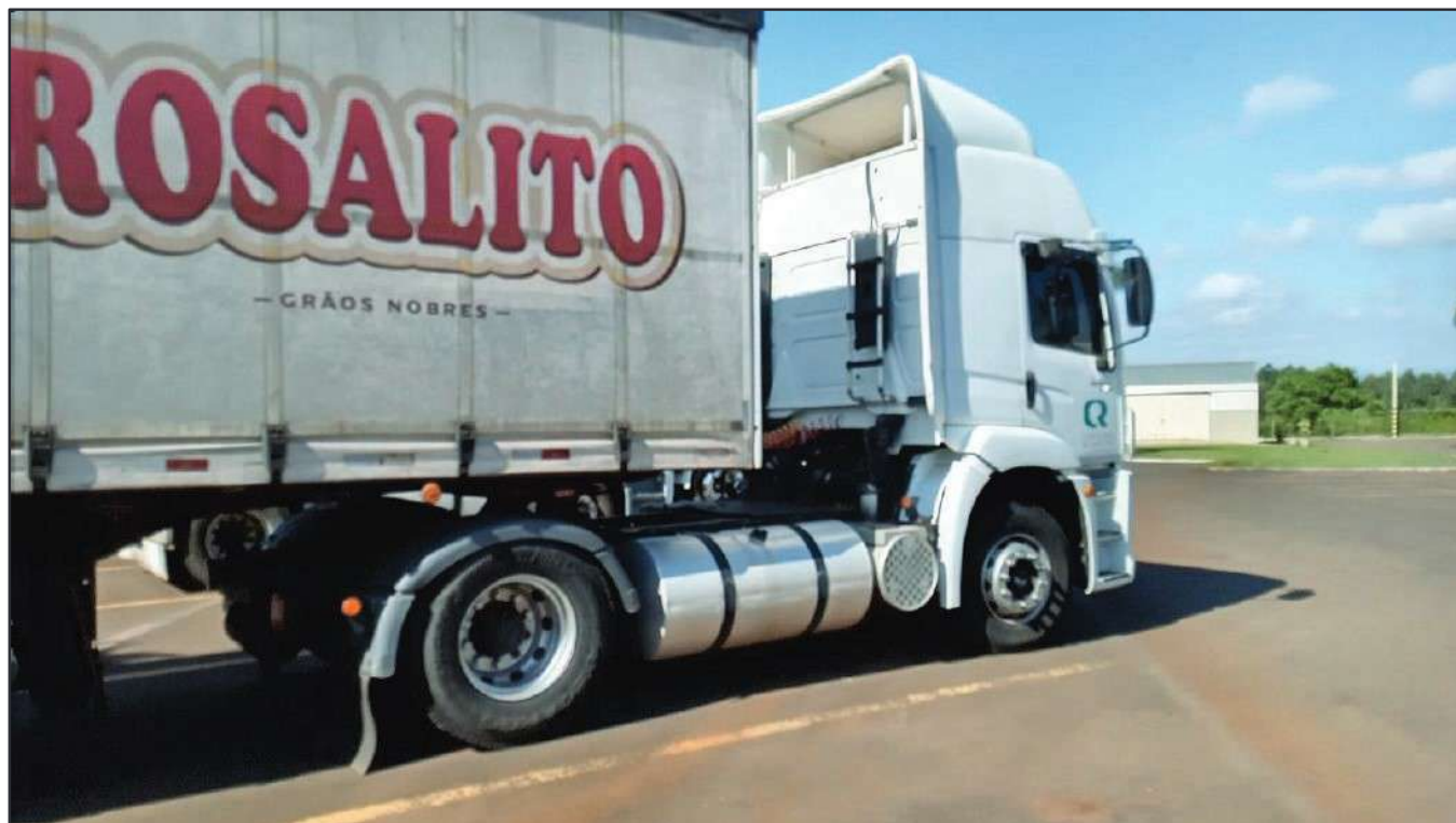
ITEM 026 - CAMINHÃO TOCO VOLKSWAGEM 19-320 CONSTELLATION CLC TT PLACA: EPI-9871