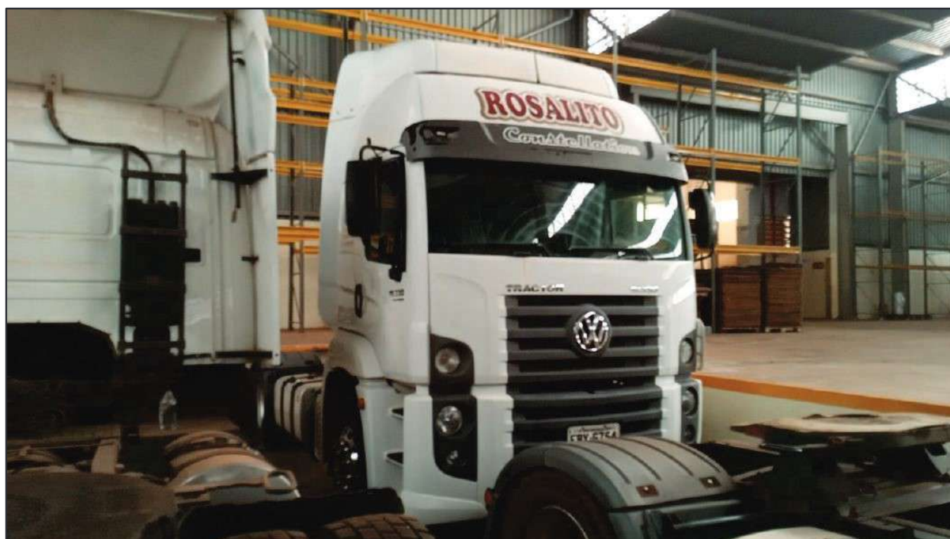
ITEM 030 - CAMINHÃO TOCO VOLKSWAGEM 19-330 CTC PLACA: FBY-6754