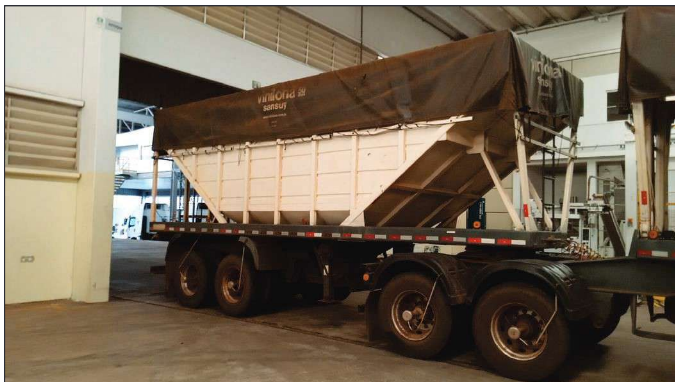
ITEM 005 - BI-TREM RANDON PLACA: DGQ-0482