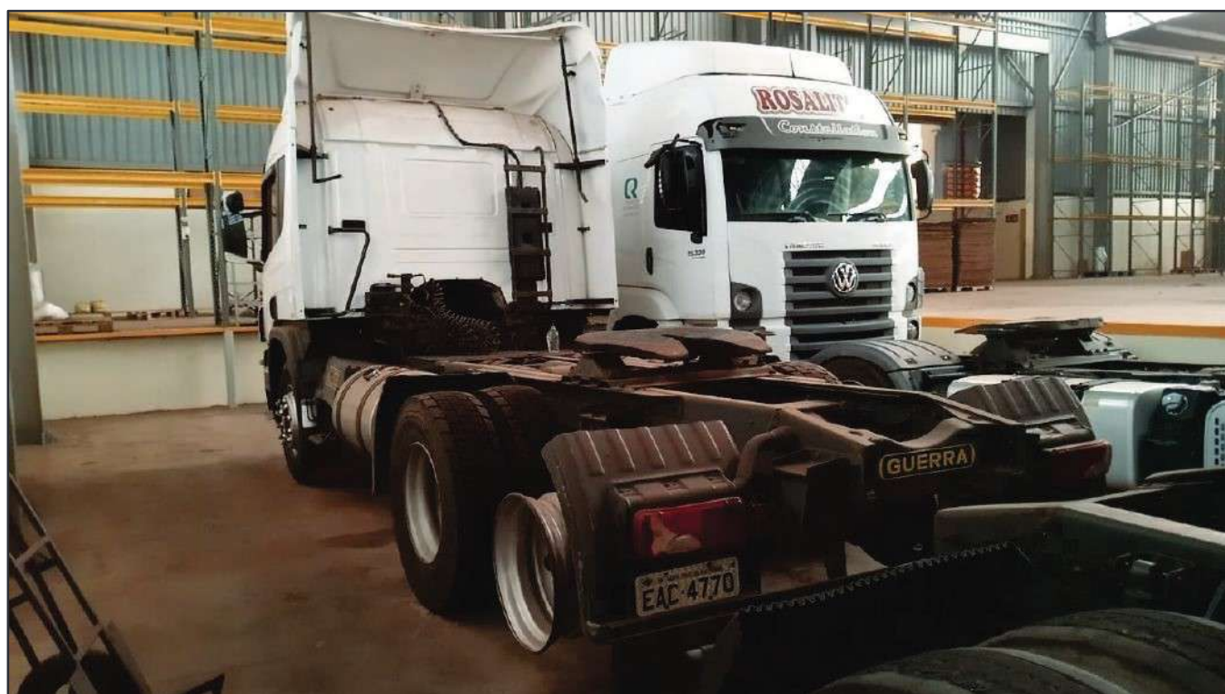
ITEM 021 - CAMINHÃO TRUCK SCANIA P340 A PLACA: EAC-4770