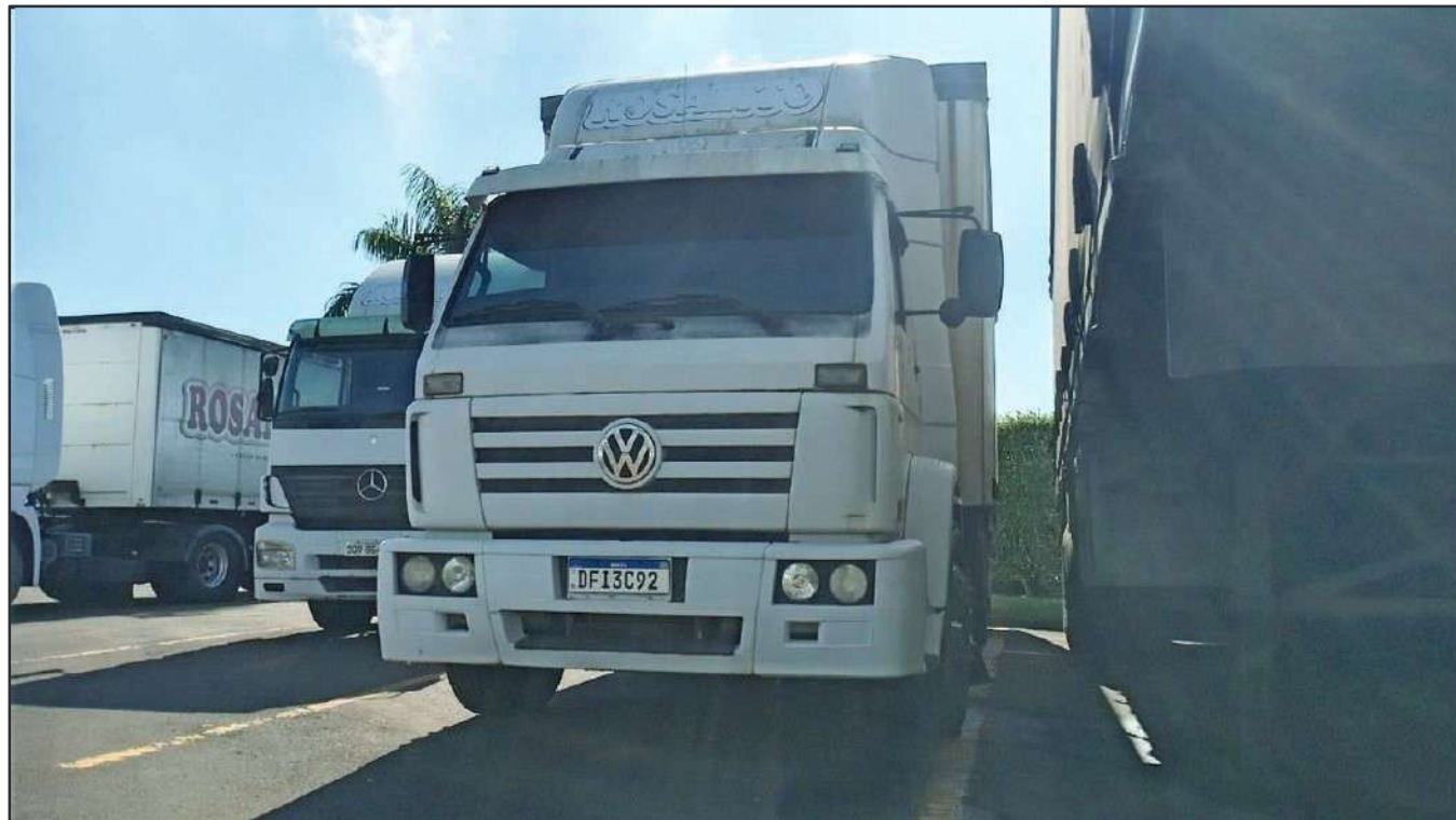
ITEM 046 - CAMINHÃO TRUCK VOLKSWAGEM 23.210 MOTOR CUMMINS PLACA: DFI-3C92