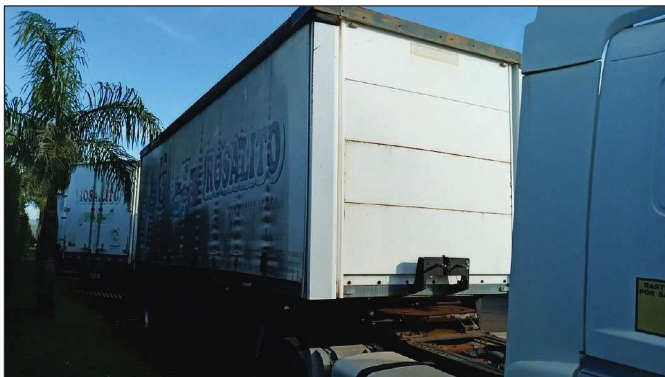
ITEM 020 - SEMI-REBOQUE FURGÃO FACCHINI PLACA: EAC-4532