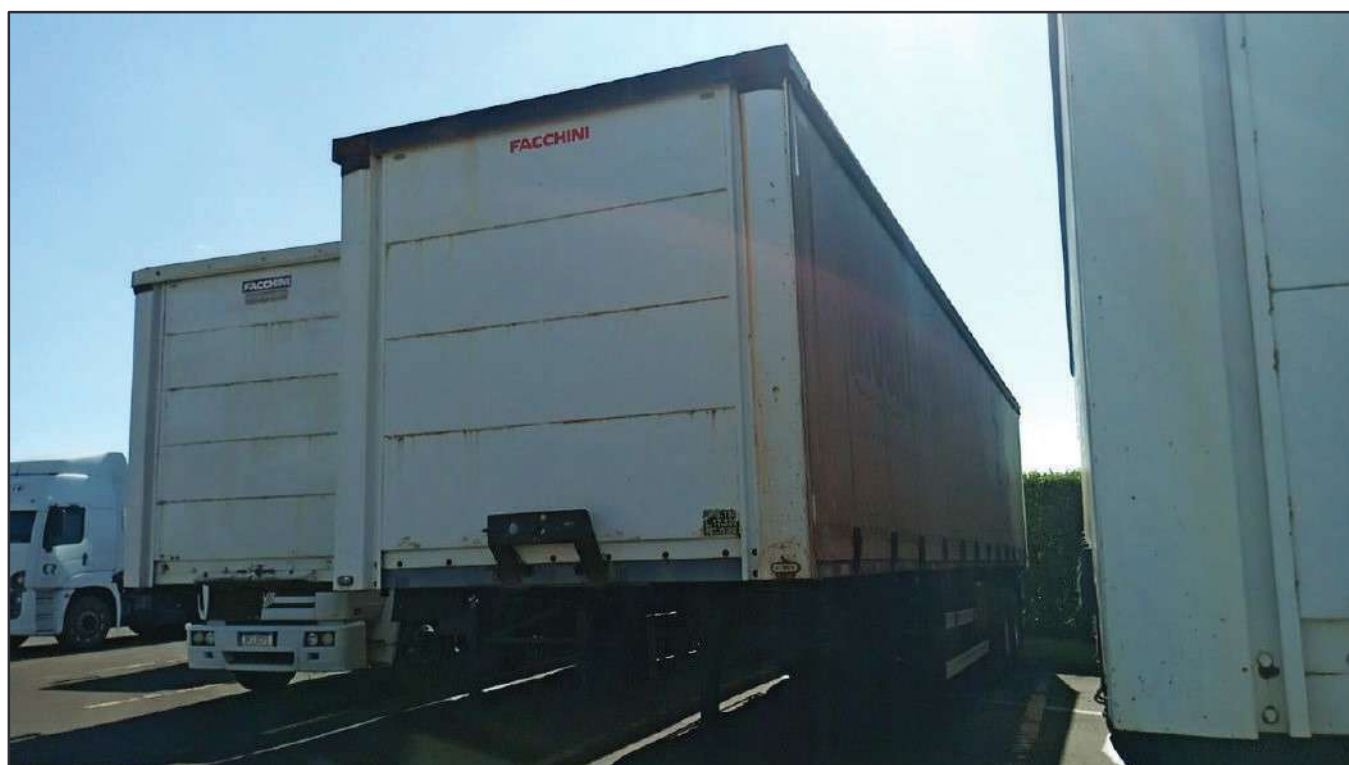
ITEM 036 - SEMI-REBOQUE FURGÃO FACCHINI PLACA: FHL-7257