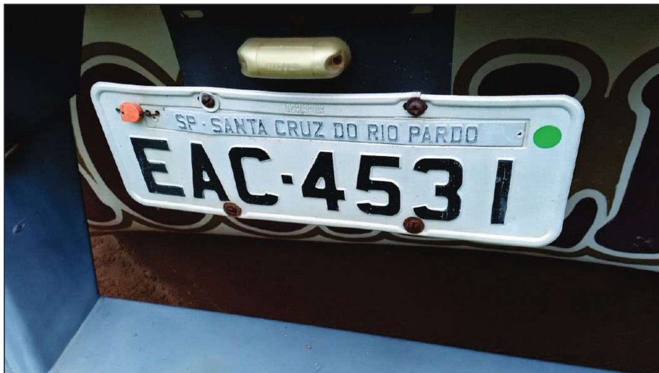
ITEM 019 - SEMI-REBOQUE FURGÃO FACCHINI PLACA: EAC-4531