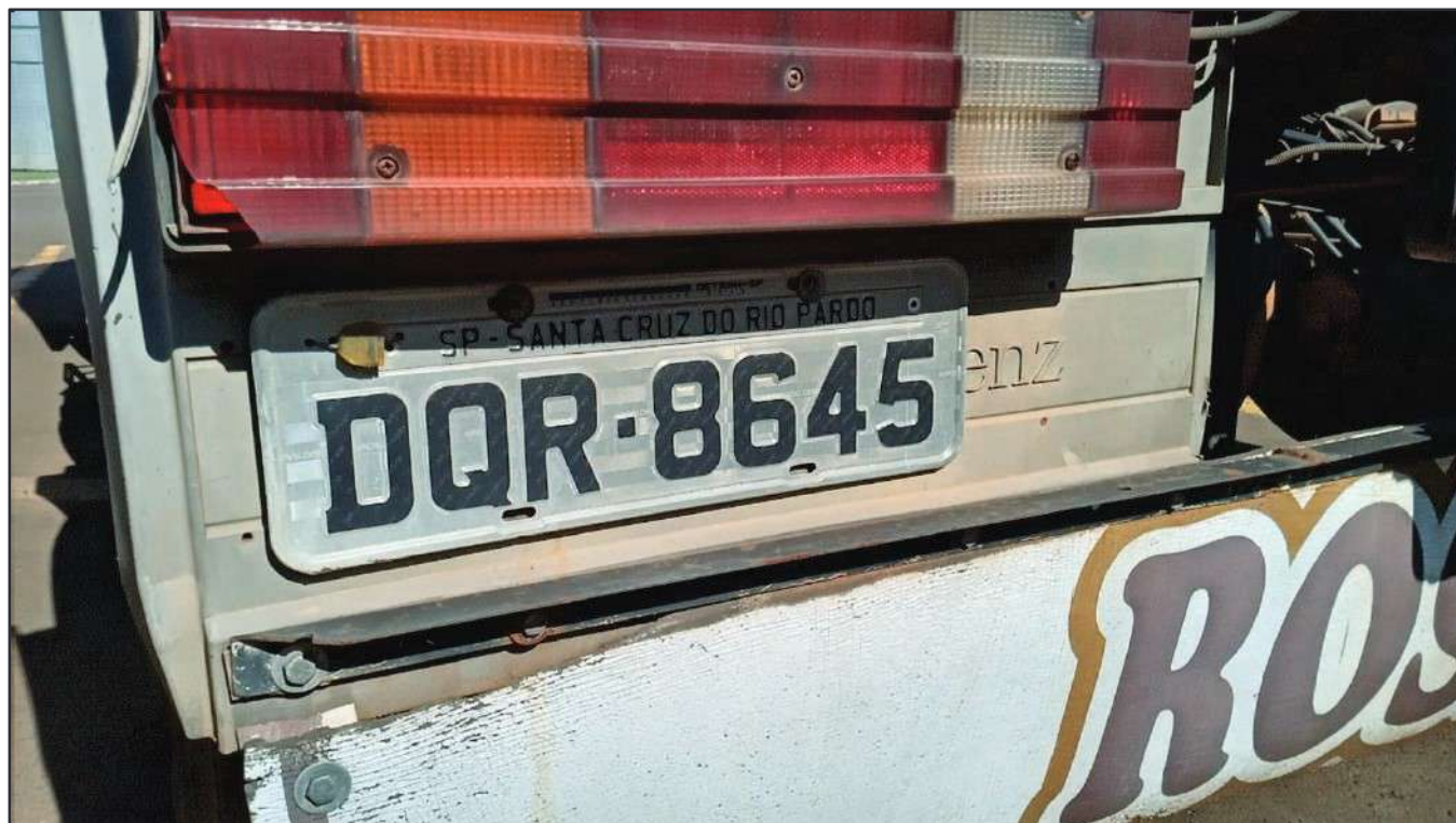
ITEM 008 - CAMINHÃO TOCO MERCEDES-BENZ AXOR 1933 S PLACA: DQR-8645