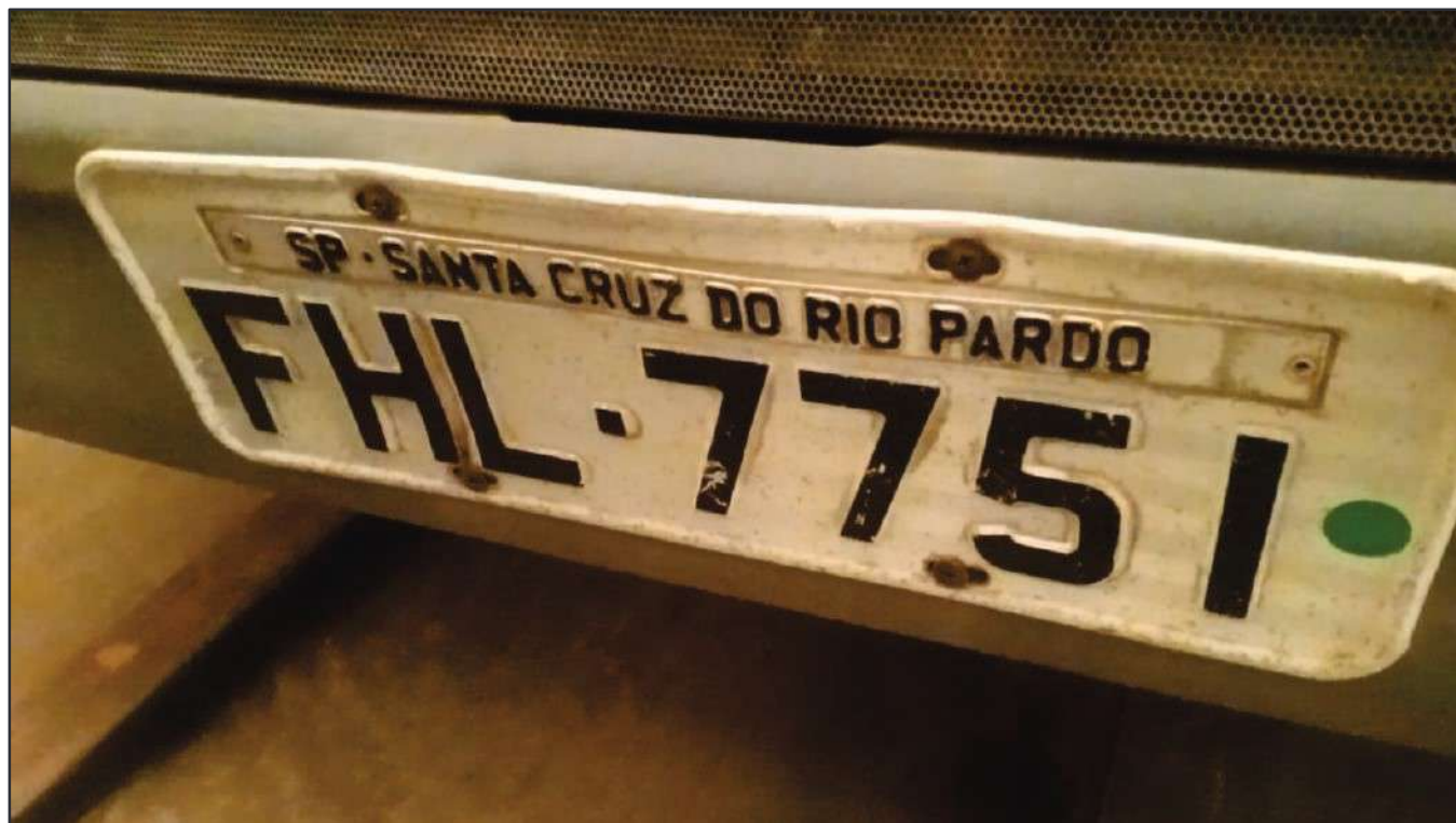
ITEM 038 - BI-TRUCK SCANIA P250 B8X2 PLACA: FHL-7751