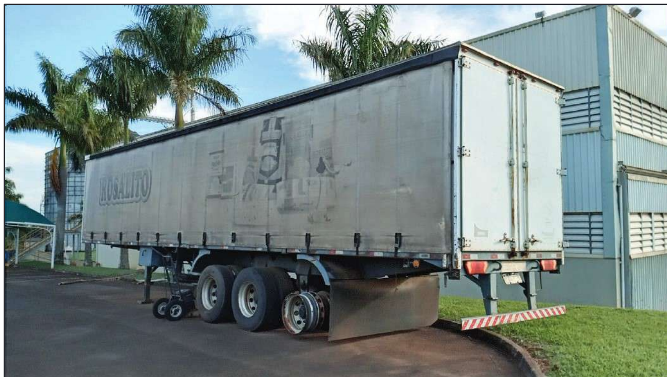
ITEM 001 - SEMI-REBOQUE FURGÃO NOMA PLACA: BJP-0993