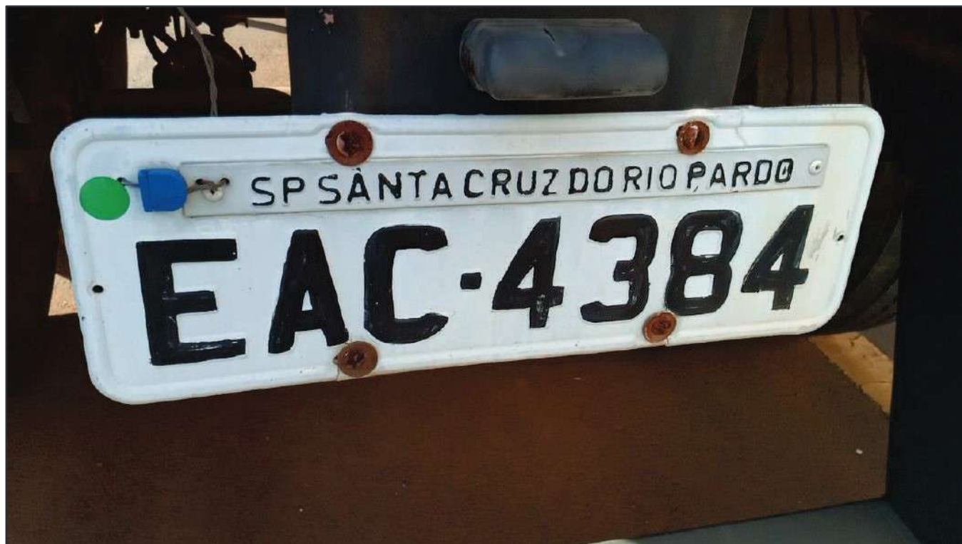
ITEM 016 - SEMI-REBOQUE FURGÃO FACCHINI PLACA: EAC-4384