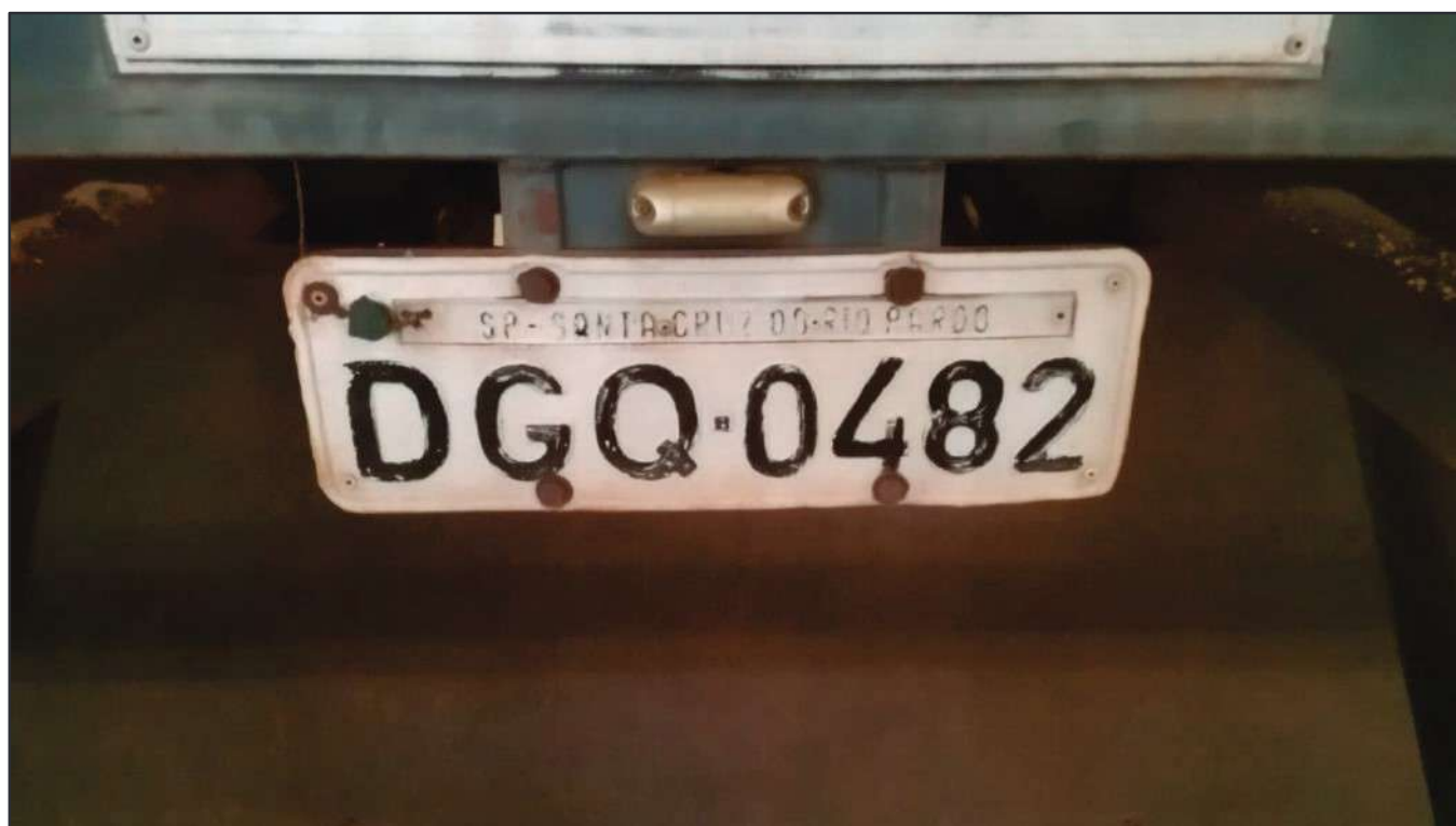
ITEM 005 - BI-TREM RANDON PLACA: DGQ-0482