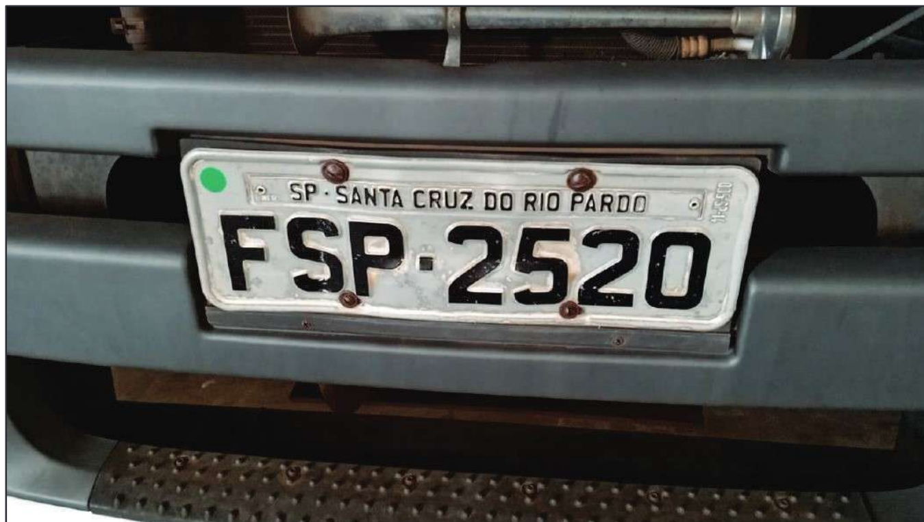
ITEM 040 - CAMINHÃO TOCO VOLKSWAGEM 19-330 CTC PLACA: FSP-2520