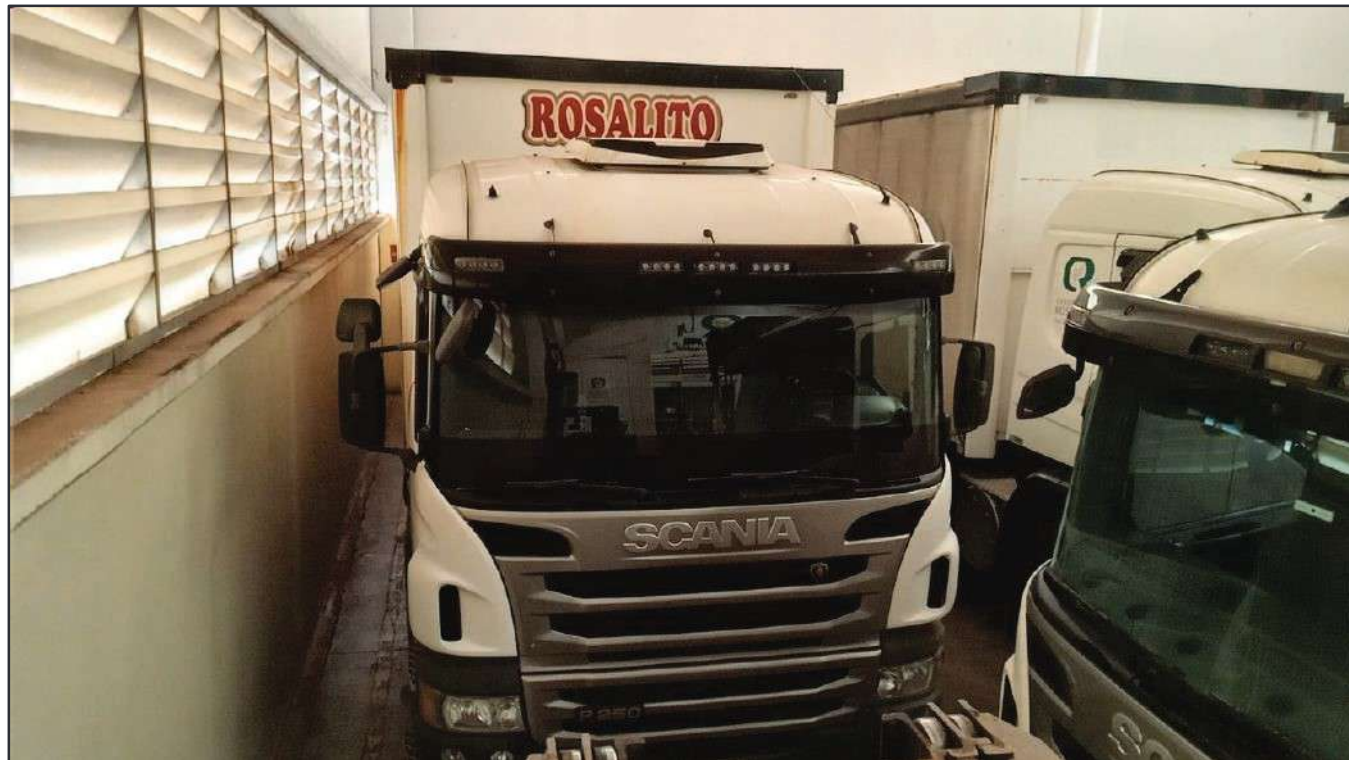
ITEM 038 - BI-TRUCK SCANIA P250 B8X2 PLACA: FHL-7751