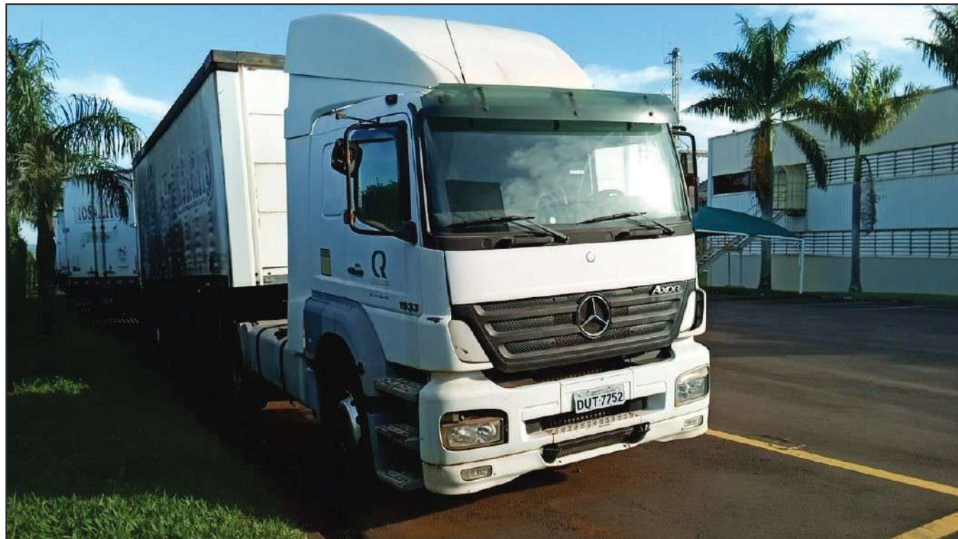
ITEM 013 - CAMINHÃO TOCO MERCEDES-BENZ AXOR 1933 S PLACA: DUT-7752