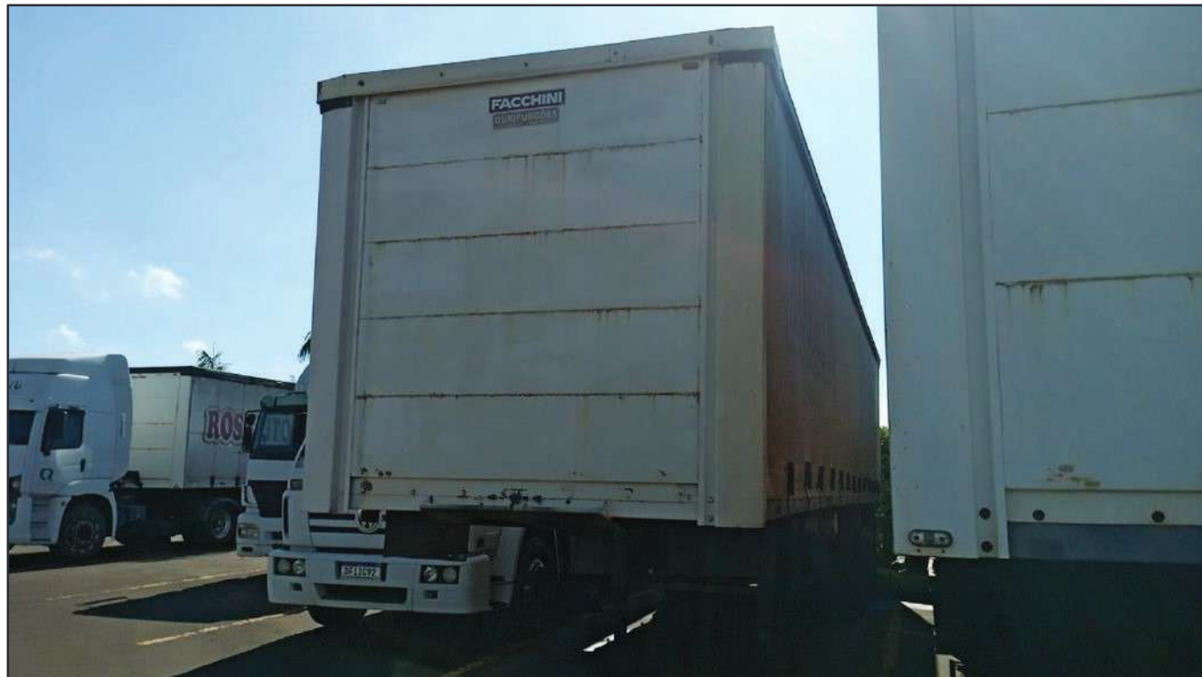
ITEM 002 - SEMI-REBOQUE FURGÃO RANDON PLACA: CTX-5979