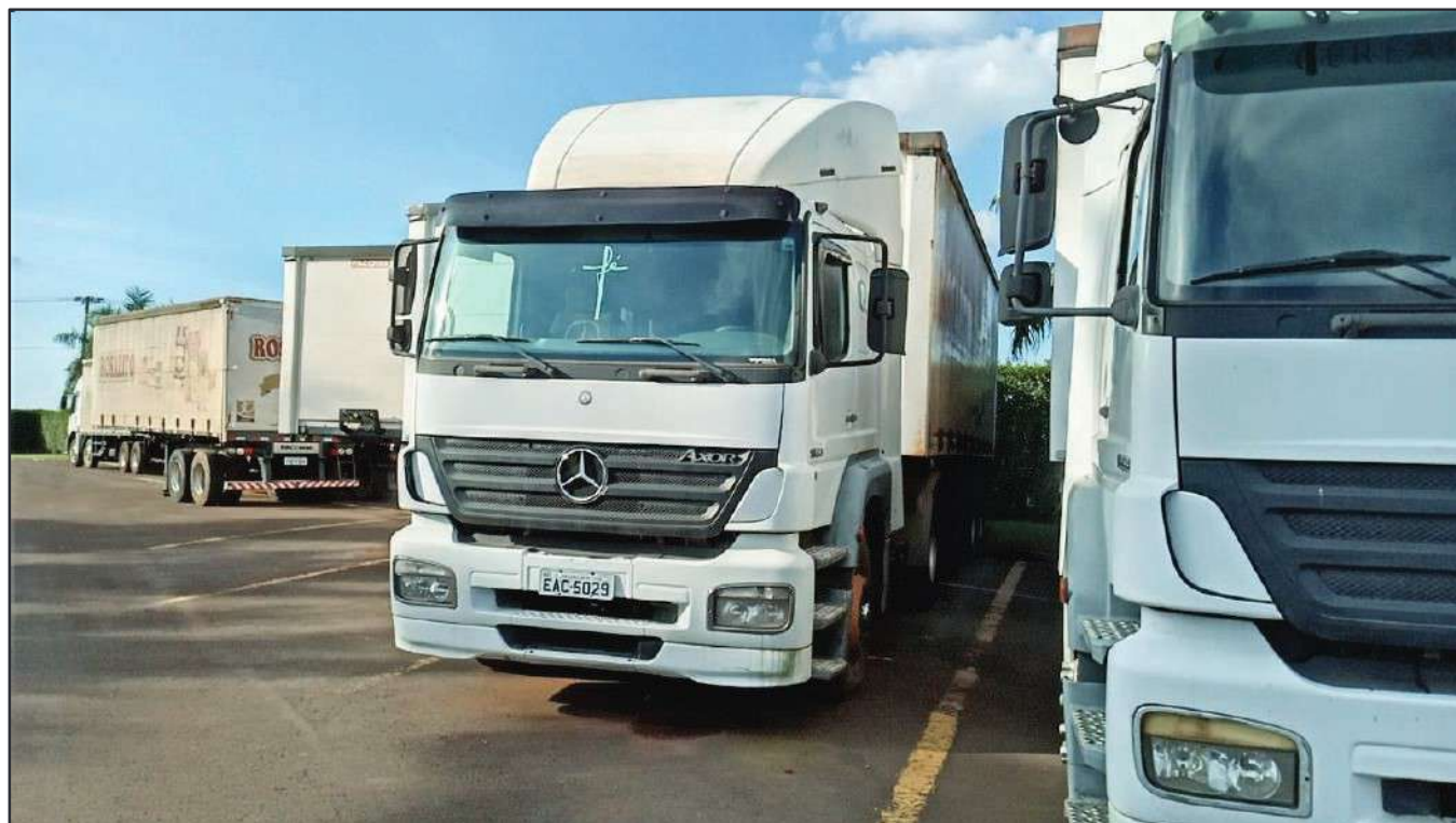
ITEM 025 - CAMINHÃO TOCO MERCEDES-BENZ AXOR 1933 S PLACA: EAC-5029