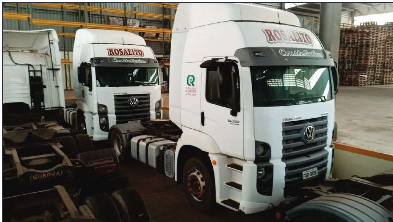
ITEM 042 - CAMINHÃO TOCO VOLKSWAGEM 19-330 CTC PLACA: FXR-0890