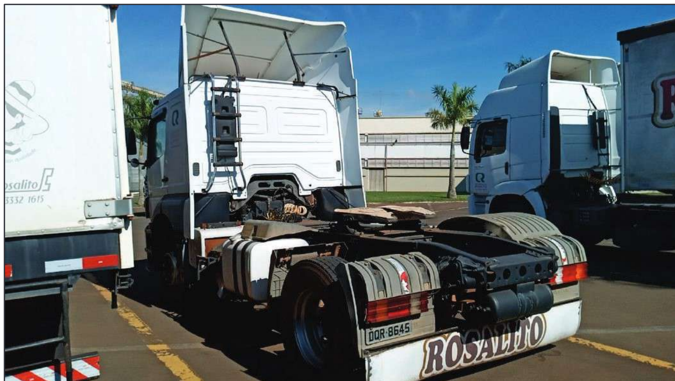
ITEM 008 - CAMINHÃO TOCO MERCEDES-BENZ AXOR 1933 S PLACA: DQR-8645