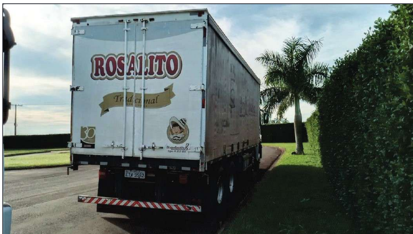
ITEM 029 - BI-TRUCK VOLKSWAGEM 24-250 CLC PLACA: ETW-9562