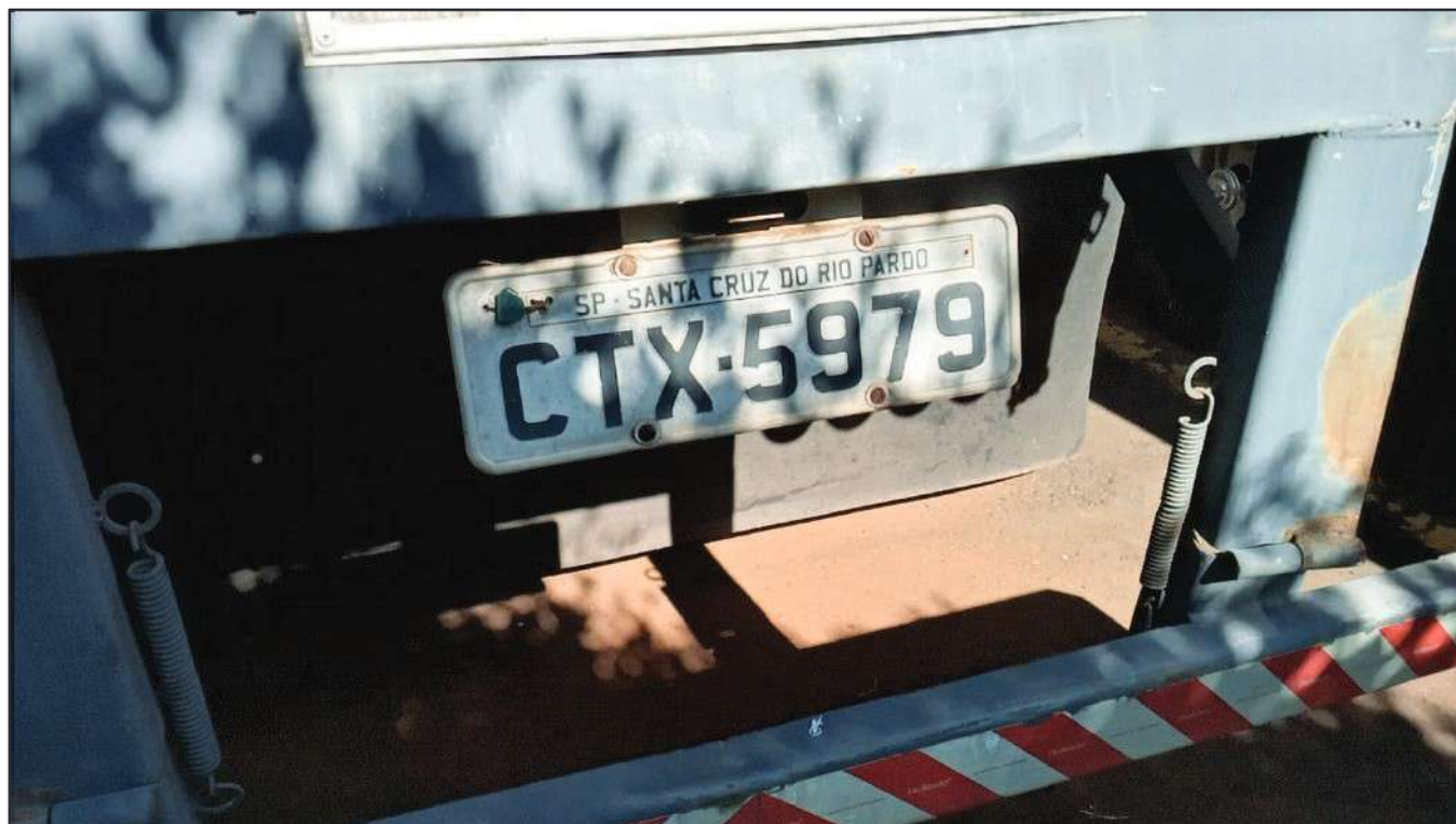
ITEM 002 - SEMI-REBOQUE FURGÃO RANDON PLACA: CTX-5979