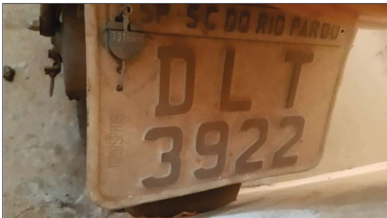
ITEM 047 - MOTO SUNDOWN WEB 100 PLACA: DLT-3922