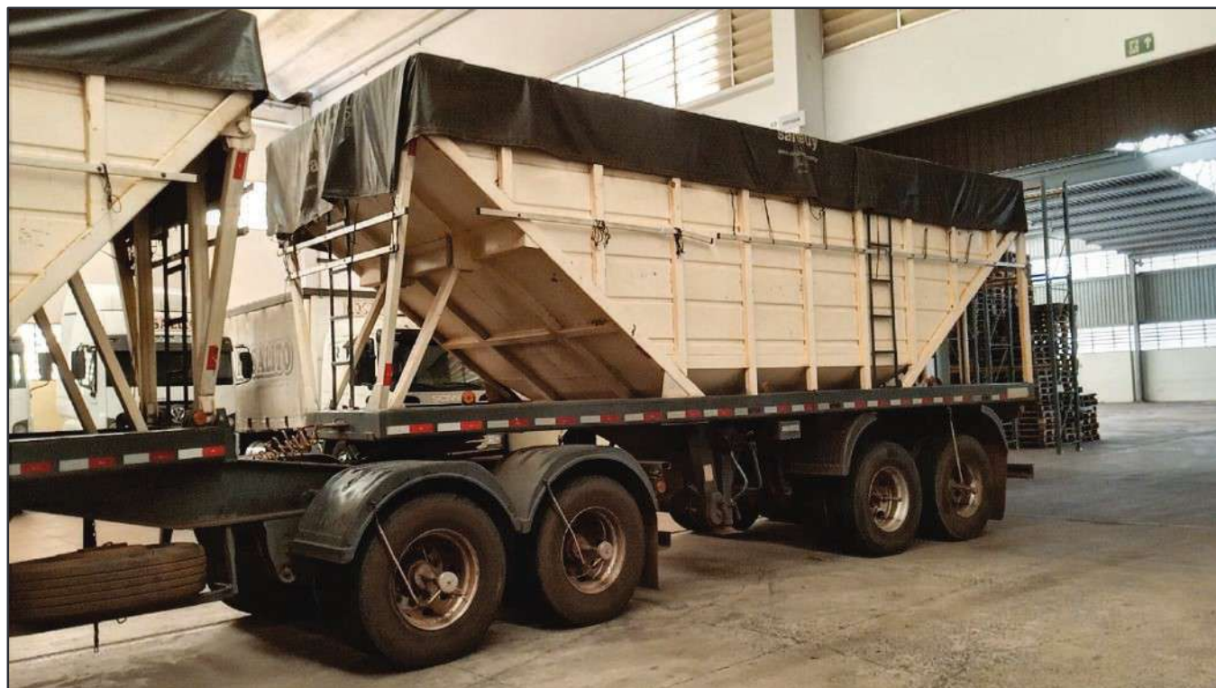
ITEM 005 - BI-TREM RANDON PLACA: DGQ-0482