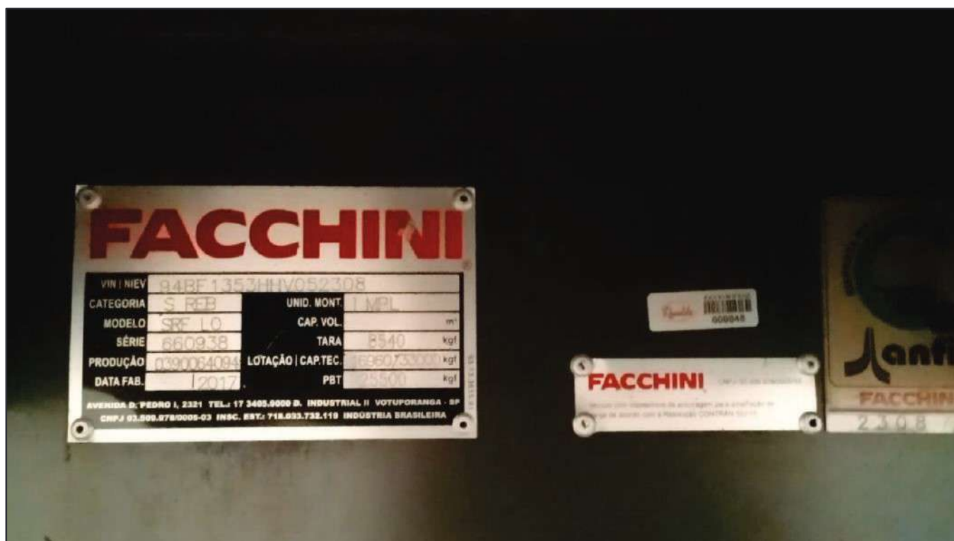
ITEM 045 - SEMI-REBOQUE FURGÃO FACCHINI PLACA: GFO-3269

Este documento é cópia do original, assinado digitalmente por RAFAEL VALERIO BRAGA MARTINS e Tribunal de Justiça do Estado de São Paulo, protocolado em 13/06/2023 às 21:27, sob o número WSCF033700202130. Para conferir o original, acesse o site https://esaj.tjsp.jus.br/pastadigital/pg/abrirConferenciaDocumento.do , informe o processo 1000101-23.2021.8.26.0539 e código D41877C.