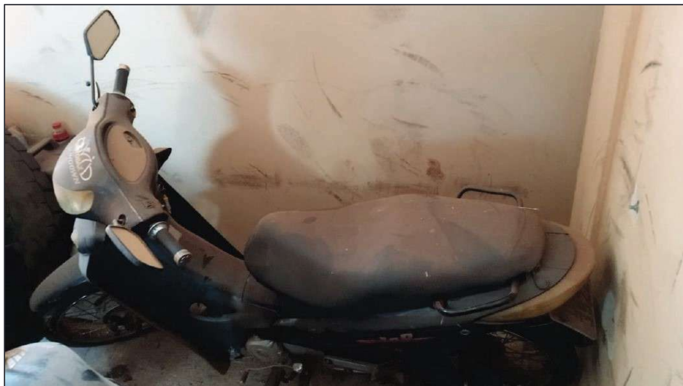
ITEM 047 - MOTO SUNDOWN WEB 100 PLACA: DLT-3922