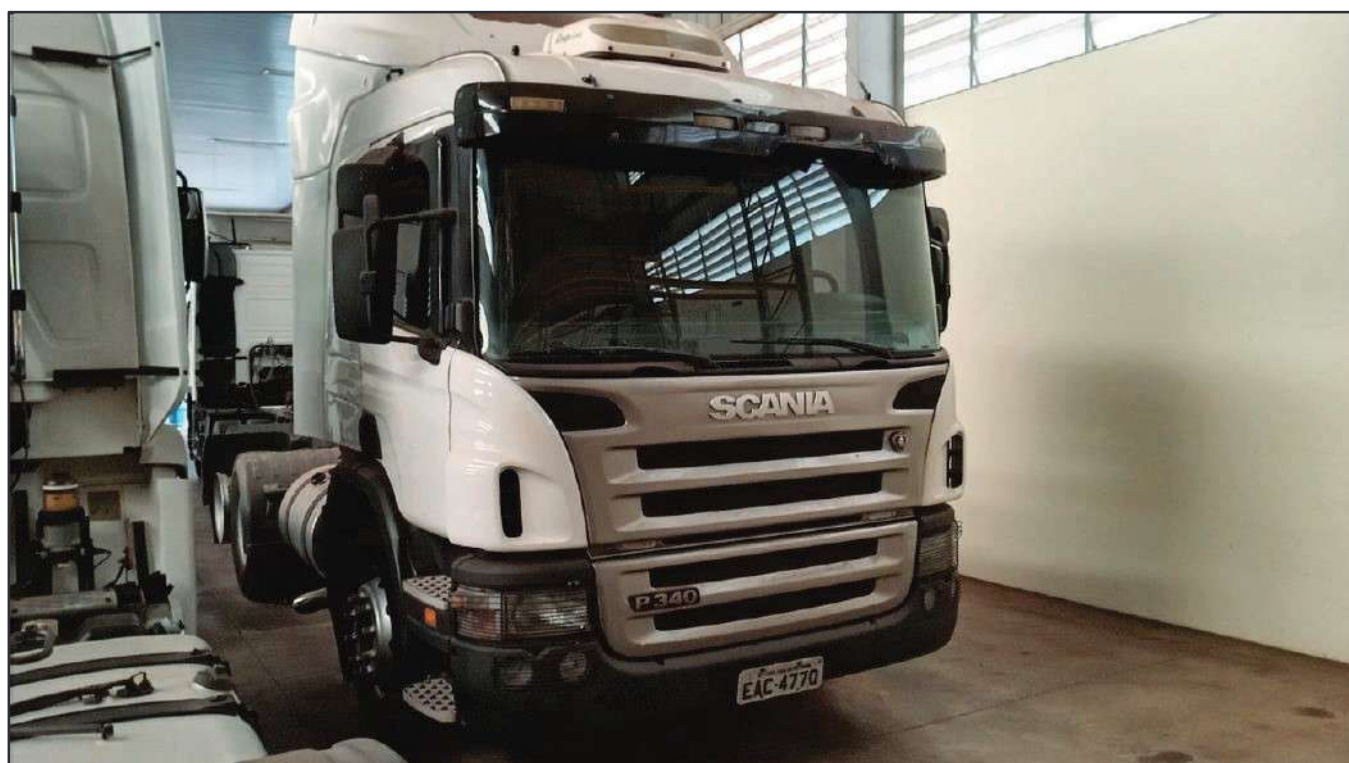
ITEM 021 - CAMINHÃO TRUCK SCANIA P340 A PLACA: EAC-4770