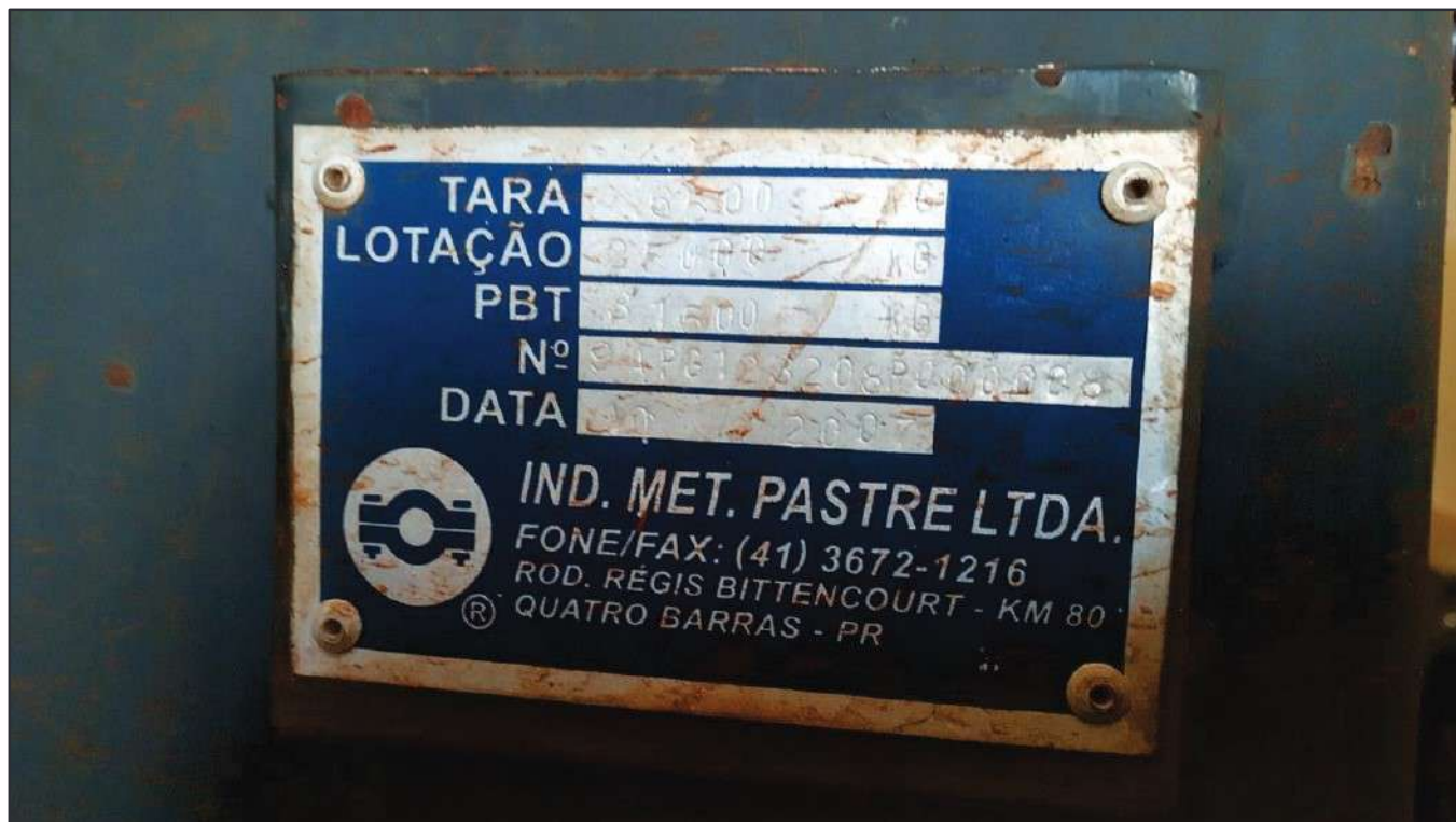
ITEM 014 - SEMI-REBOQUE GRANELEIRO PASTRE PLACA: DUT-7802