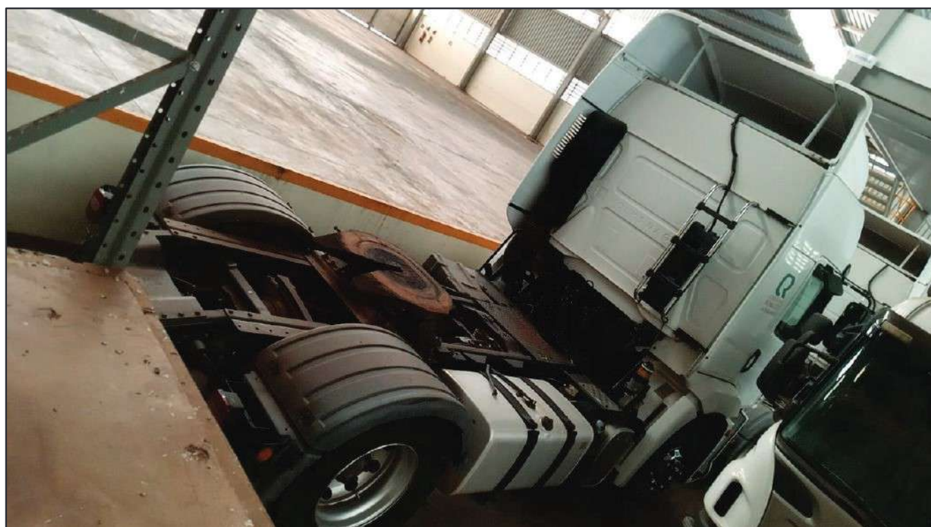
ITEM 030 - CAMINHÃO TOCO VOLKSWAGEM 19-330 CTC PLACA: FBY-6754