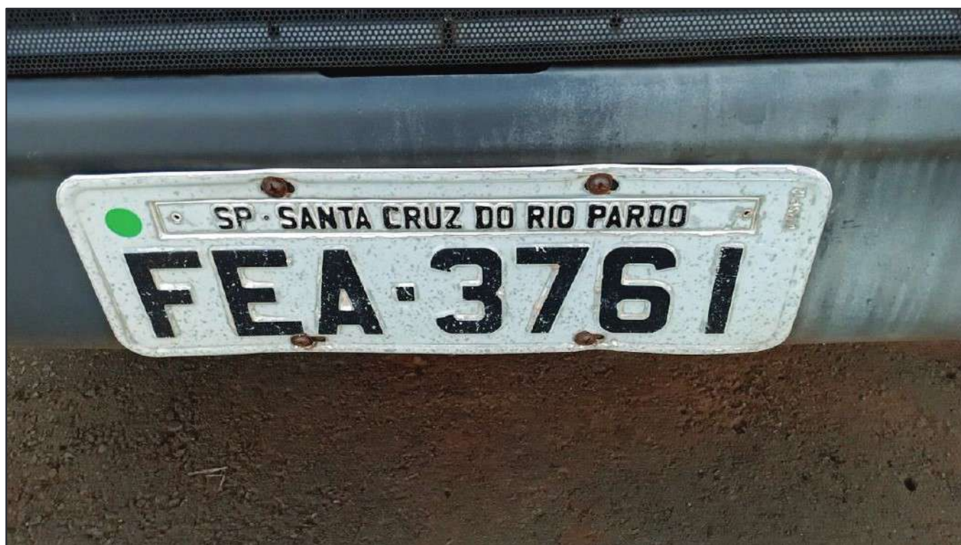
ITEM 032 - BI-TRUCK SCANIA P250 B8X2 PLACA: FEA-3761