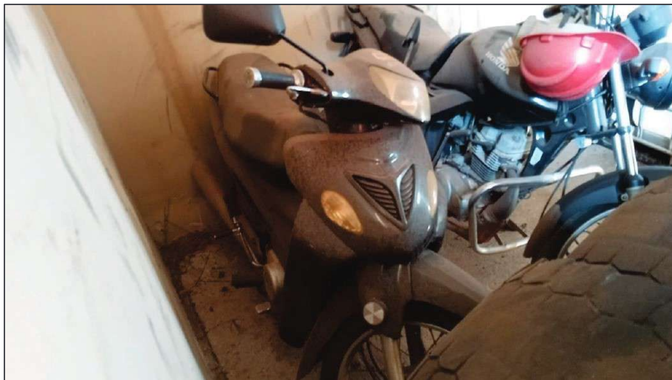
ITEM 047 - MOTO SUNDOWN WEB 100 PLACA: DLT-3922