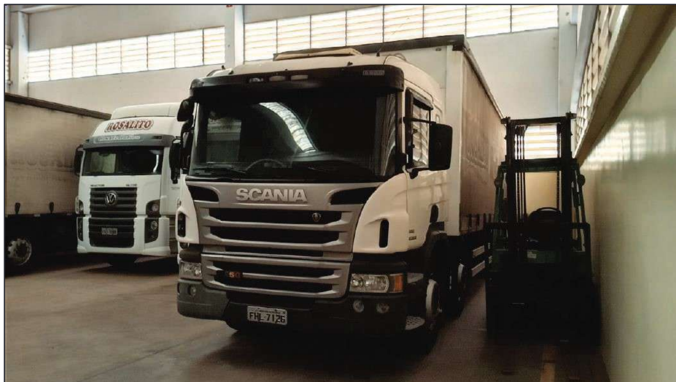
ITEM 035 - BI-TRUCK SCANIA P250 B8X2 PLACA: FHL-7126