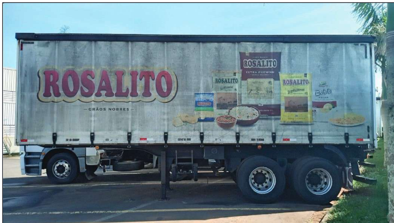
ITEM 010 - SEMI-REBOQUE FURGÃO FACCHINI PLACA: DUT-7416