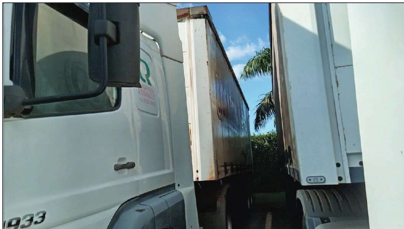
ITEM 019 - SEMI-REBOQUE FURGÃO FACCHINI PLACA: EAC-4531