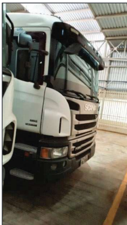
ITEM 037 - BI-TRUCK SCANIA P250 B8X2 PLACA: FHL-7458

Este documento é cópia do original, assinado digitalmente por RAFAEL VALERIO BRAGA MARTINS e Tribunal de Justiça do Estado de São Paulo, protocolado em 13/06/2023 às 21:27, sob o número WSCF033700202130. Para conferir o original, acesse o site https://esaj.tjsp.jus.br/pastadigital/pg/abrirConferenciaDocumento.do , informe o processo 1000701-23.2021.8.26.0539 e código D41877C.