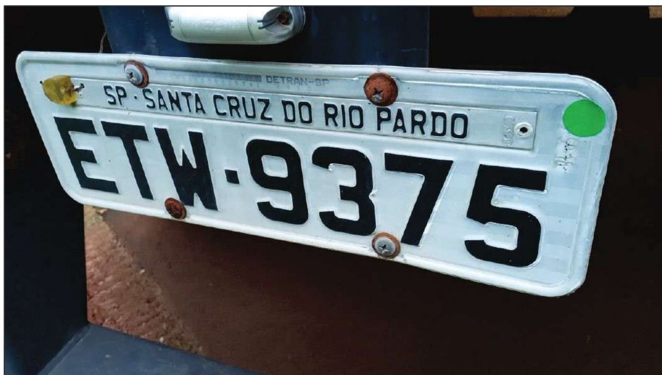
ITEM 028 - SEMI-REBOQUE FURGÃO FACCHINI PLACA: ETW-9375