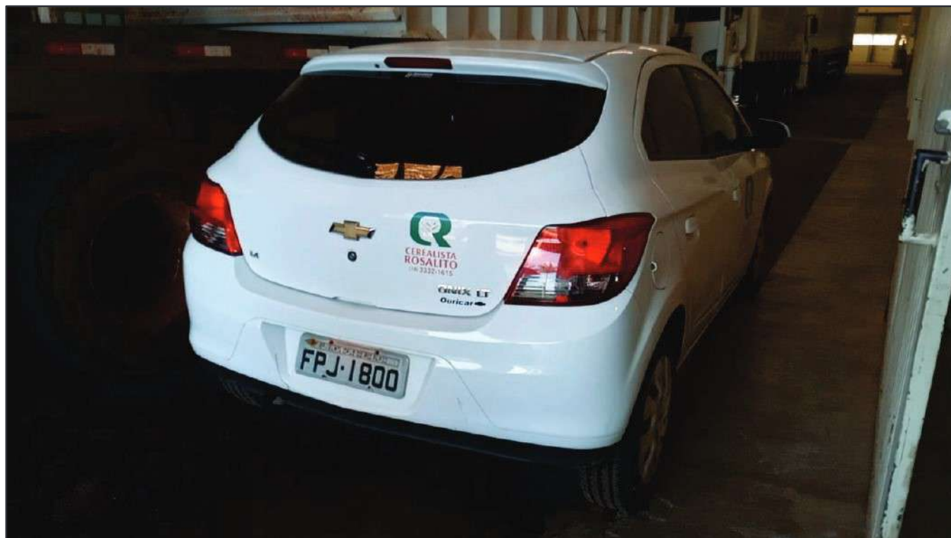
ITEM 039 - AUTOMÓVEL CHEVROLET (GM) ONIX PLACA: FPJ-1800