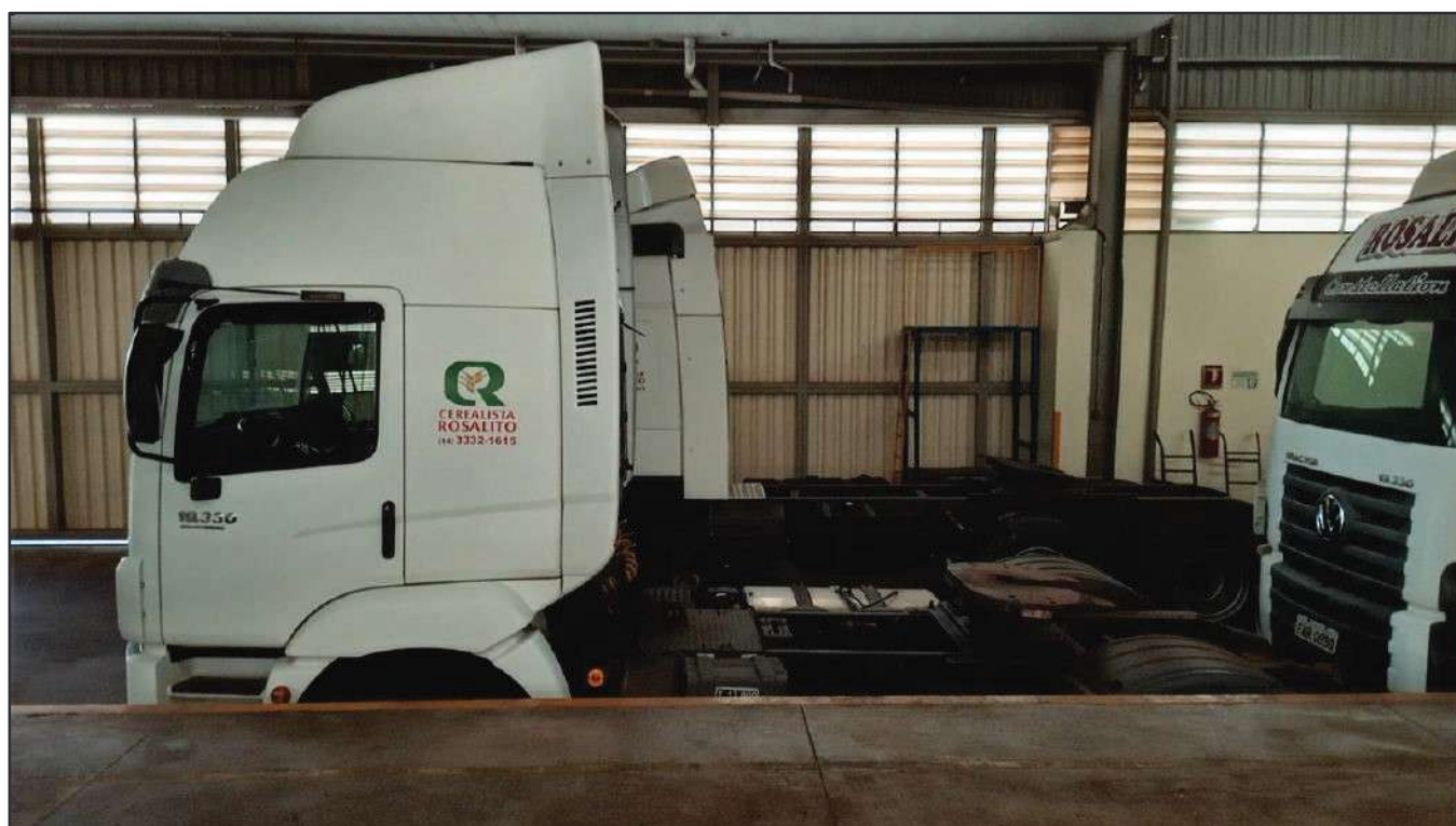
ITEM 040 - CAMINHÃO TOCO VOLKSWAGEM 19-330 CTC PLACA: FSP-2520

Este documento é cópia do original, assinado digitalmente por RAFAEL VALERIO BRAGA MARTINS e Tribunal de Justiça do Estado de São Paulo, protocolado em 13/06/2023 às 21:27, sob o número WSCF 33700202130. Para conferir o original, acesse o site https://esaj.tjsp.jus.br/pastadigital/pg/abrirConferenciaDocumento.do , informe o processo 1000101-23.2021.8.26.0539 e código D41877C.