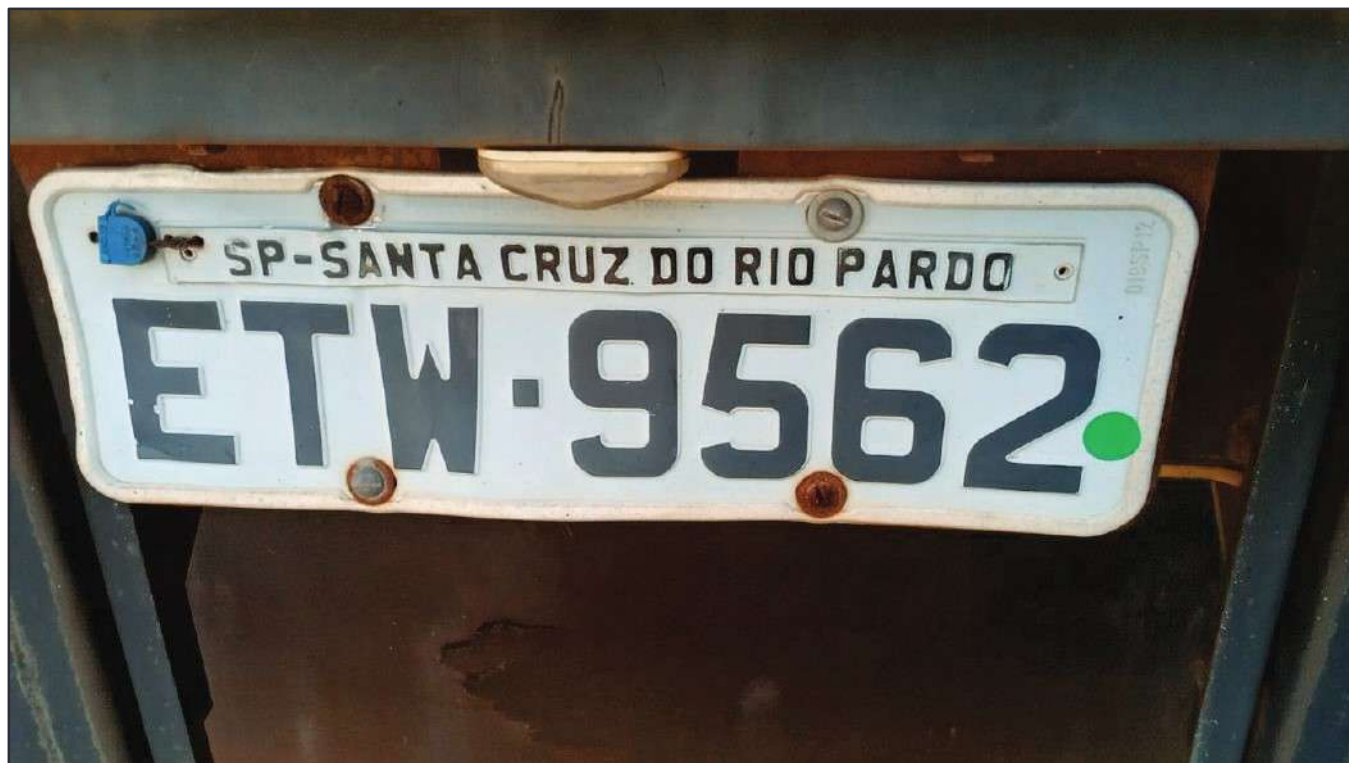
ITEM 029 - BI-TRUCK VOLKSWAGEM 24-250 CLC PLACA: ETW-9562