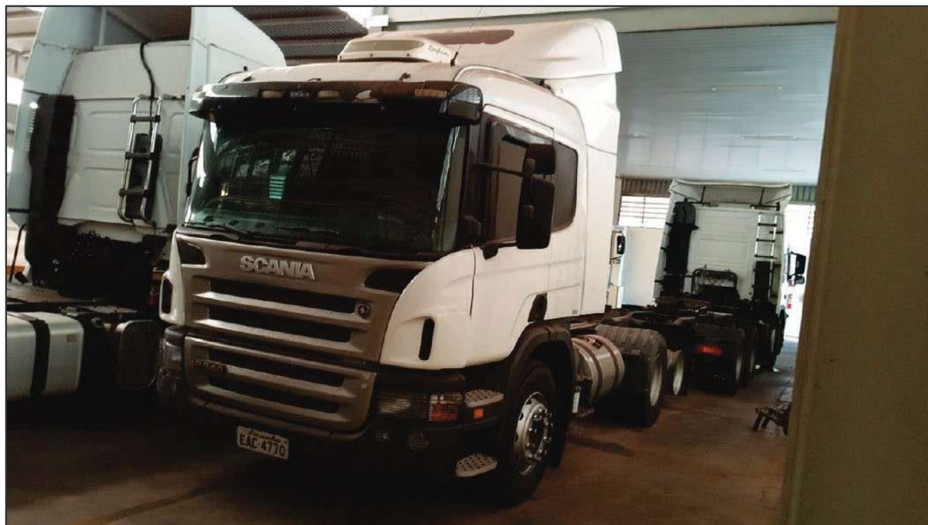
ITEM 021 - CAMINHÃO TRUCK SCANIA P340 A PLACA: EAC-4770