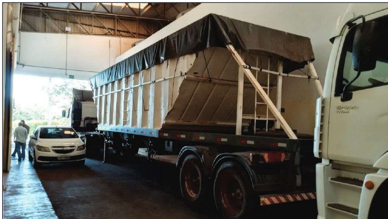
ITEM 014 - SEMI-REBOQUE GRANELEIRO PASTRE PLACA: DUT-7802