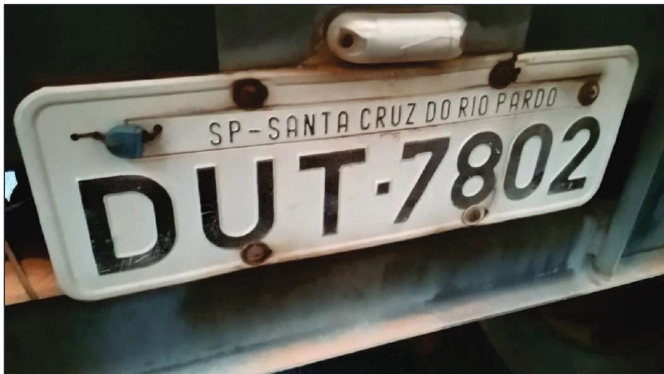
ITEM 014 - SEMI-REBOQUE GRANELEIRO PASTRE PLACA: DUT-7802