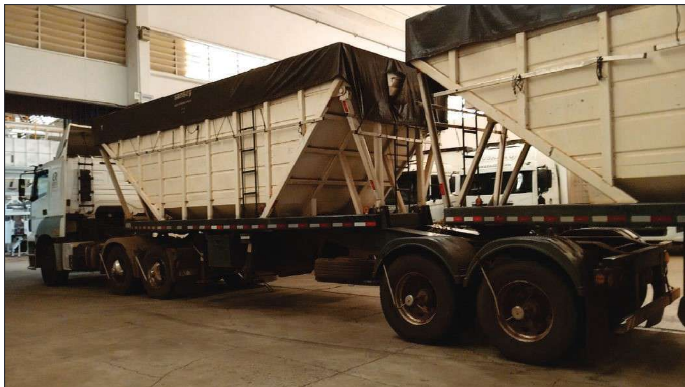
ITEM 004 - BI-TREM RANDON PLACA: DGQ-0481