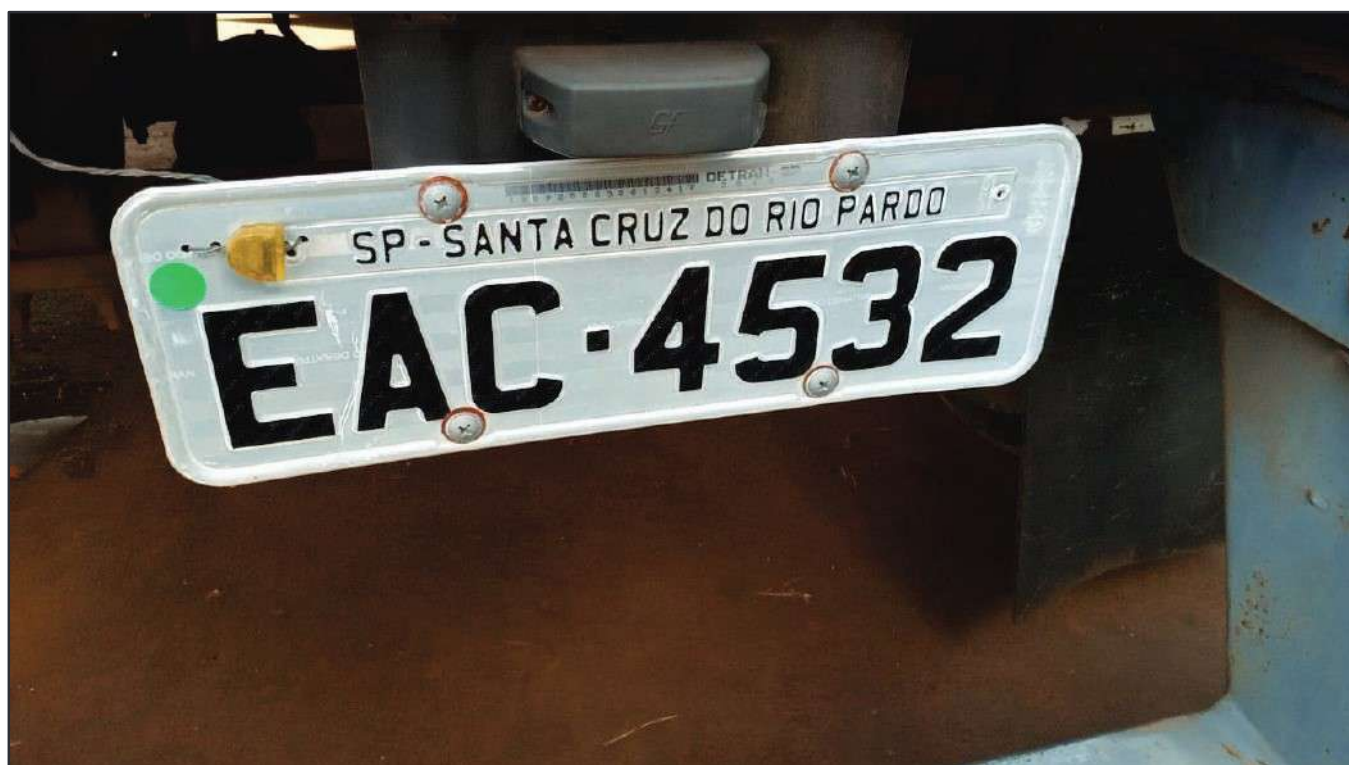
ITEM 020 - SEMI-REBOQUE FURGÃO FACCHINI PLACA: EAC-4532