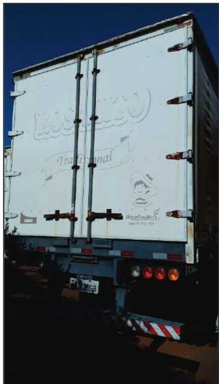
ITEM 003 - SEMI-REBOQUE FURGÃO FACCHINI PLACA: DGQ-0369