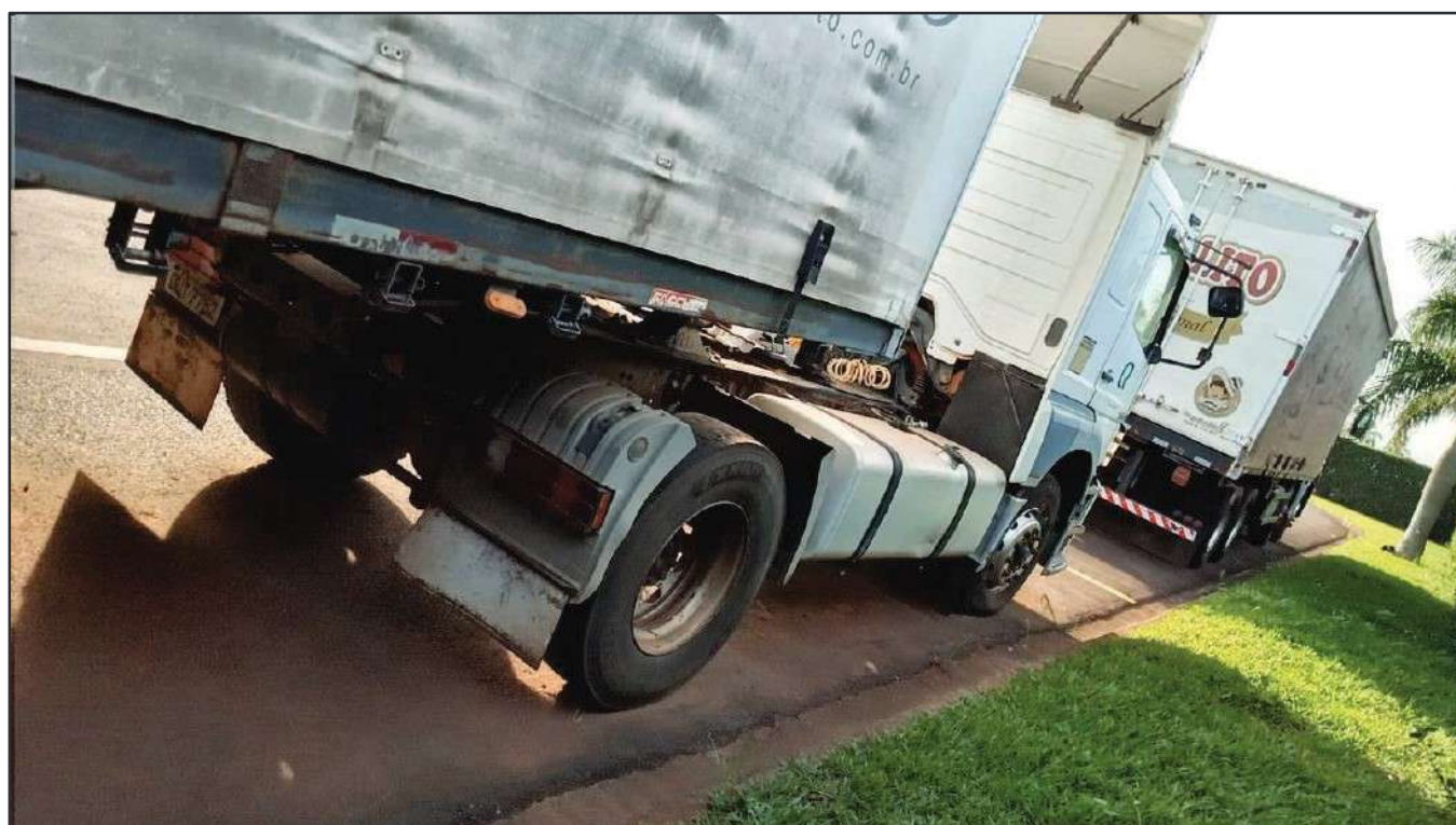
ITEM 013 - CAMINHÃO TOCO MERCEDES-BENZ AXOR 1933 S PLACA: DUT-7752