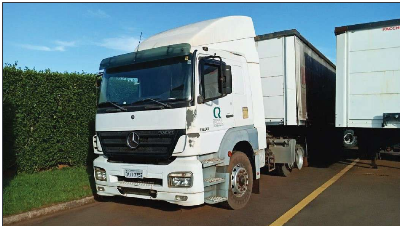
ITEM 013 - CAMINHÃO TOCO MERCEDES-BENZ AXOR 1933 S PLACA: DUT-7752