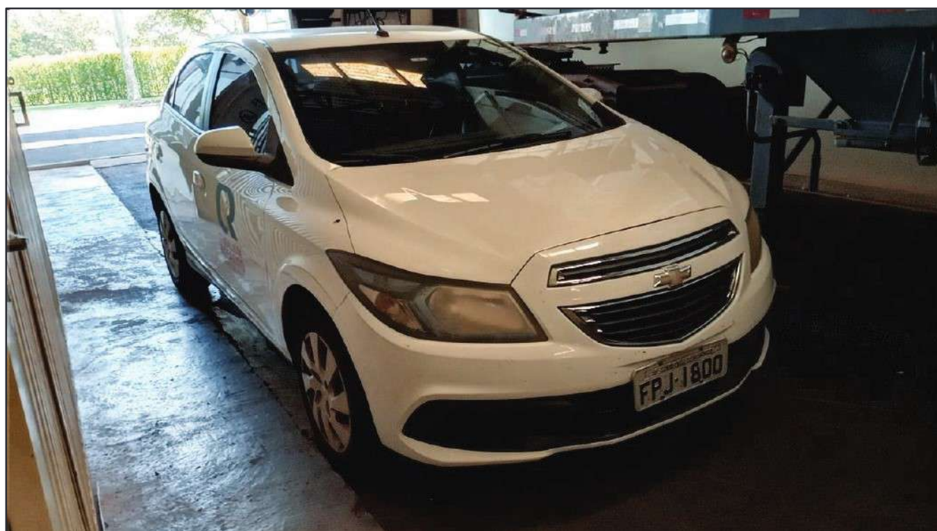
ITEM 039 - AUTOMÓVEL CHEVROLET (GM) ONIX PLACA: FPJ-1800