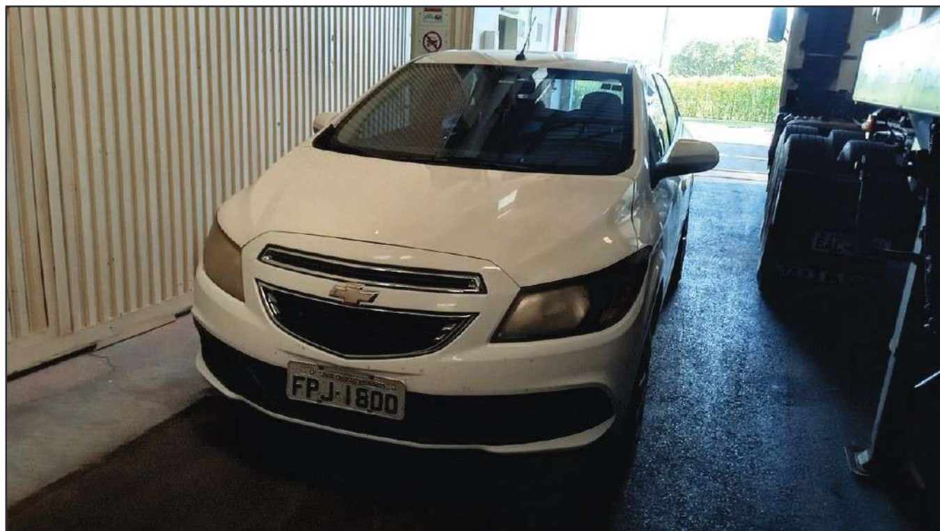
ITEM 039 - AUTOMÓVEL CHEVROLET (GM) ONIX PLACA: FPJ-1800

Este documento é cópia do original, assinado digitalmente por RAFAEL VALERIO BRAGA MARTINS e Tribunal de Justiça do Estado de São Paulo, protocolado em 13/06/2023 às 21:27, sob o número WSCF23700202130. Para conferir o original, acesse o site https://esaj.tjsp.jus.br/pastadigital/pg/abrirConferenciaDocumento.do , informe o processo 1000701-23.2021.8.26.0539 e código D41877C.