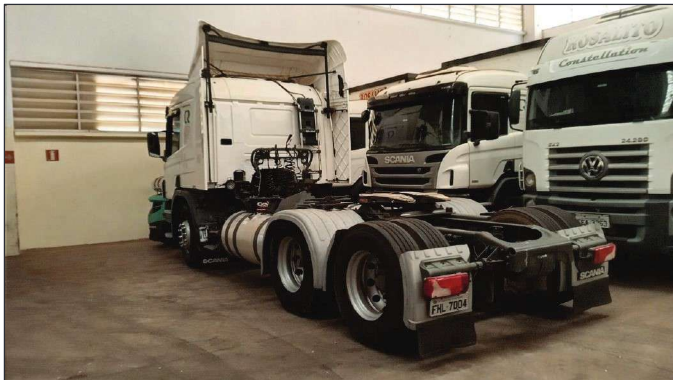
ITEM 048 - CAMINHÃO TRUCK SCANIA P 360 A6X2 PLACA: FHL-7004