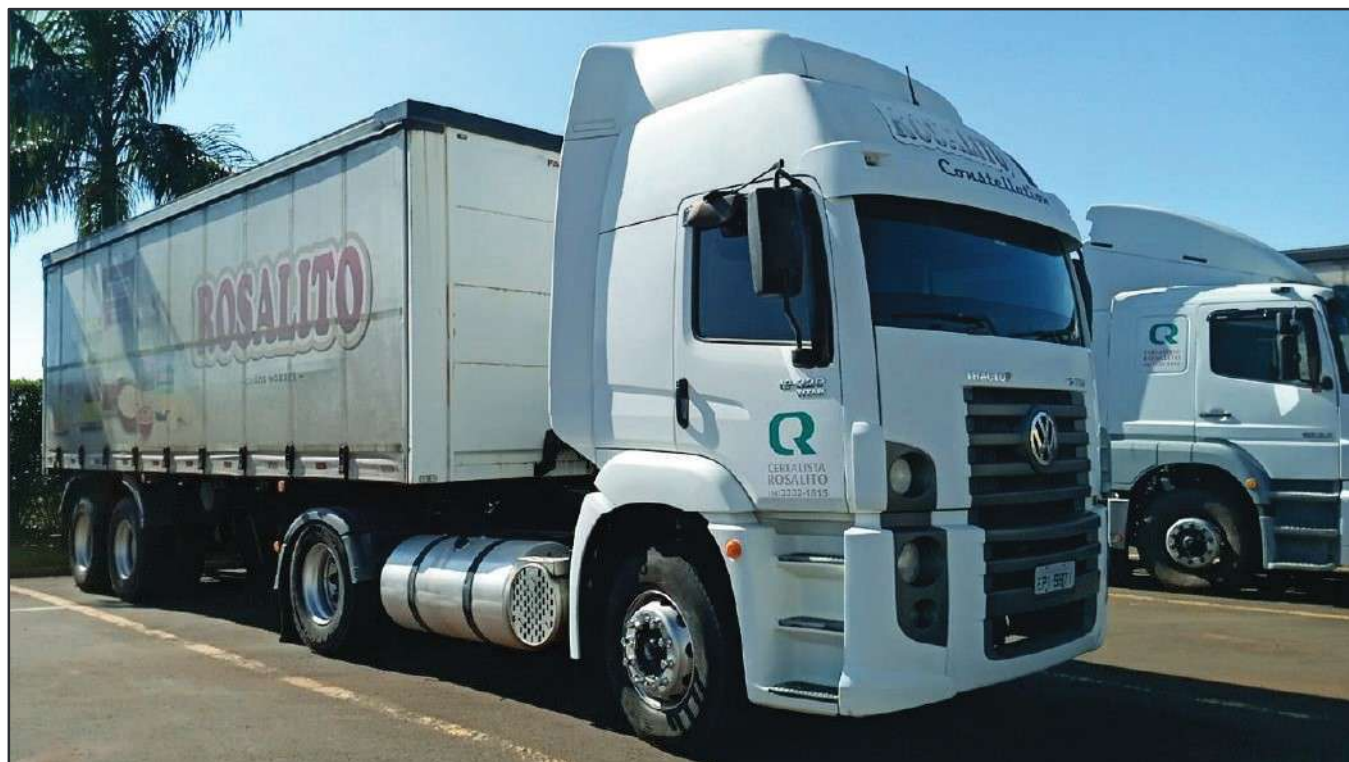
ITEM 026 - CAMINHÃO TOCO VOLKSWAGEM 19-320 CONSTELLATION CLC TT PLACA: EPI-9871