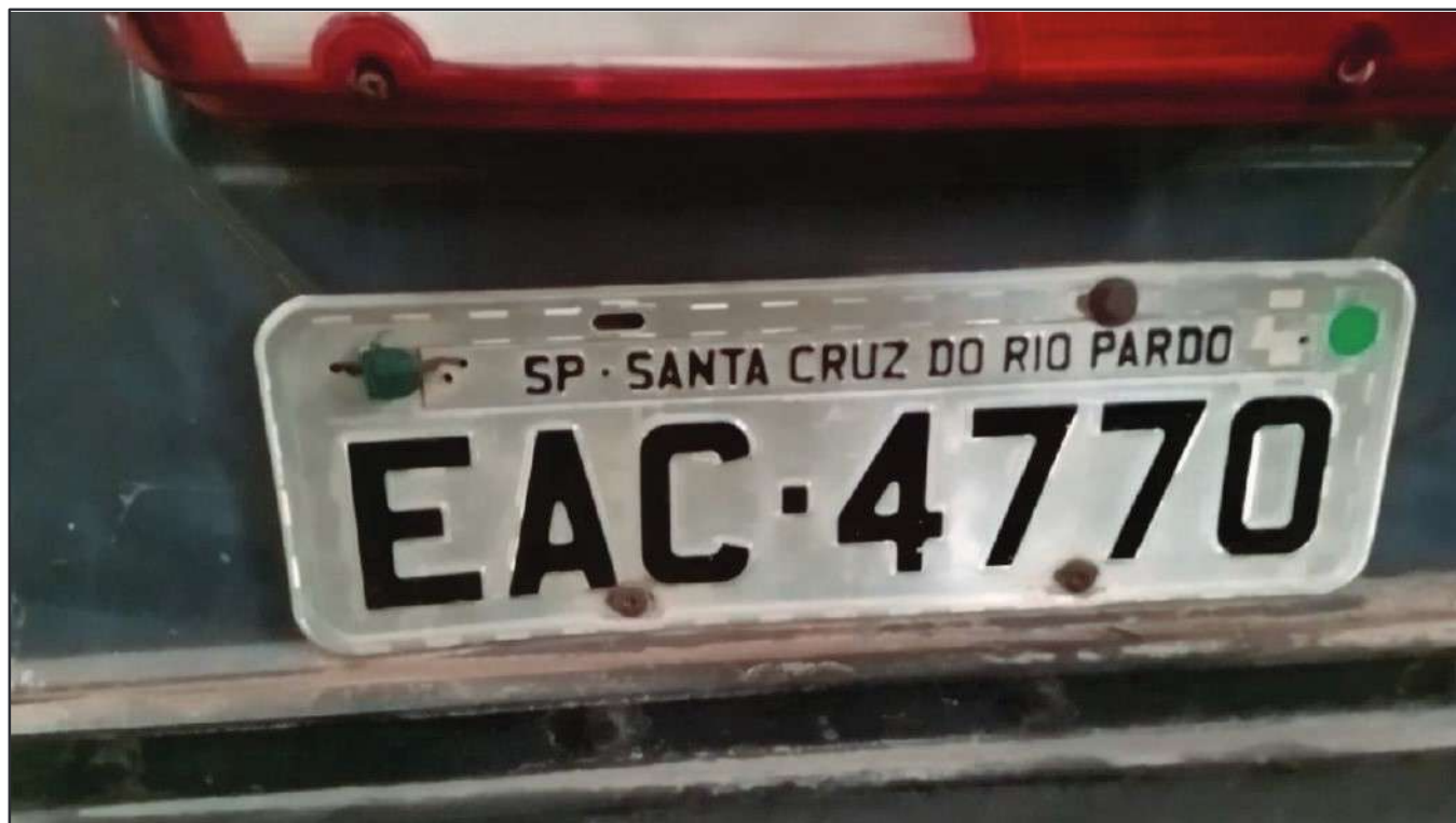
ITEM 021 - CAMINHÃO TRUCK SCANIA P340 A PLACA: EAC-4770