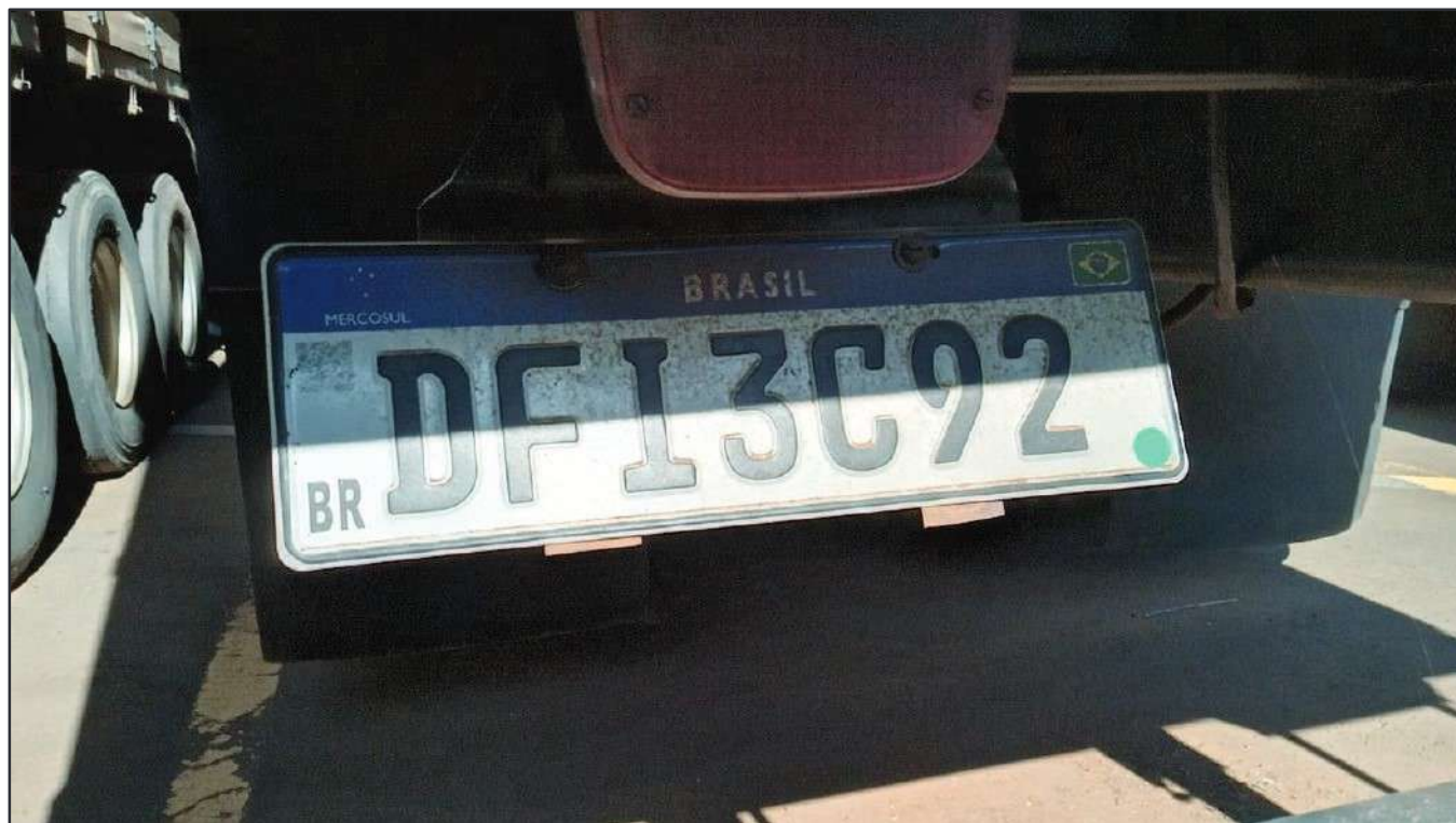
ITEM 046 - CAMINHÃO TRUCK VOLKSWAGEM 23.210 MOTOR CUMMINS PLACA: DFI-3C92