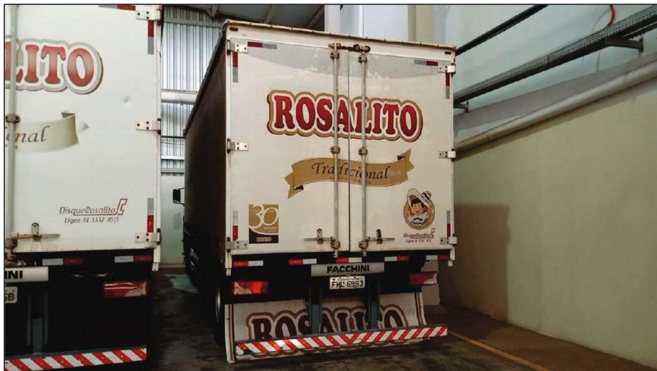
ITEM 034 - BI-TRUCK SCANIA P250 B8X2 PLACA: FHL-6983