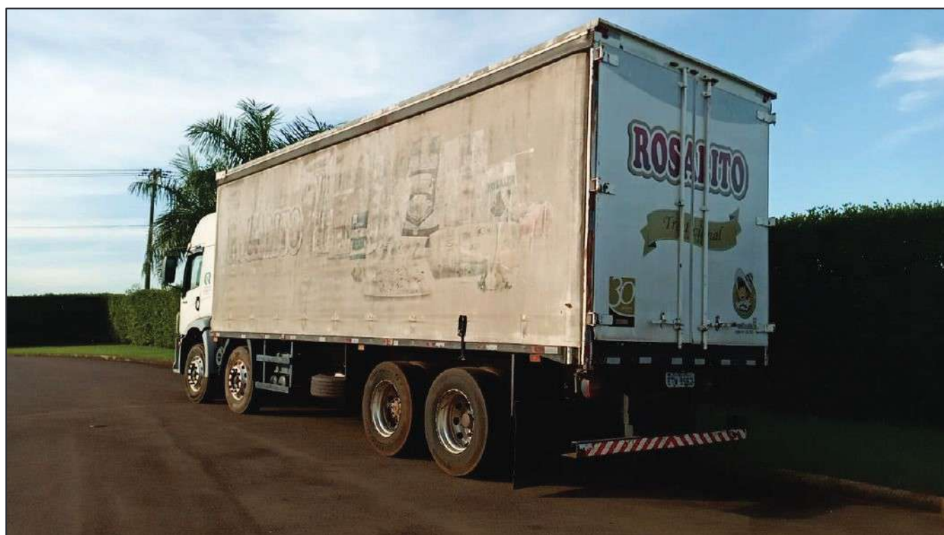
ITEM 029 - BI-TRUCK VOLKSWAGEM 24-250 CLC PLACA: ETW-9562