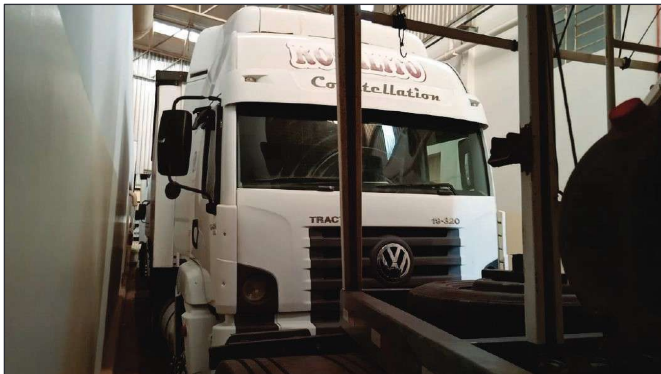
ITEM 018 - CAMINHÃO TOCO VOLKSWAGEM 19-320 CONSTELLATION CLC TT PLACA: EAC-4386