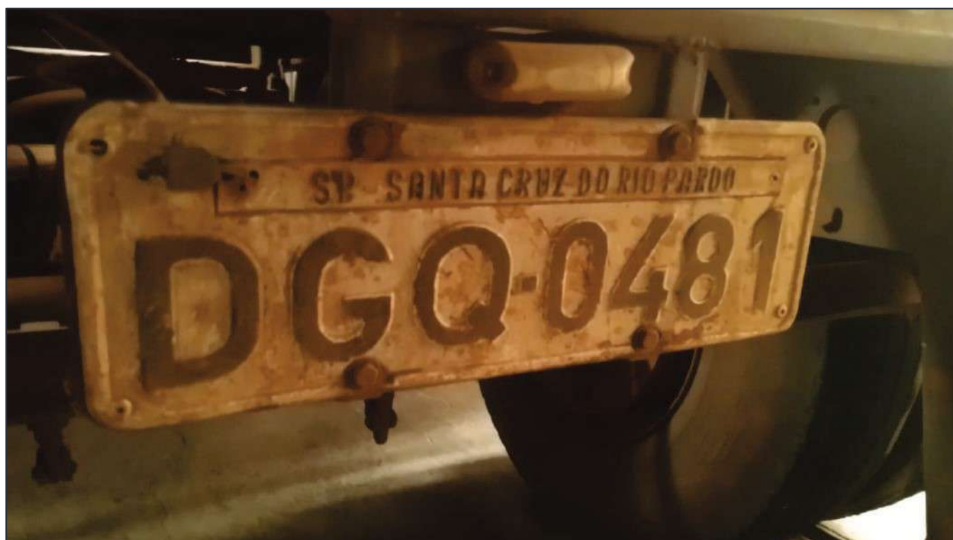
ITEM 004 - BI-TREM RANDON PLACA: DGQ-0481