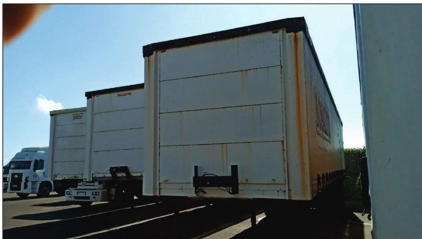
ITEM 003 - SEMI-REBOQUE FURGÃO FACCHINI PLACA: DGQ-0369