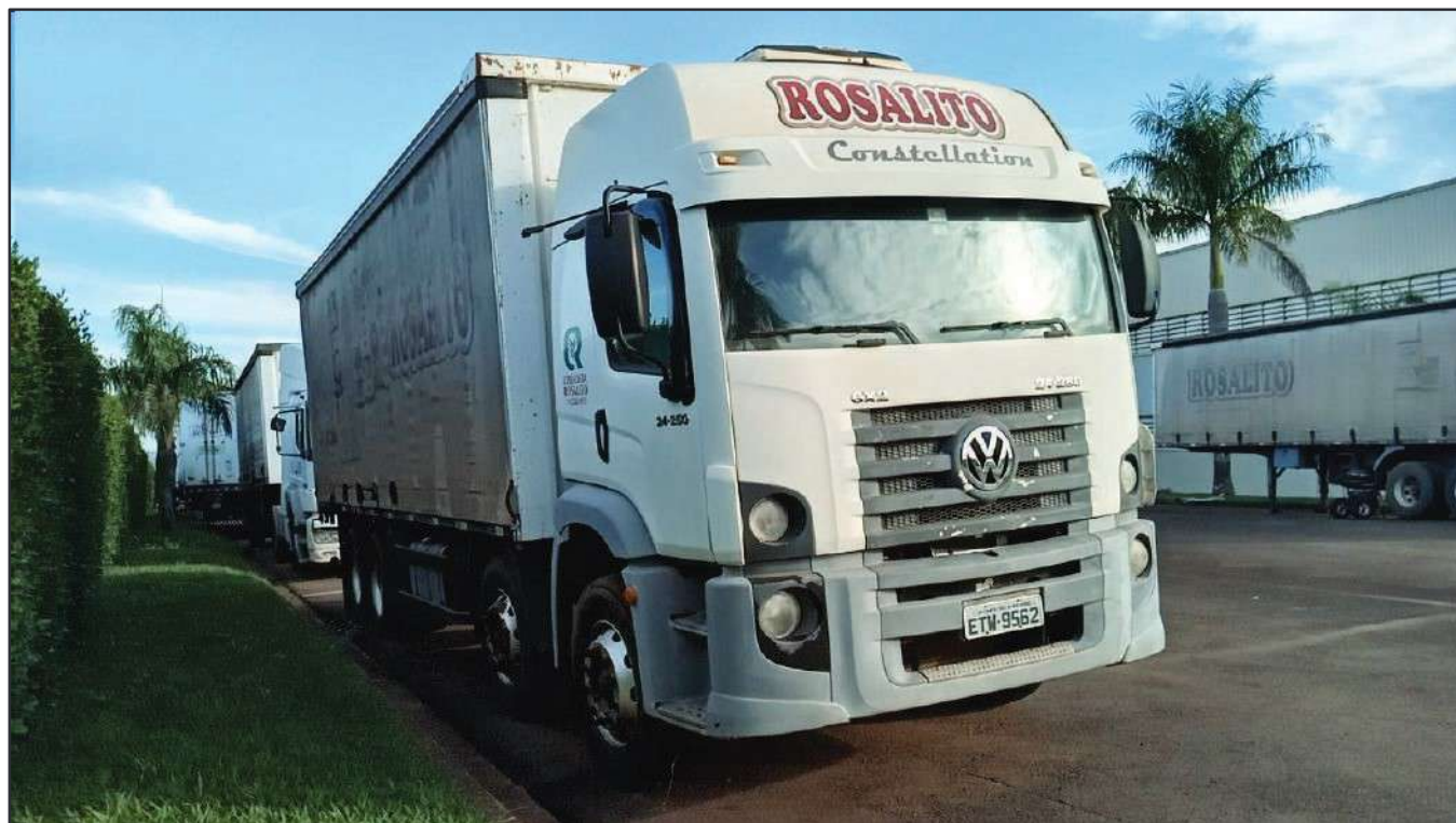
ITEM 029 - BI-TRUCK VOLKSWAGEM 24-250 CLC PLACA: ETW-9562