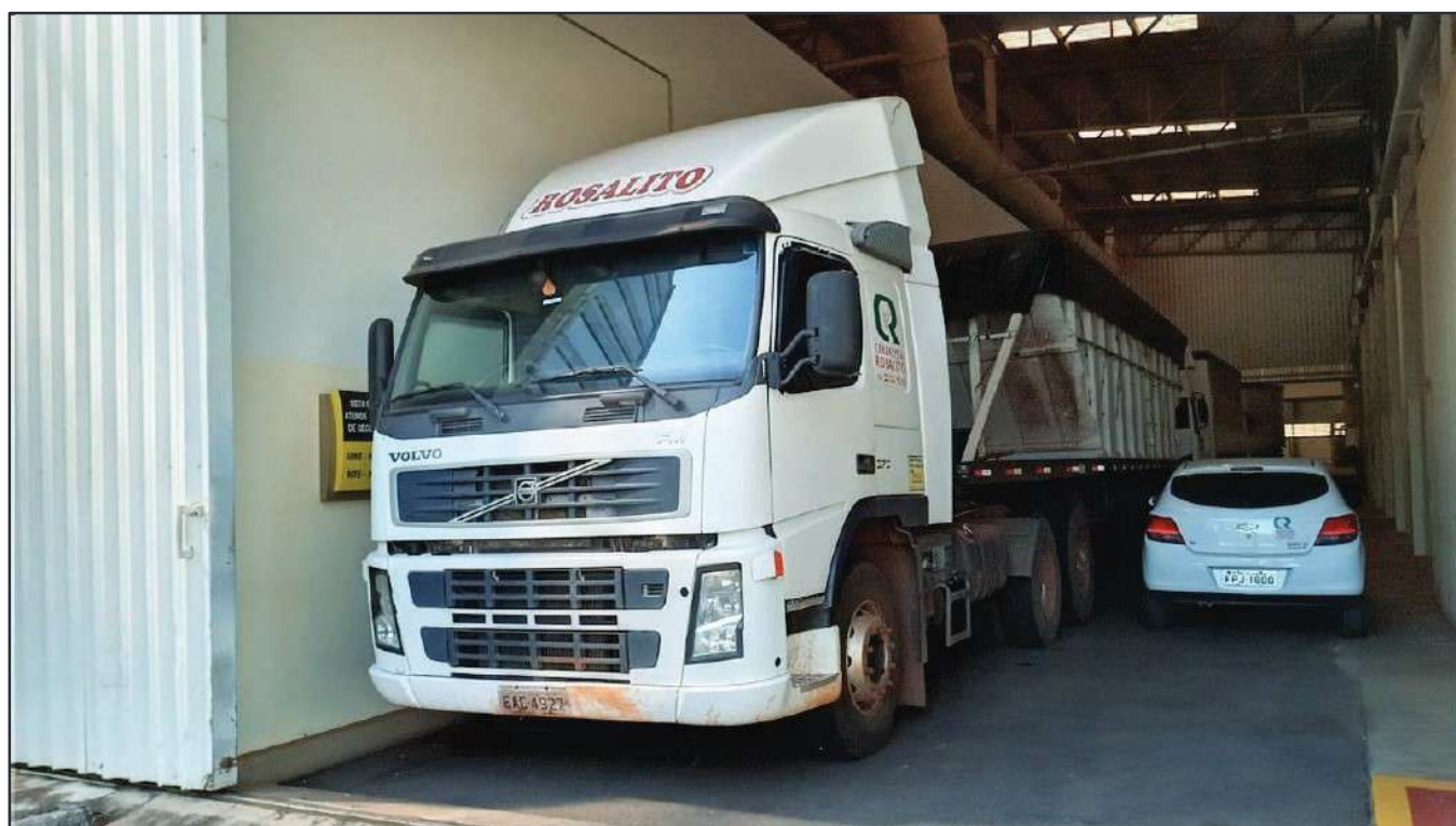
ITEM 022 - CAMINHÃO TRUCK VOLVO FM370 T PLACA: EAC-4927