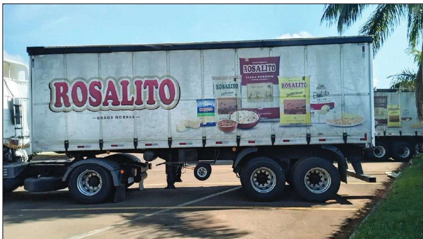
ITEM 012 - SEMI-REBOQUE FURGÃO FACCHINI PLACA: DUT-7663

Este documento é cópia do original, assinado digitalmente por RAFAEL VALERIO BRAGA MARTINS e Tribunal de Justiça do Estado de São Paulo, protocolado em 13/06/2023 às 21:27, sob o número WSCF033700202130. Para conferir o original, acesse o site https://esaj.tjsp.jus.br/pastadigital/pg/abrirConferenciaDocumento.do , informe o processo 1000101-23.2021.8.26.0539 e código D418766.