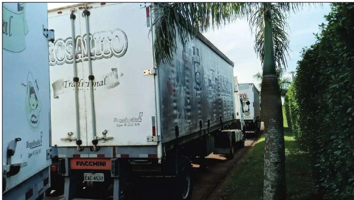
ITEM 020 - SEMI-REBOQUE FURGÃO FACCHINI PLACA: EAC-4532