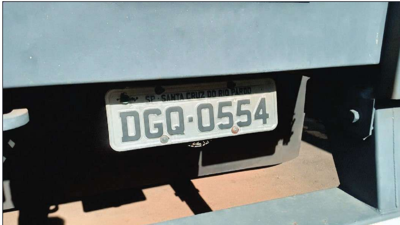
ITEM 006 - SEMI-REBOQUE FURGÃO FACCHINI PLACA: DGQ-0554

Este documento é cópia do original, assinado digitalmente por RAFAEL VALERIO BRAGA MARTINS e Tribunal de Justiça do Estado de São Paulo, protocolado em 13/06/2023 às 21:27, sob o número WSCF033700202130. Para conferir o original, acesse o site https://esaj.tjsp.jus.br/pastadigital/pg/abrirConferenciaDocumento.do , informe o processo 1000101-23.2021.8.26.0539 e código D418766.