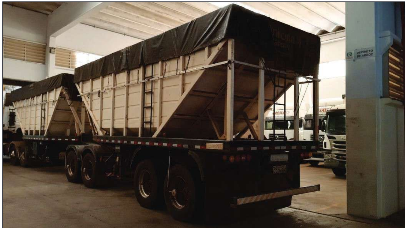
ITEM 005 - BI-TREM RANDON PLACA: DGQ-0482