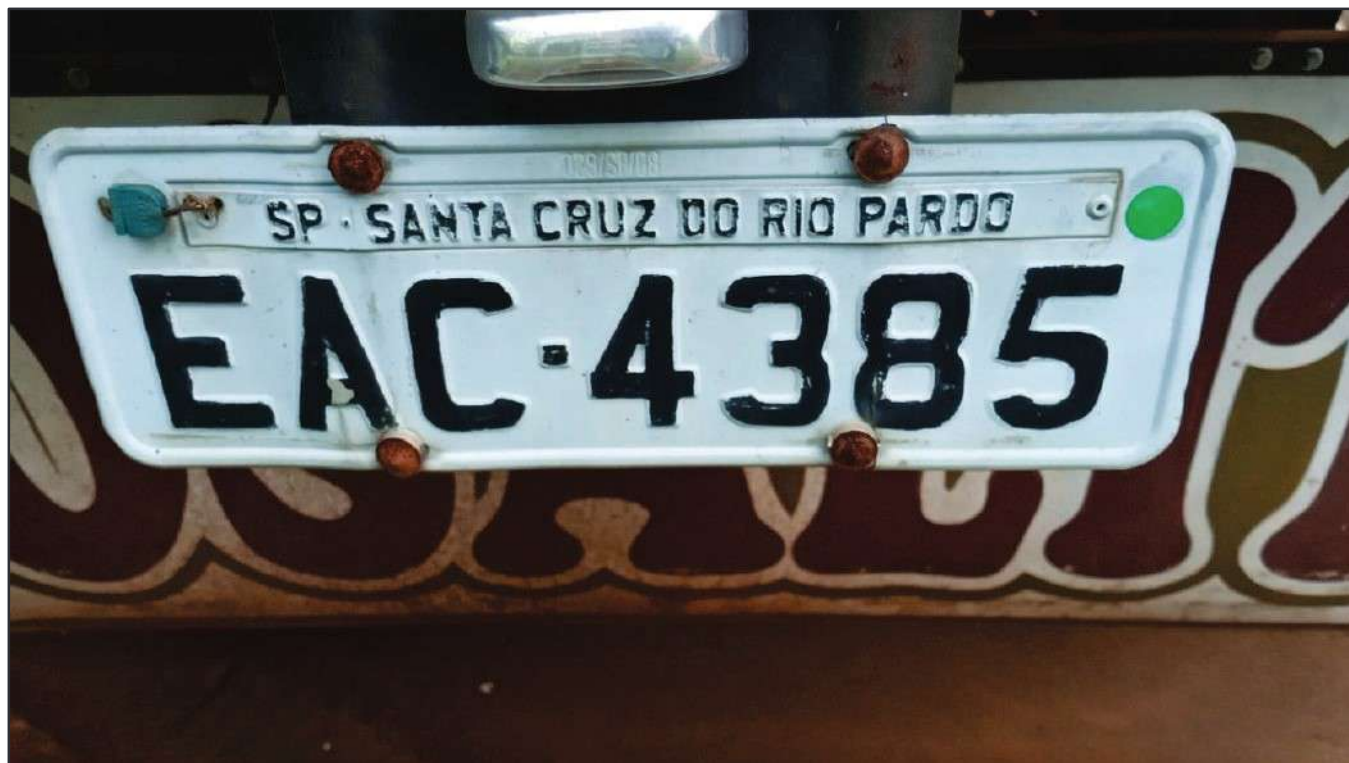
ITEM 017 - SEMI-REBOQUE FURGÃO FACCHINI PLACA: EAC-4385