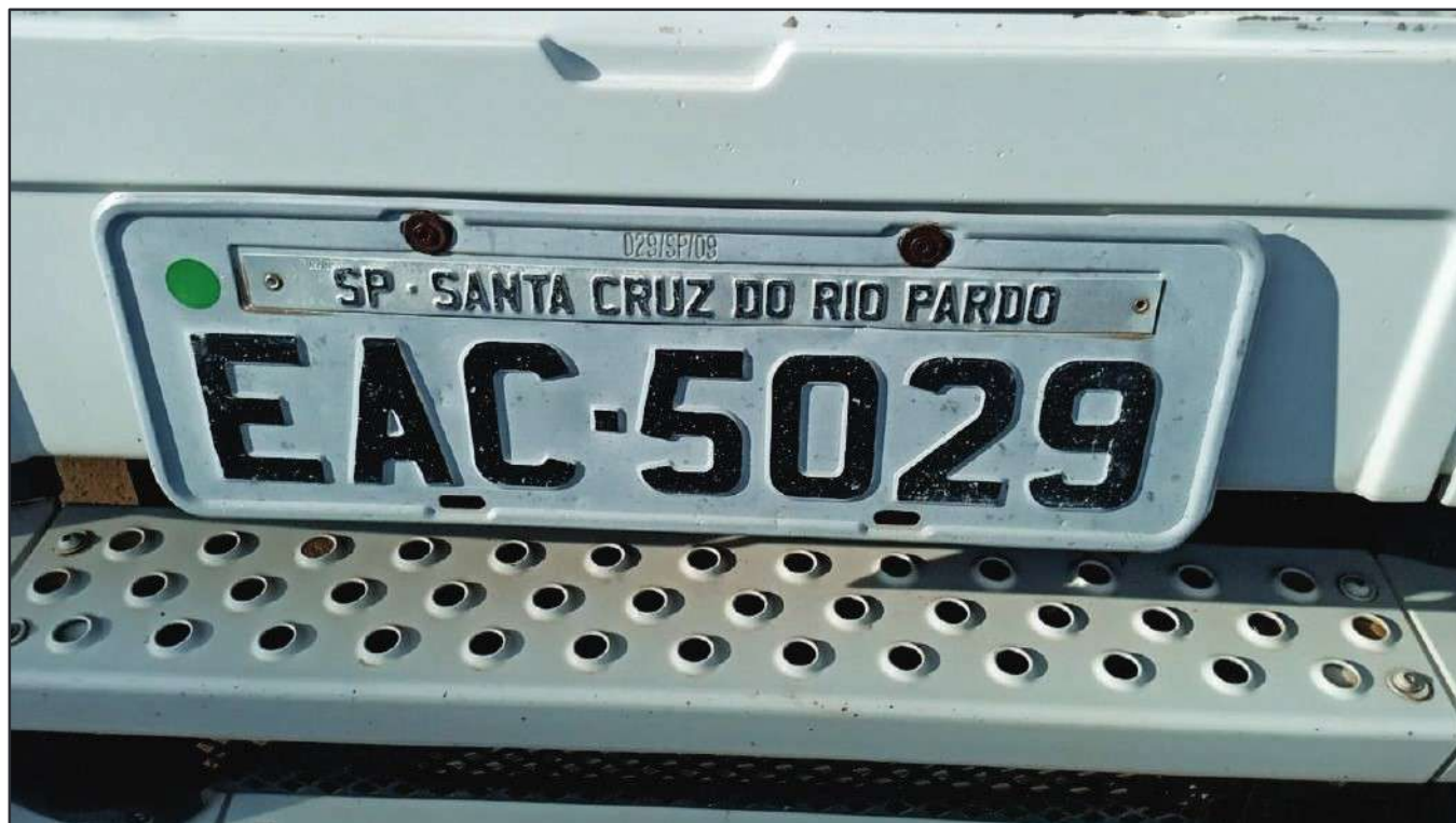
ITEM 025 - CAMINHÃO TOCO MERCEDES-BENZ AXOR 1933 S PLACA: EAC-5029