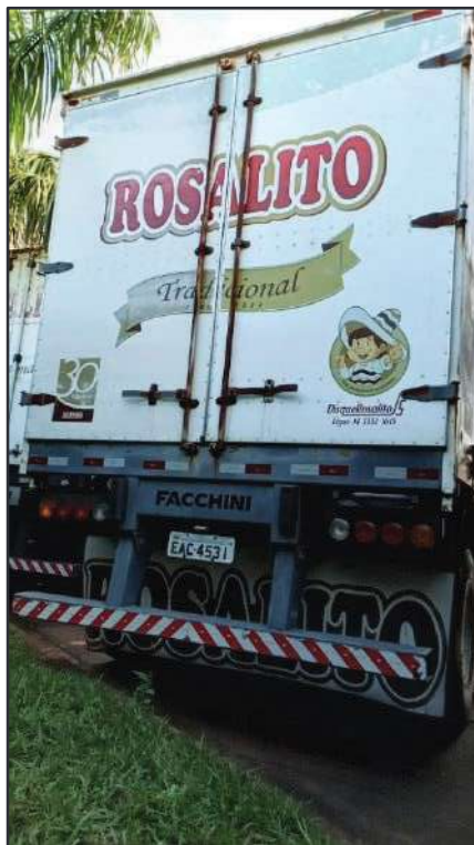
ITEM 019 - SEMI-REBOQUE FURGÃO FACCHINI PLACA: EAC-4531