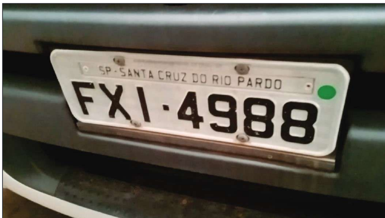
ITEM 041 - CAMINHÃO TRUCK VOLKSWAGEM 25-420 CTC PLACA: FXI-4988