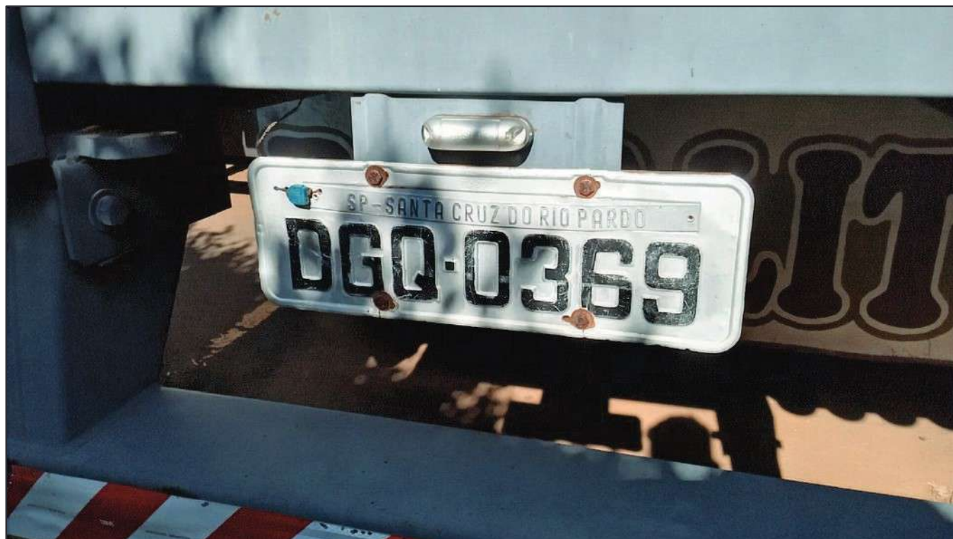
ITEM 003 - SEMI-REBOQUE FURGÃO FACCHINI PLACA: DGQ-0369