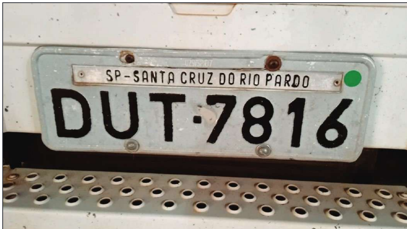
ITEM 015 - CAMINHÃO TRUCK MERCEDES-BENZ 1720 PLACA: DUT-7816