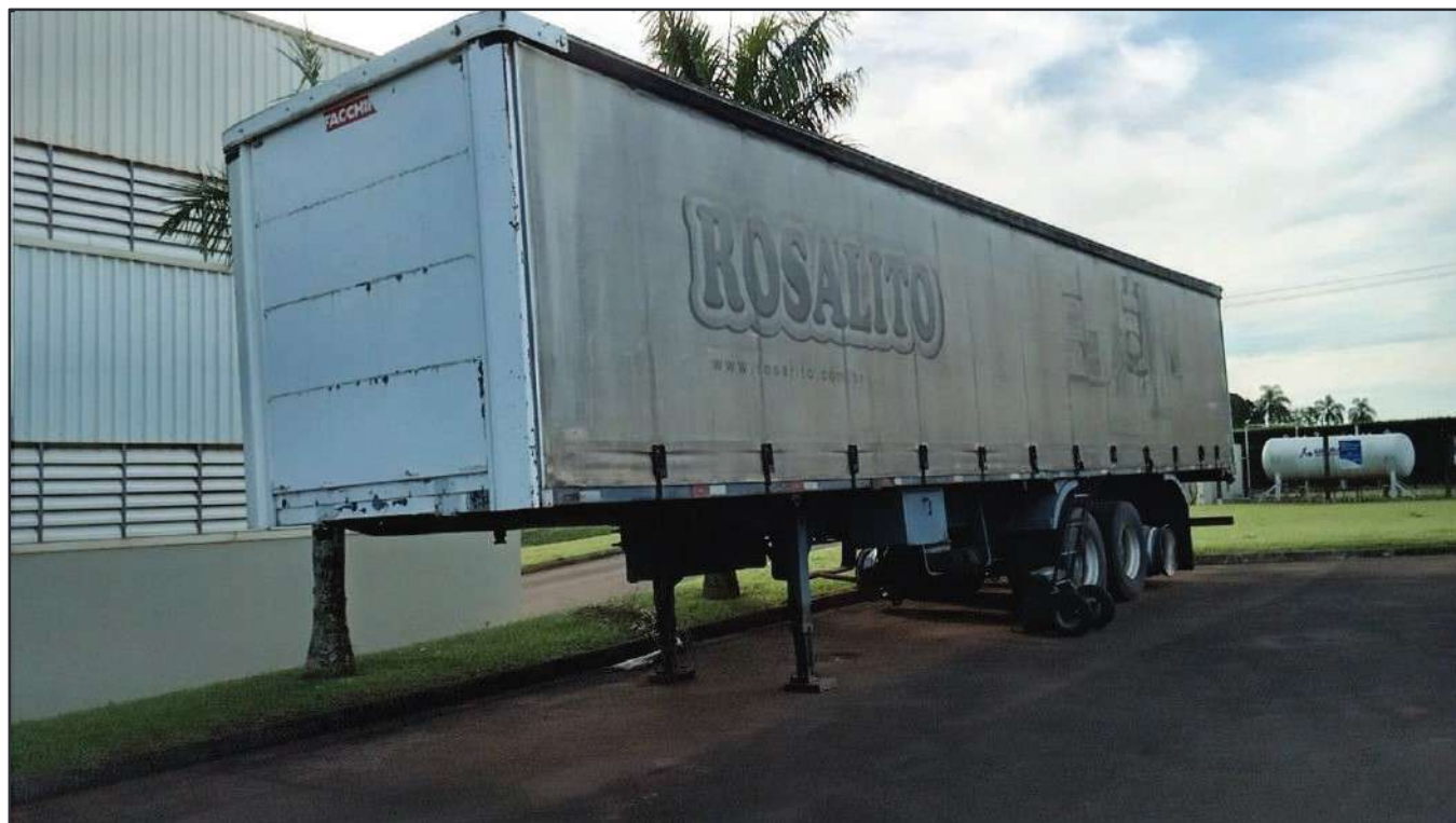
ITEM 001 - SEMI-REBOQUE FURGÃO NOMA PLACA: BJP-0993