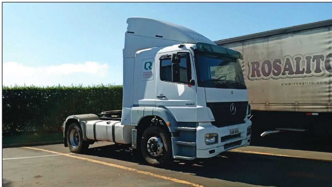
ITEM 008 - CAMINHÃO TOCO MERCEDES-BENZ AXOR 1933 S PLACA: DQR-8645