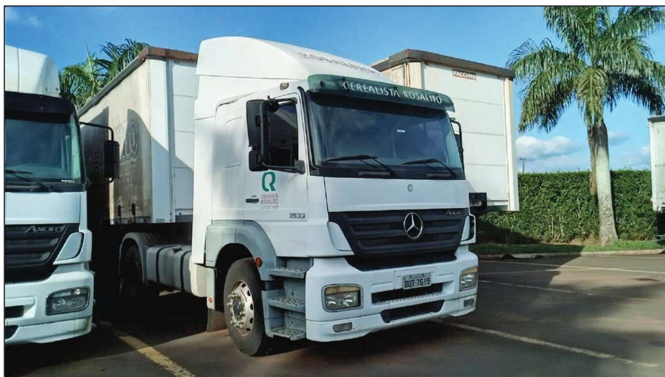
ITEM 011 - CAMINHÃO TOCO MERCEDES-BENZ AXOR 1933 S PLACA: DUT-7619