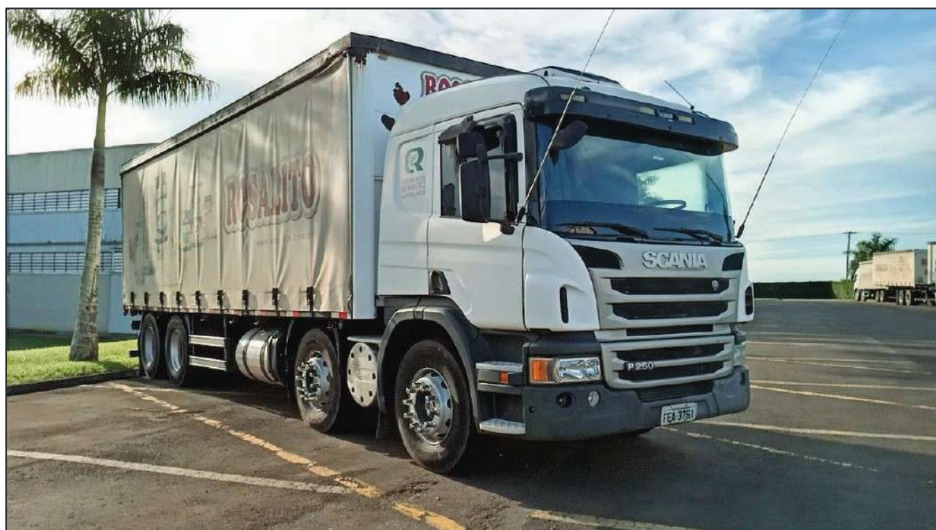
ITEM 032 - BI-TRUCK SCANIA P250 B8X2 PLACA: FEA-3761

Este documento é cópia do original, assinado digitalmente por RAFAEL VALERIO BRAGA MARTINS e Tribunal de Justiça do Estado de São Paulo, protocolado em 13/06/2023 às 21:27, sob o número WSCF033700202130. Para conferir o original, acesse o site https://esaj.tjsp.jus.br/pastadigital/pg/abrirConferenciaDocumento.do , informe o processo 1000701-23.2021.8.26.0539 e código D41877C.