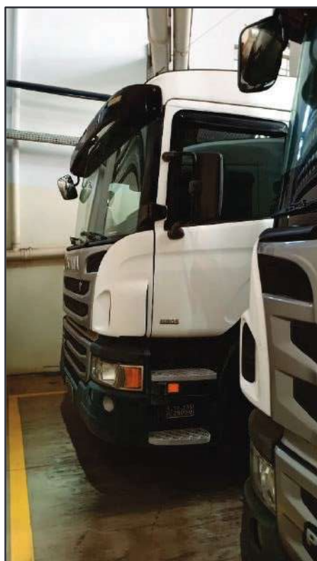
ITEM 034 - BI-TRUCK SCANIA P250 B8X2 PLACA: FHL-6983