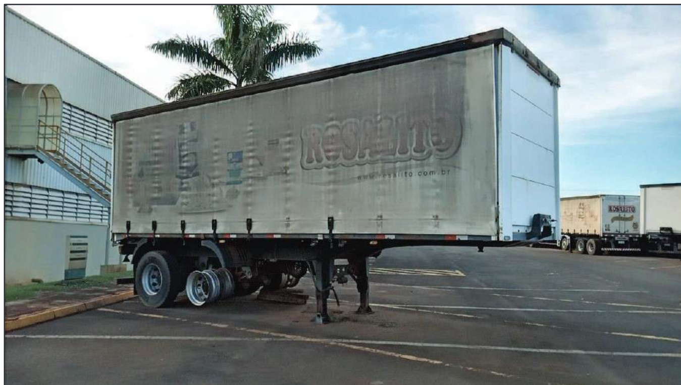
ITEM 023 - SEMI-REBOQUE FURGÃO FACCHINI PLACA: EAC-5021