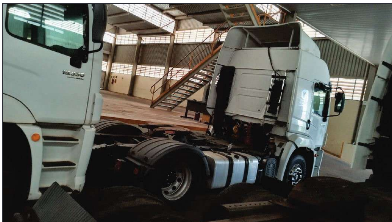
ITEM 040 - CAMINHÃO TOCO VOLKSWAGEM 19-330 CTC PLACA: FSP-2520