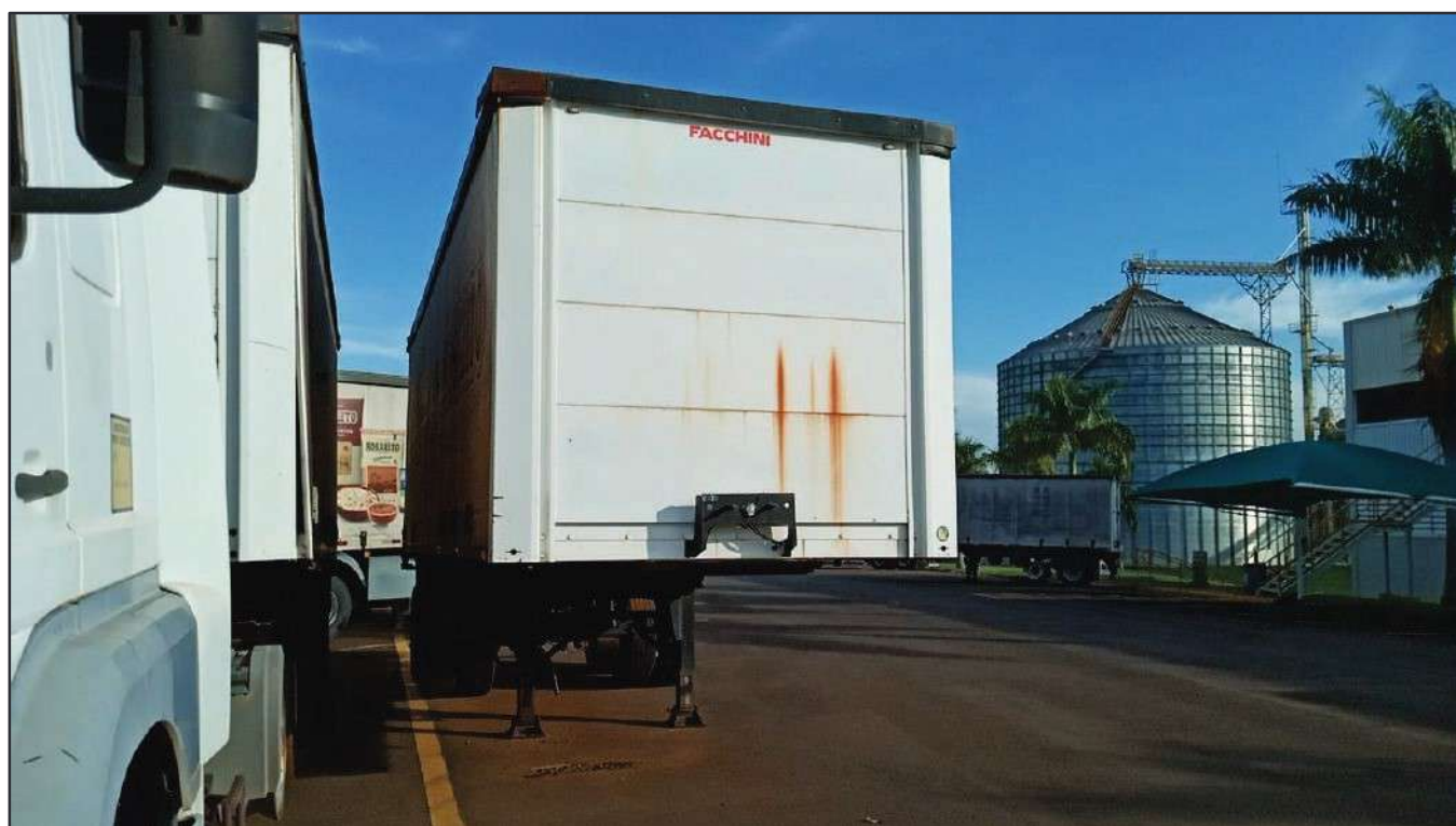
ITEM 016 - SEMI-REBOQUE FURGÃO FACCHINI PLACA: EAC-4384

Este documento é cópia do original, assinado digitalmente por RAFAEL VALERIO BRAGA MARTINS e Tribunal de Justiça do Estado de São Paulo, protocolado em 13/06/2023 às 21:27, sob o número WSCF033700202130. Para conferir o original, acesse o site https://esaj.tjsp.jus.br/pastadigital/pg/abrirConferenciaDocumento.do , informe o processo 1000701-23.2021.8.26.0539 e código D418766.