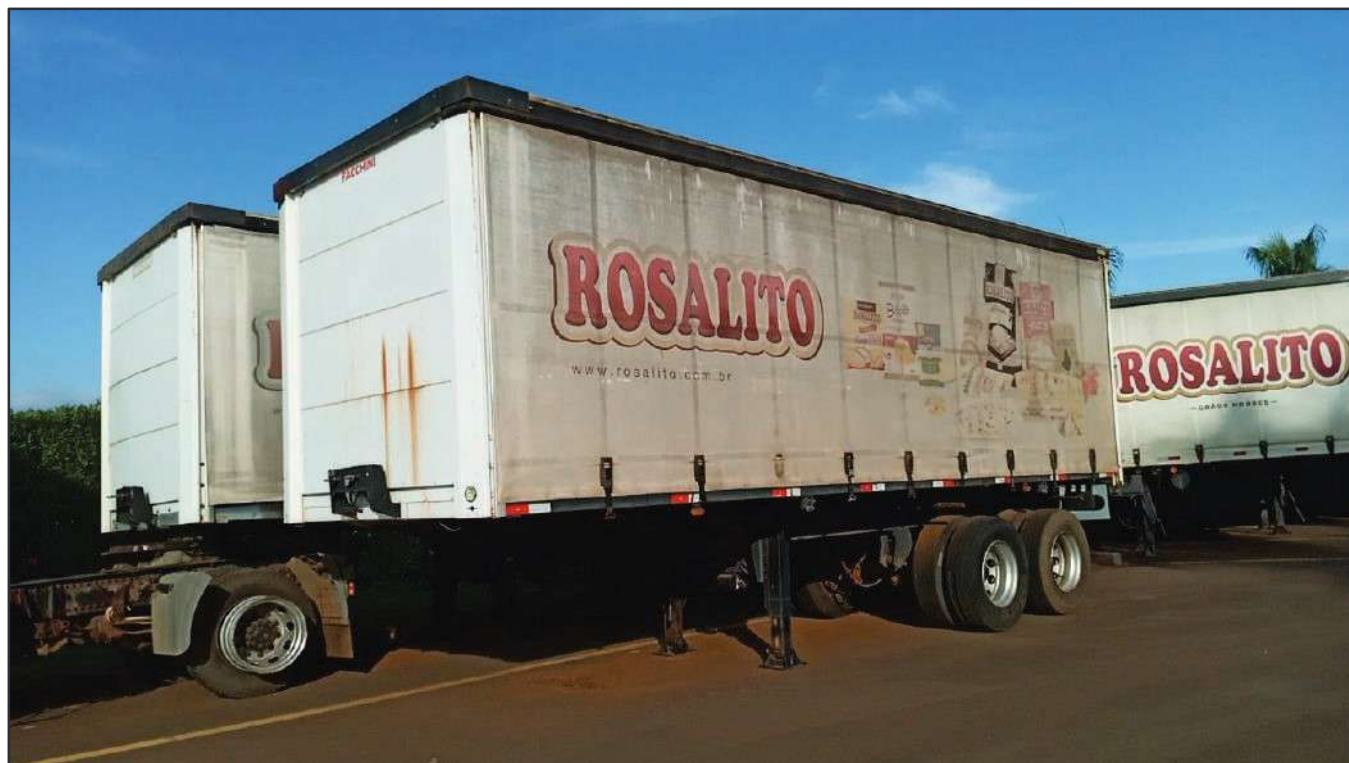
ITEM 016 - SEMI-REBOQUE FURGÃO FACCHINI PLACA: EAC-4384