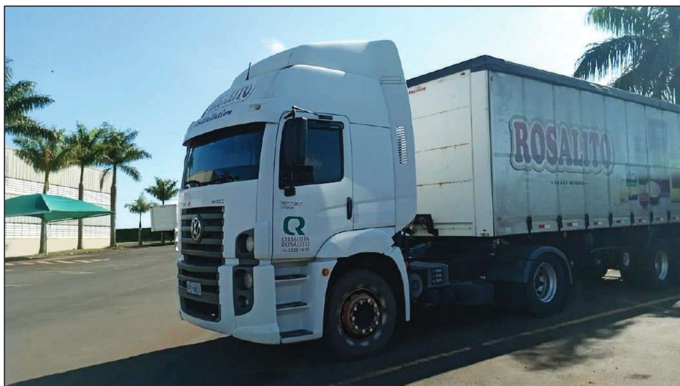
ITEM 026 - CAMINHÃO TOCO VOLKSWAGEM 19-320 CONSTELLATION CLC TT PLACA: EPI-9871