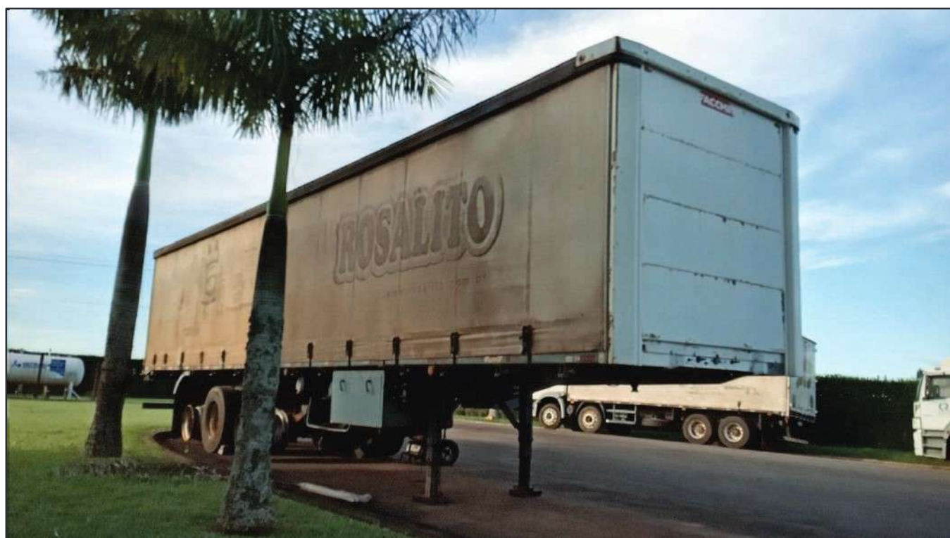
ITEM 001 - SEMI-REBOQUE FURGÃO NOMA PLACA: BJP-0993