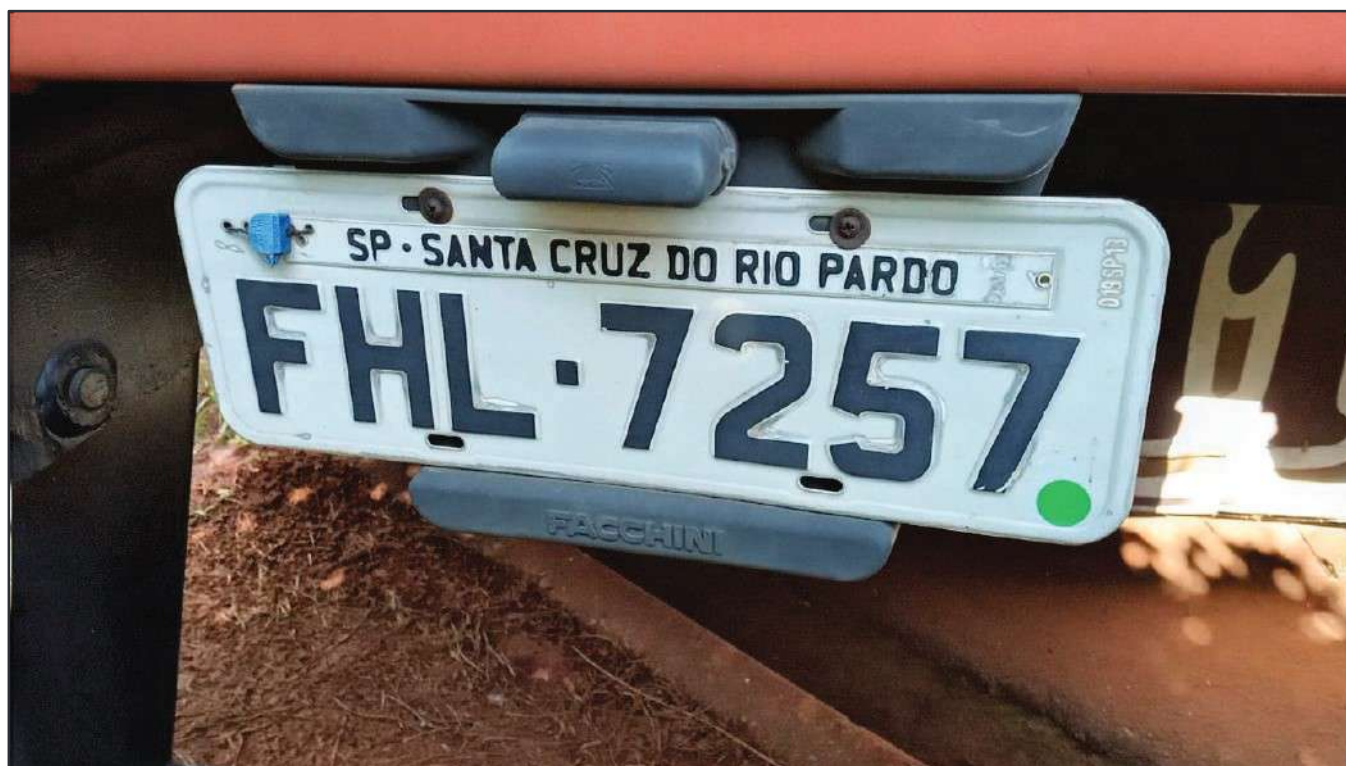
ITEM 036 - SEMI-REBOQUE FURGÃO FACCHINI PLACA: FHL-7257