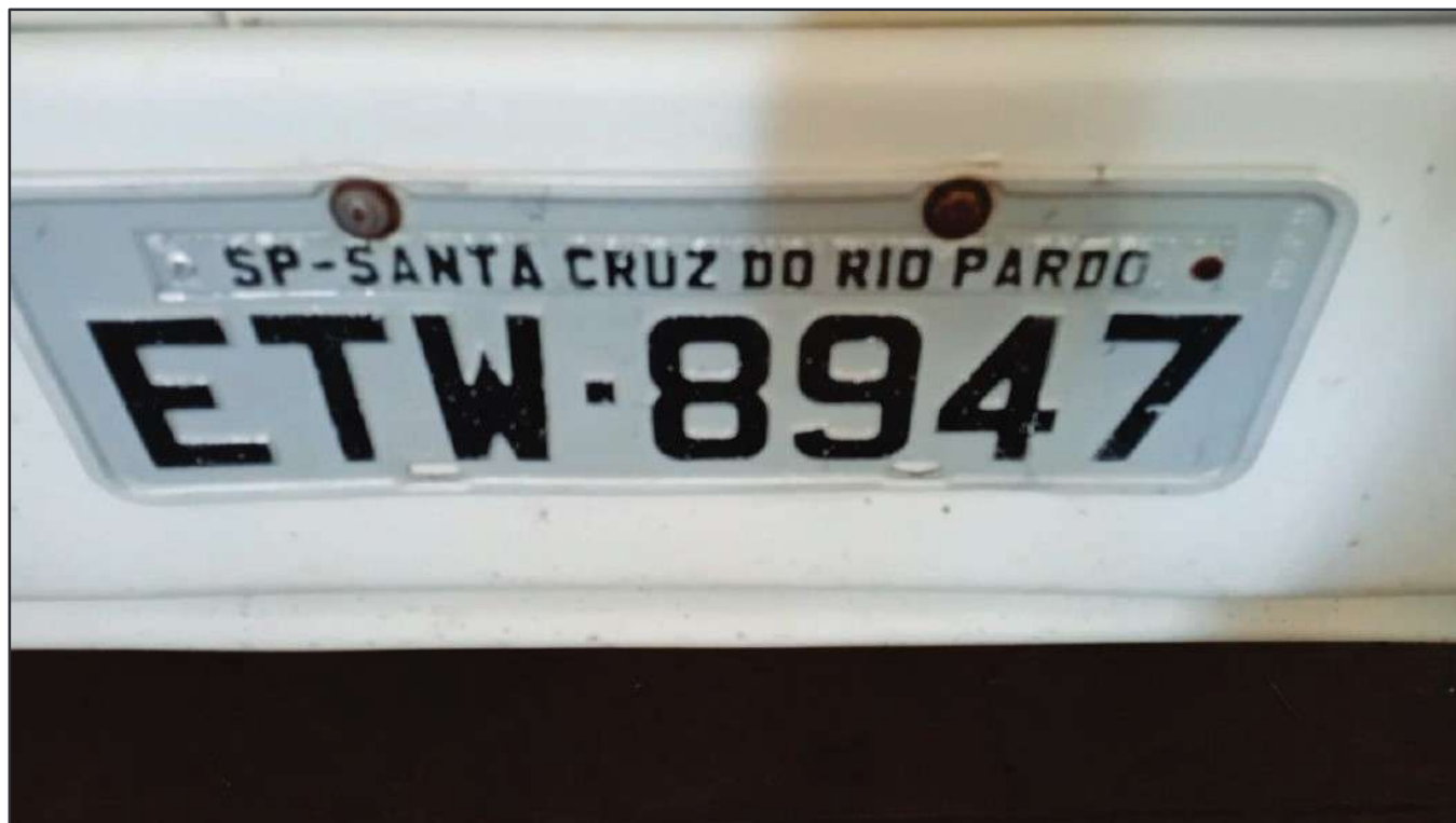
ITEM 027 - CAMINHÃO TRUCK VOLVO FM370 T PLACA: ETW-8947