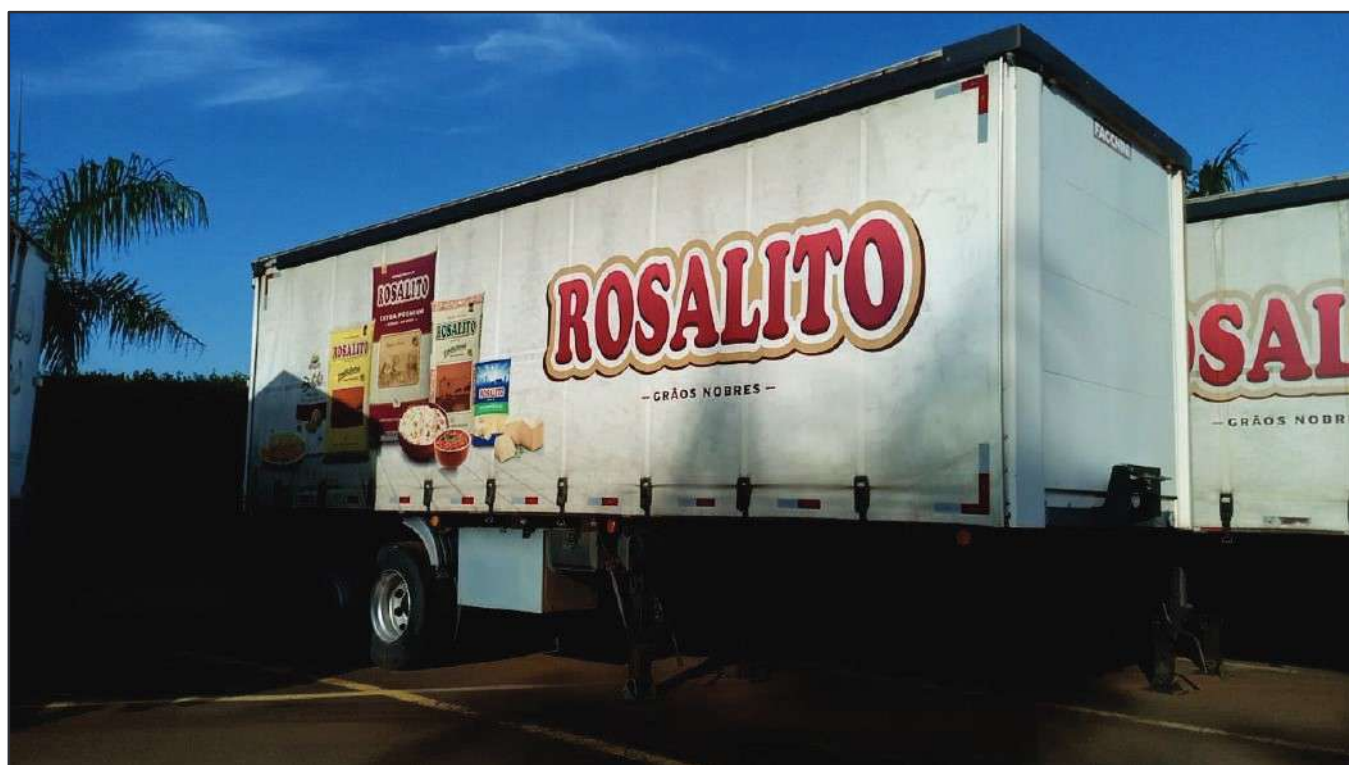
ITEM 017 - SEMI-REBOQUE FURGÃO FACCHINI PLACA: EAC-4385