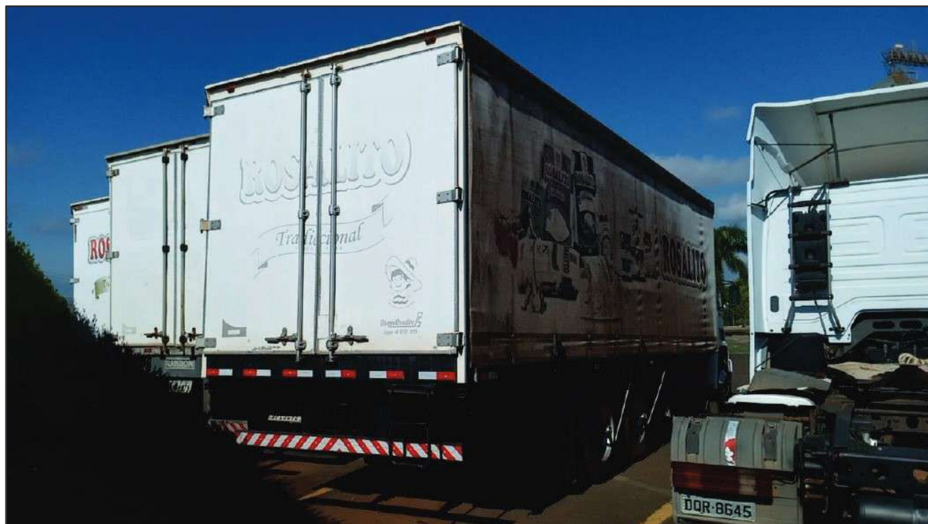
ITEM 046 - CAMINHÃO TRUCK VOLKSWAGEM 23.210 MOTOR CUMMINS PLACA: DFI-3C92