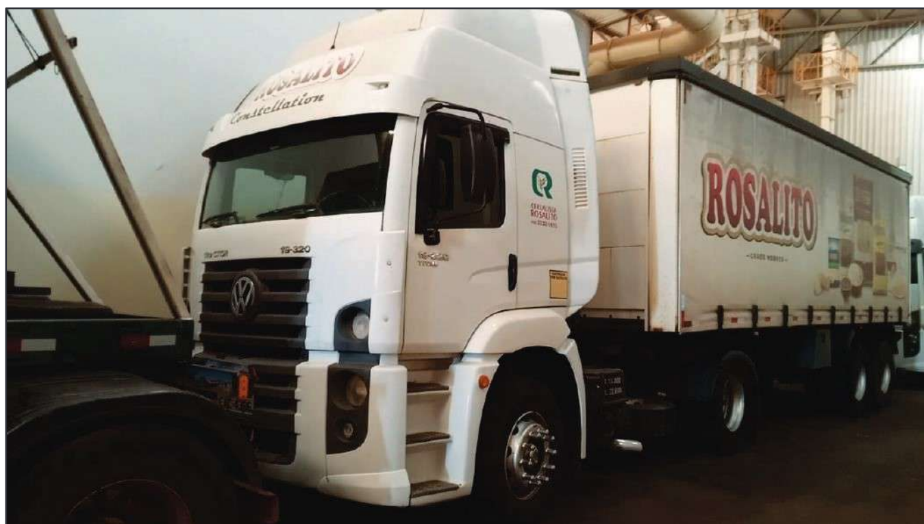
ITEM 018 - CAMINHÃO TOCO VOLKSWAGEM 19-320 CONSTELLATION CLC TT PLACA: EAC-4386