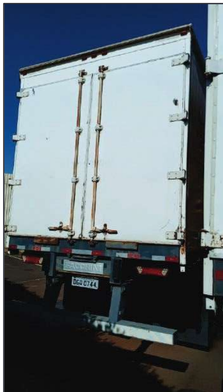
ITEM 007 - SEMI-REBOQUE FURGÃO FACCHINI PLACA: DGQ-0744