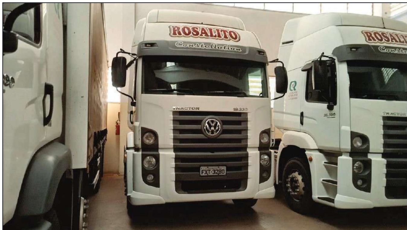
ITEM 043 - CAMINHÃO TOCO VOLKSWAGEM 19-330 CTC PLACA: FXT-3280