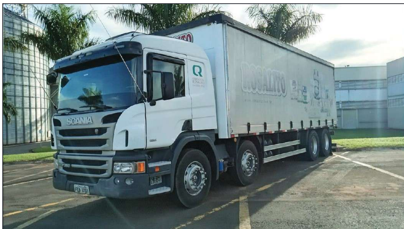
ITEM 032 - BI-TRUCK SCANIA P250 B8X2 PLACA: FEA-3761