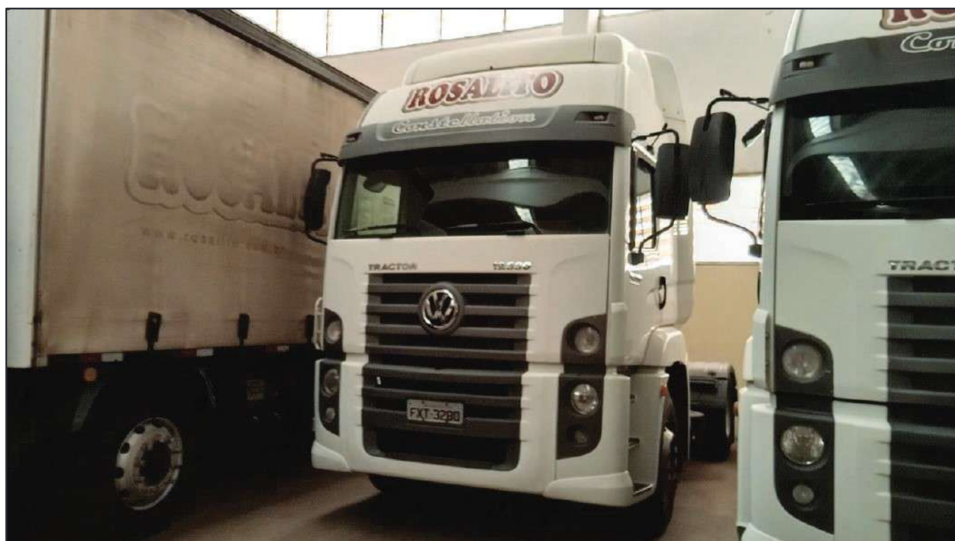
ITEM 043 - CAMINHÃO TOCO VOLKSWAGEM 19-330 CTC PLACA: FXT-3280