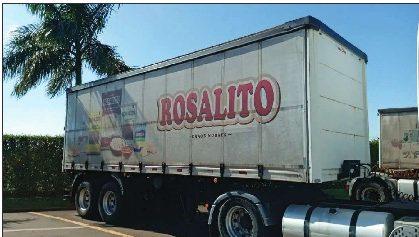
ITEM 012 - SEMI-REBOQUE FURGÃO FACCHINI PLACA: DUT-7663