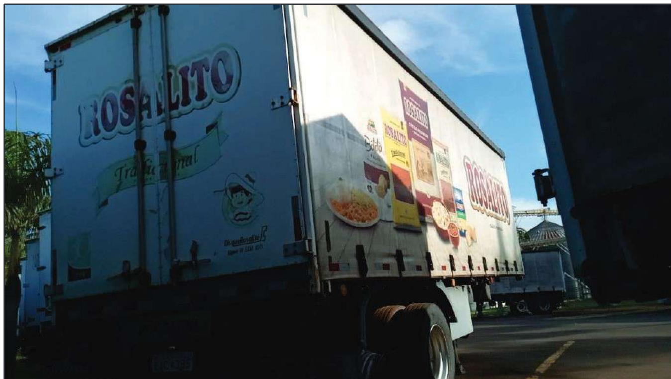
ITEM 017 - SEMI-REBOQUE FURGÃO FACCHINI PLACA: EAC-4385