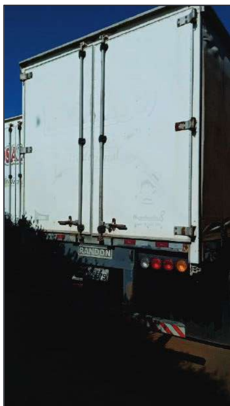
ITEM 002 - SEMI-REBOQUE FURGÃO RANDON PLACA: CTX-5979