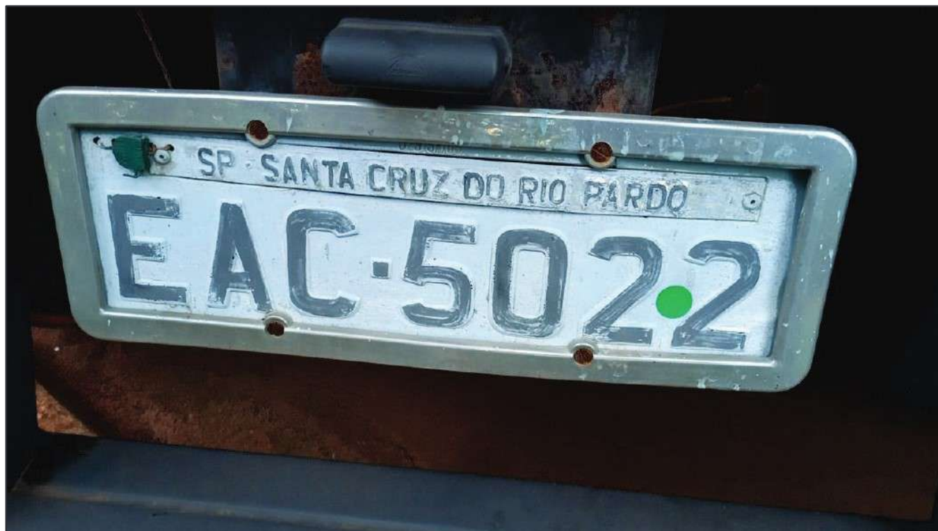
ITEM 024 - SEMI-REBOQUE FURGÃO FACCHINI PLACA: EAC-5022