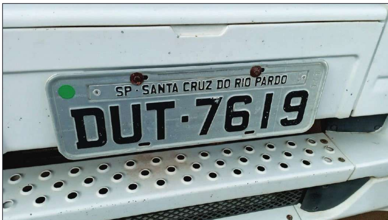
ITEM 011 - CAMINHÃO TOCO MERCEDES-BENZ AXOR 1933 S PLACA: DUT-7619