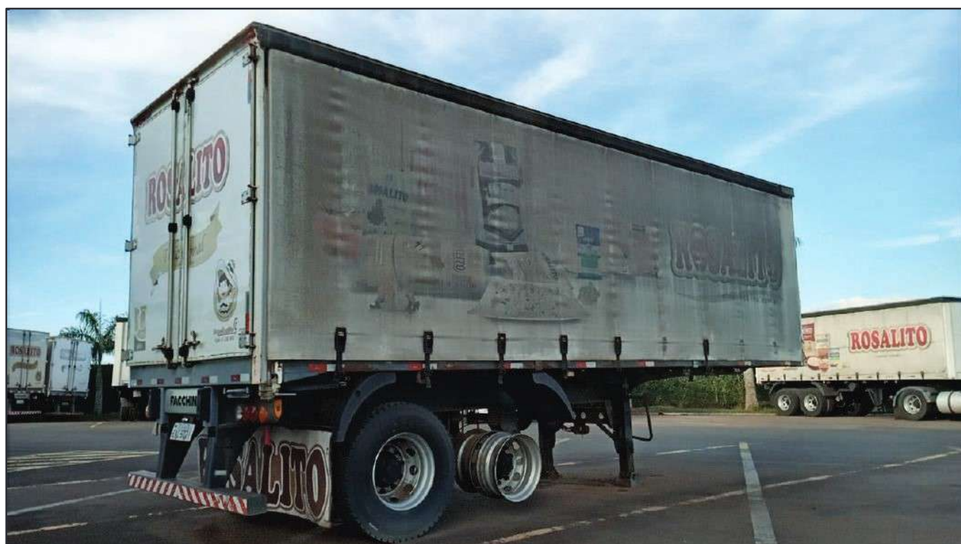
ITEM 023 - SEMI-REBOQUE FURGÃO FACCHINI PLACA: EAC-5021

Este documento é cópia do original, assinado digitalmente por RAFAEL VALERIO BRAGA MARTINS e Tribunal de Justiça do Estado de São Paulo, protocolado em 13/06/2023 às 21:27, sob o número WSCF033700202130. Para conferir o original, acesse o site https://esaj.tjsp.jus.br/pastadigital/pg/abrirConferenciaDocumento.do , informe o processo 1000101-23.2021.8.26.0539 e código D418770.