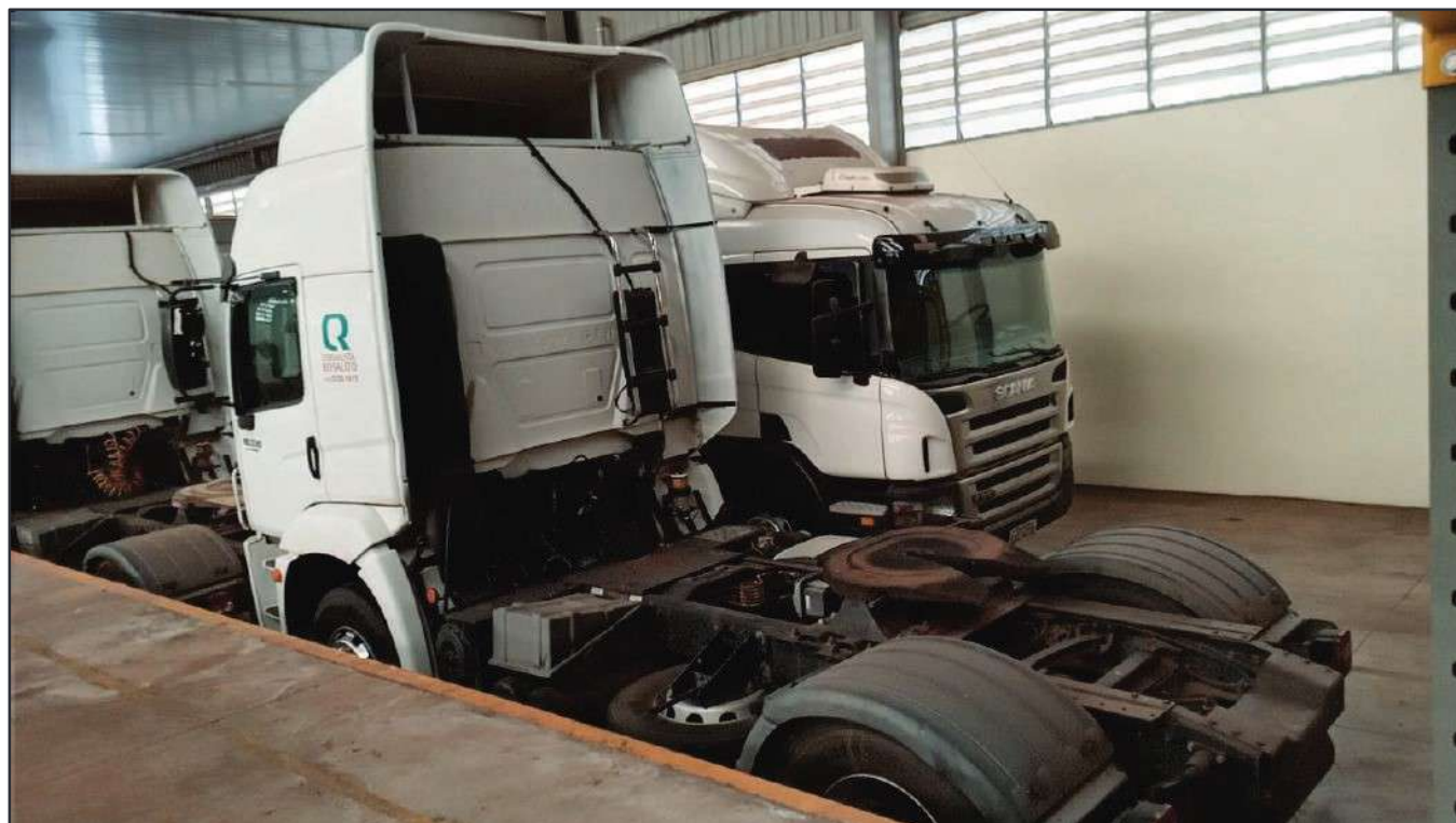
ITEM 030 - CAMINHÃO TOCO VOLKSWAGEM 19-330 CTC PLACA: FBY-6754