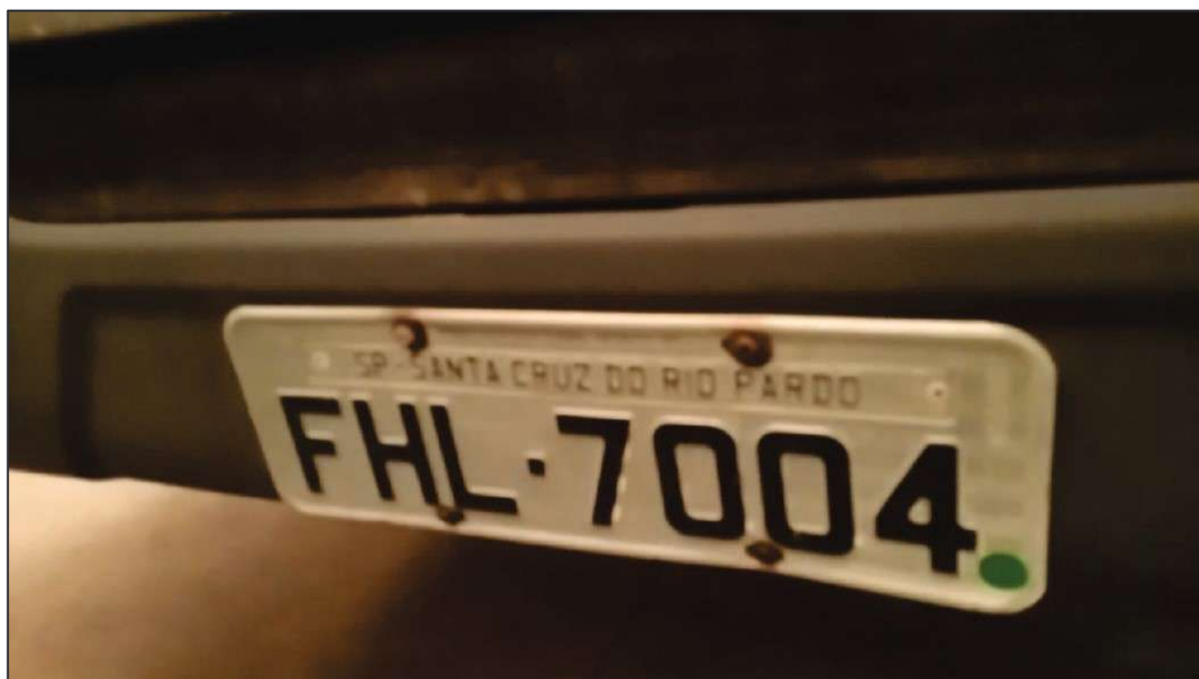
ITEM 048 - CAMINHÃO TRUCK SCANIA P 360 A6X2 PLACA: FHL-7004