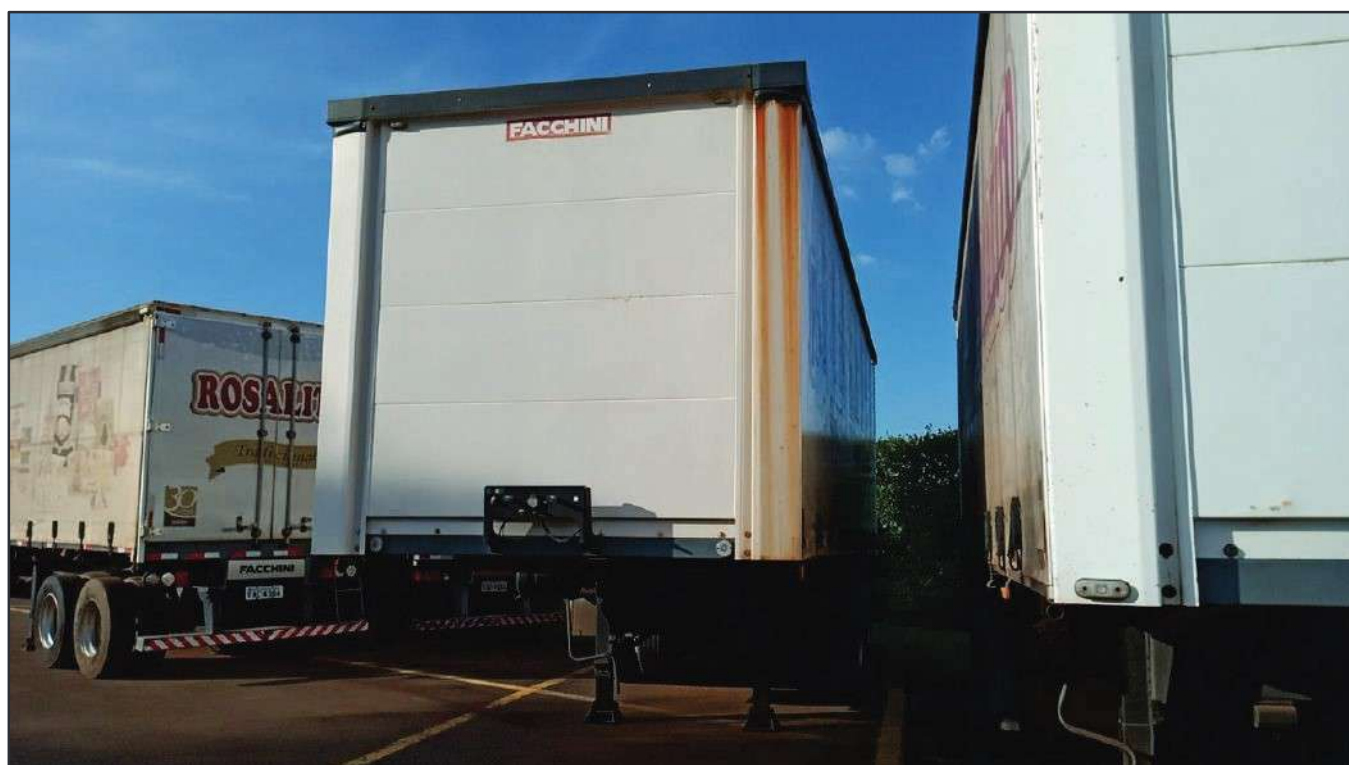
ITEM 017 - SEMI-REBOQUE FURGÃO FACCHINI PLACA: EAC-4385