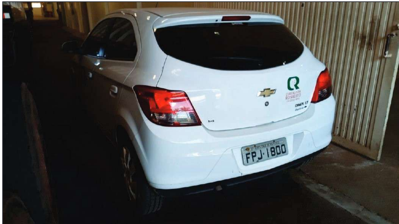
ITEM 039 - AUTOMÓVEL CHEVROLET (GM) ONIX PLACA: FPJ-1800