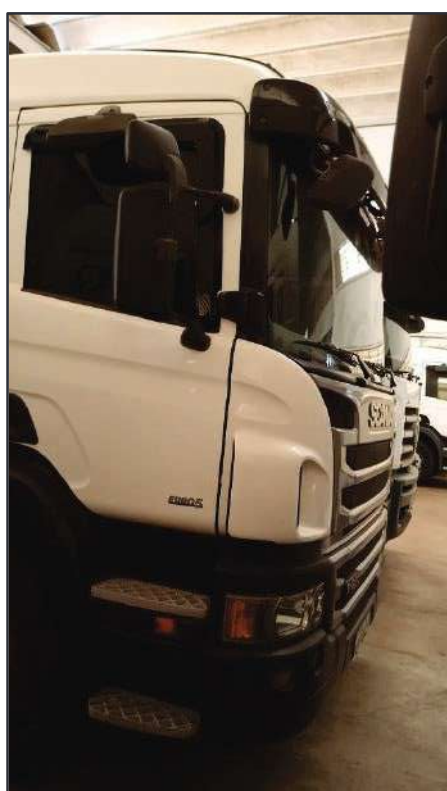
ITEM 033 - BI-TRUCK SCANIA P250 B8X2 PLACA: FEA-3762

Este documento é cópia do original, assinado digitalmente por RAFAEL VALERIO BRAGA MARTINS e Tribunal de Justiça do Estado de São Paulo, protocolado em 13/06/2023 às 21:27, sob o número WSCF033700202130. Para conferir o original, acesse o site https://esaj.tjsp.jus.br/pastadigital/pg/abrirConferenciaDocumento.do , informe o processo 1000101-23.2021.8.26.0539 e código D41877C.