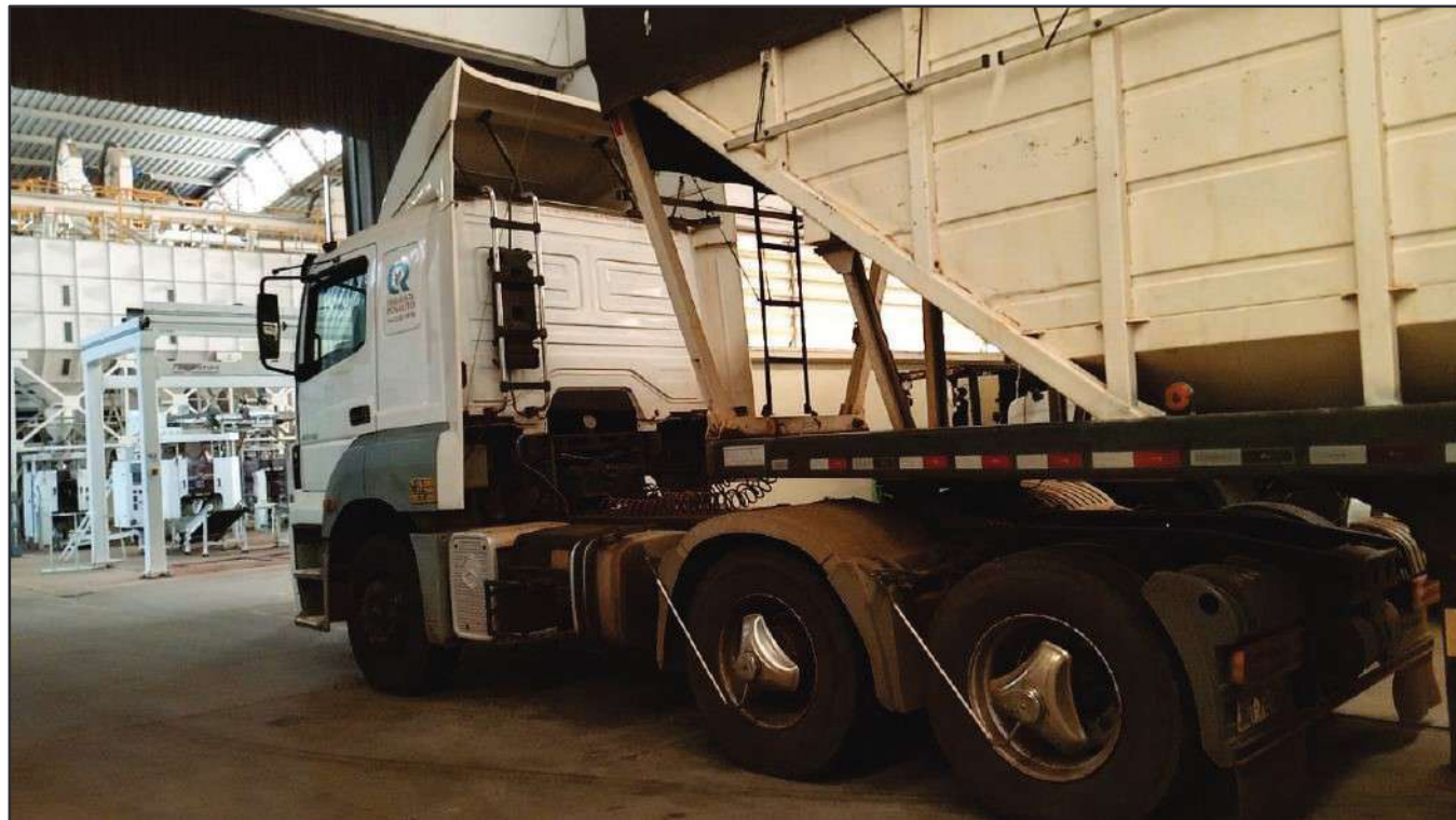
ITEM 015 - CAMINHÃO TRUCK MERCEDES-BENZ 1720 PLACA: DUT-7816