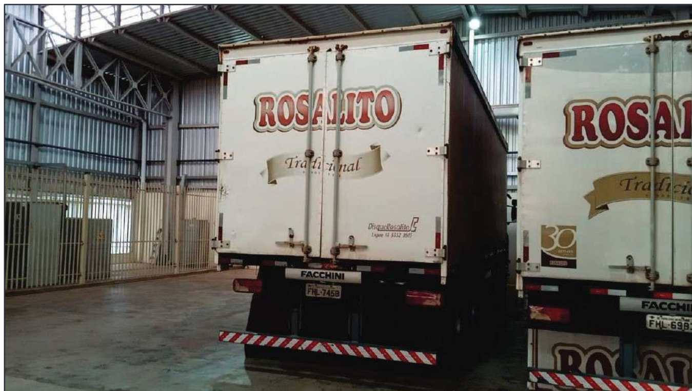
ITEM 037 - BI-TRUCK SCANIA P250 B8X2 PLACA: FHL-7458