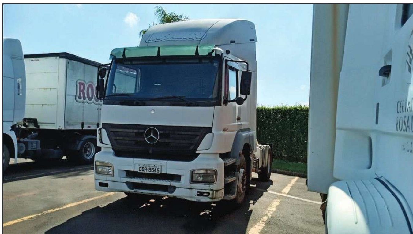
ITEM 008 - CAMINHÃO TOCO MERCEDES-BENZ AXOR 1933 S PLACA: DQR-8645