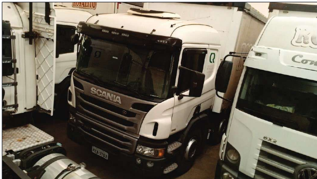
ITEM 033 - BI-TRUCK SCANIA P250 B8X2 PLACA: FEA-3762