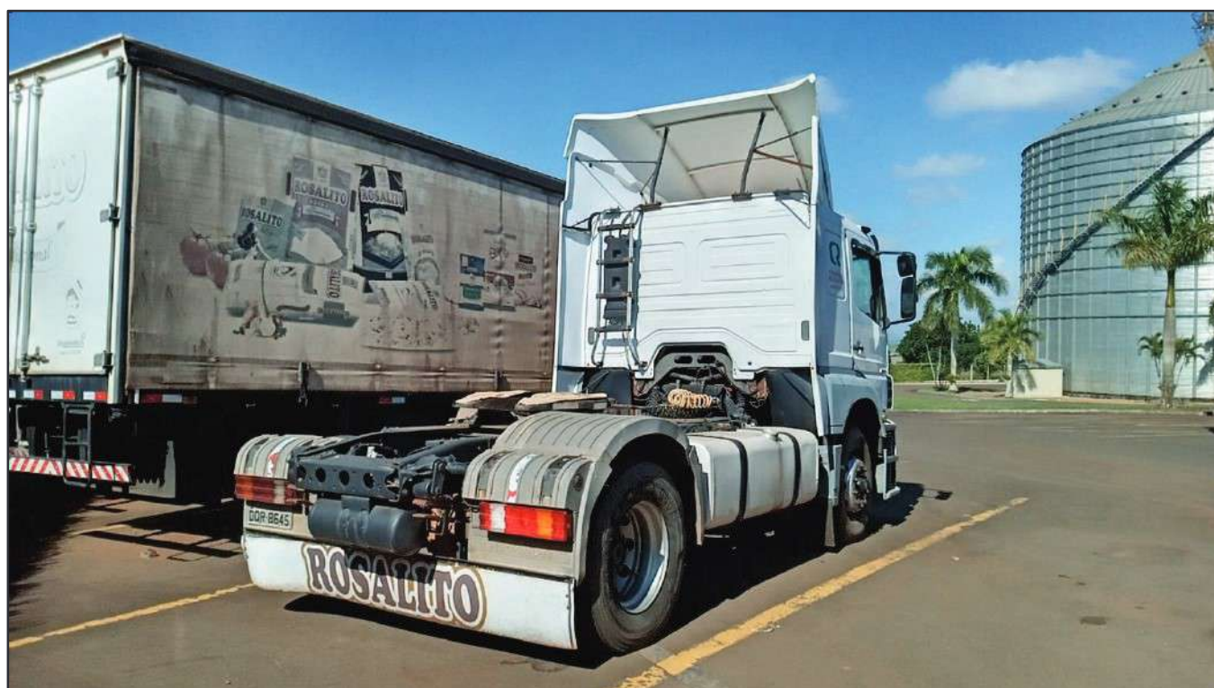
ITEM 008 - CAMINHÃO TOCO MERCEDES-BENZ AXOR 1933 S PLACA: DQR-8645