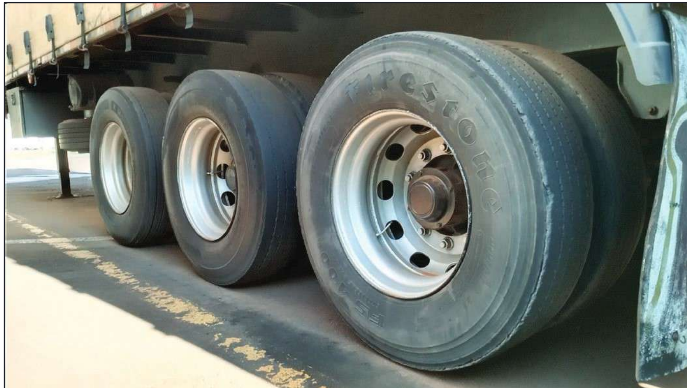
ITEM 003 - SEMI-REBOQUE FURGÃO FACCHINI PLACA: DGQ-0369