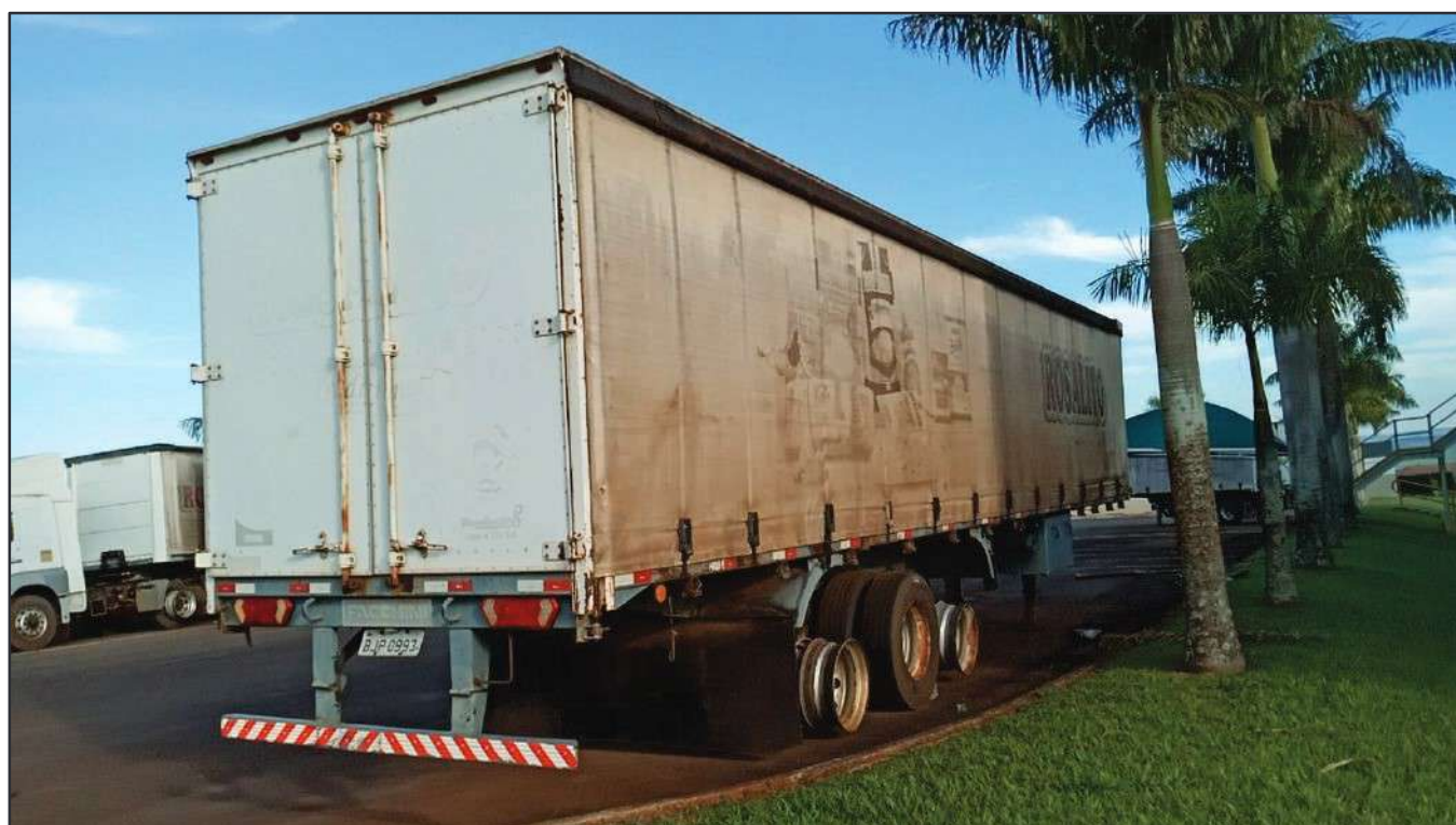
ITEM 001 - SEMI-REBOQUE FURGÃO NOMA PLACA: BJP-0993