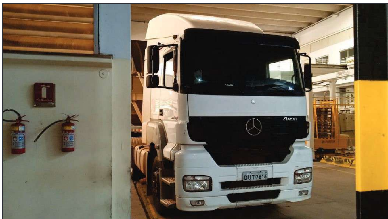
ITEM 015 - CAMINHÃO TRUCK MERCEDES-BENZ 1720 PLACA: DUT-7816