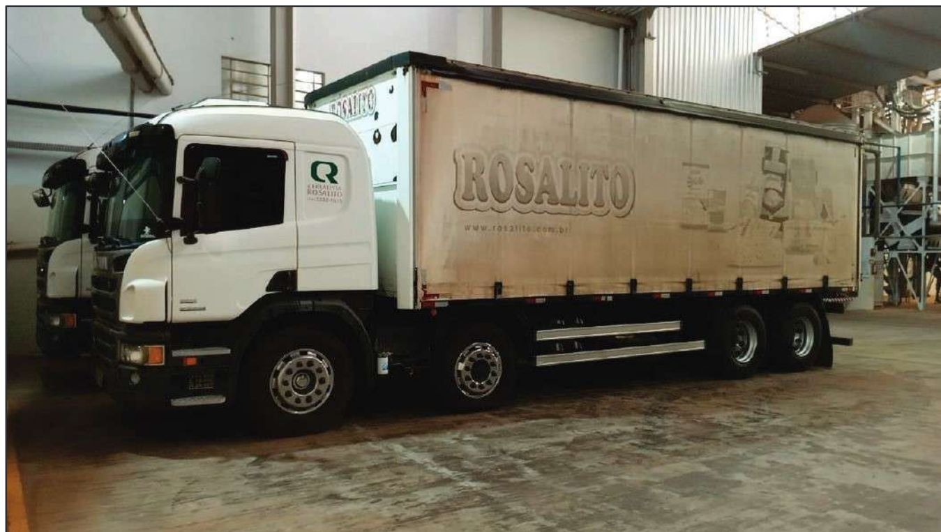
ITEM 037 - BI-TRUCK SCANIA P250 B8X2 PLACA: FHL-7458