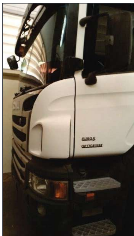
ITEM 038 - BI-TRUCK SCANIA P250 B8X2 PLACA: FHL-7751