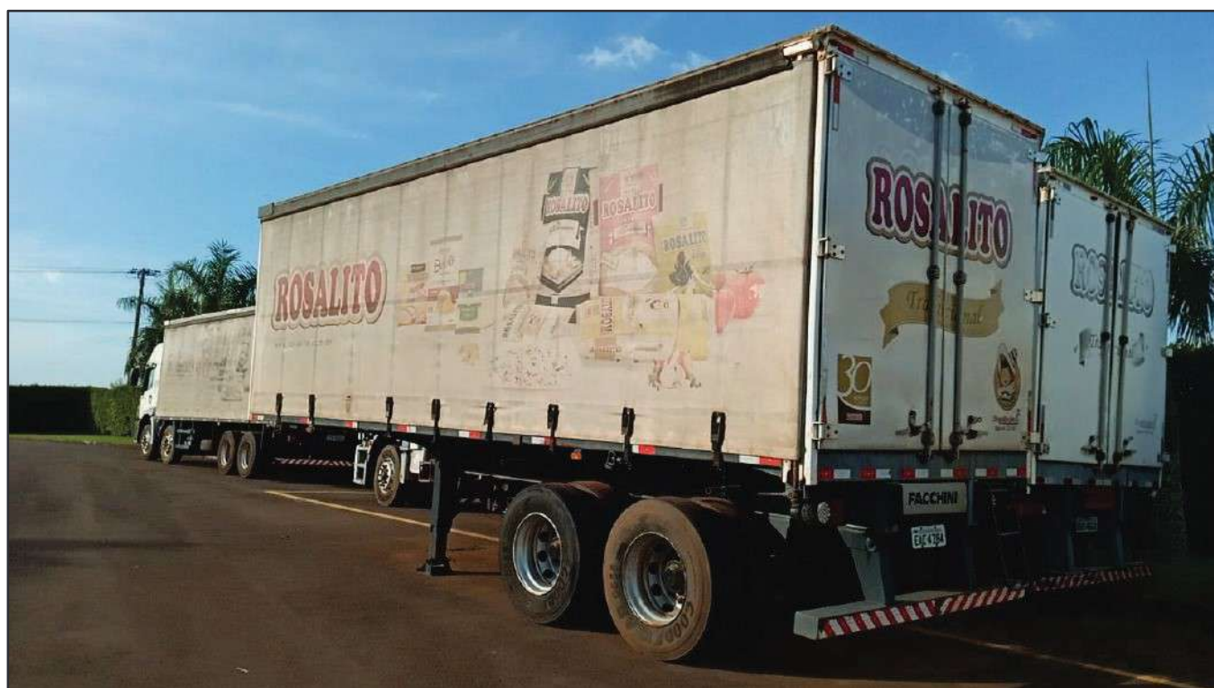
ITEM 016 - SEMI-REBOQUE FURGÃO FACCHINI PLACA: EAC-4384