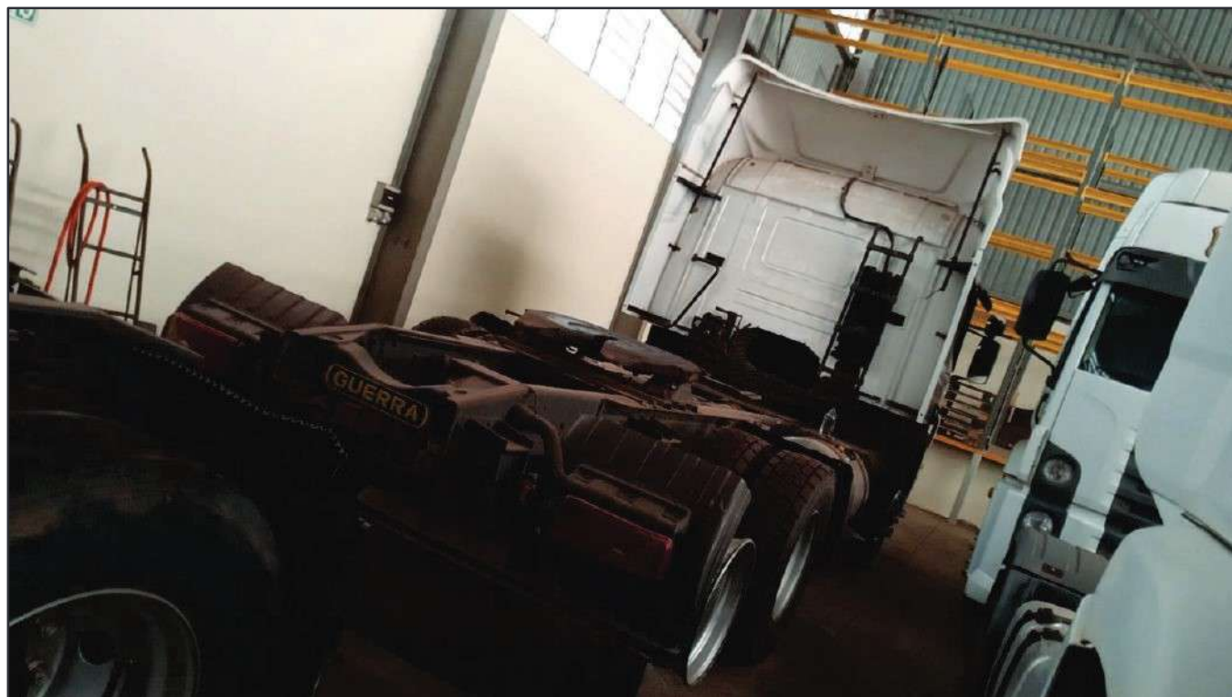
ITEM 021 - CAMINHÃO TRUCK SCANIA P340 A PLACA: EAC-4770