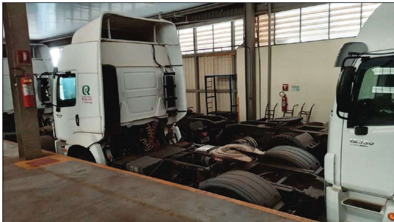
ITEM 042 - CAMINHÃO TOCO VOLKSWAGEM 19-330 CTC PLACA: FXR-0890