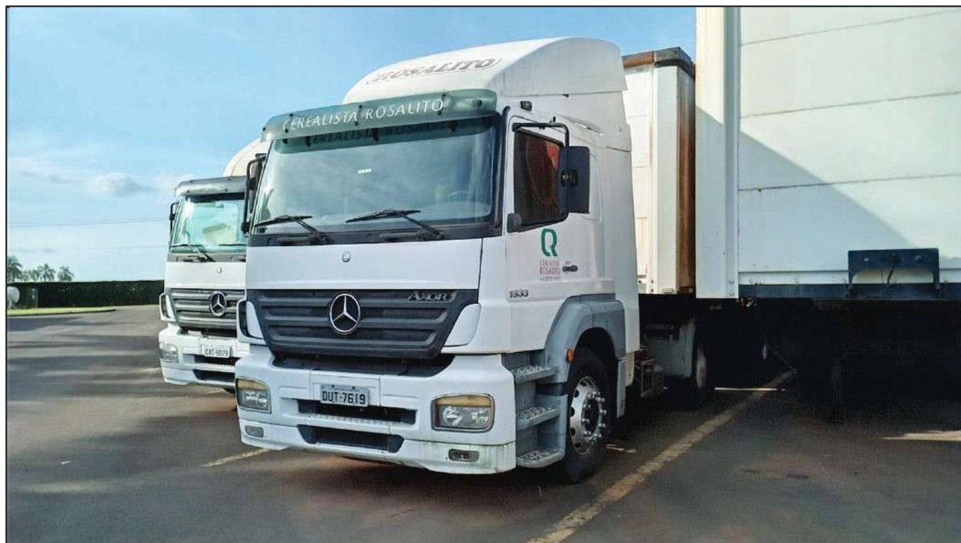
ITEM 011 - CAMINHÃO TOCO MERCEDES-BENZ AXOR 1933 S PLACA: DUT-7619