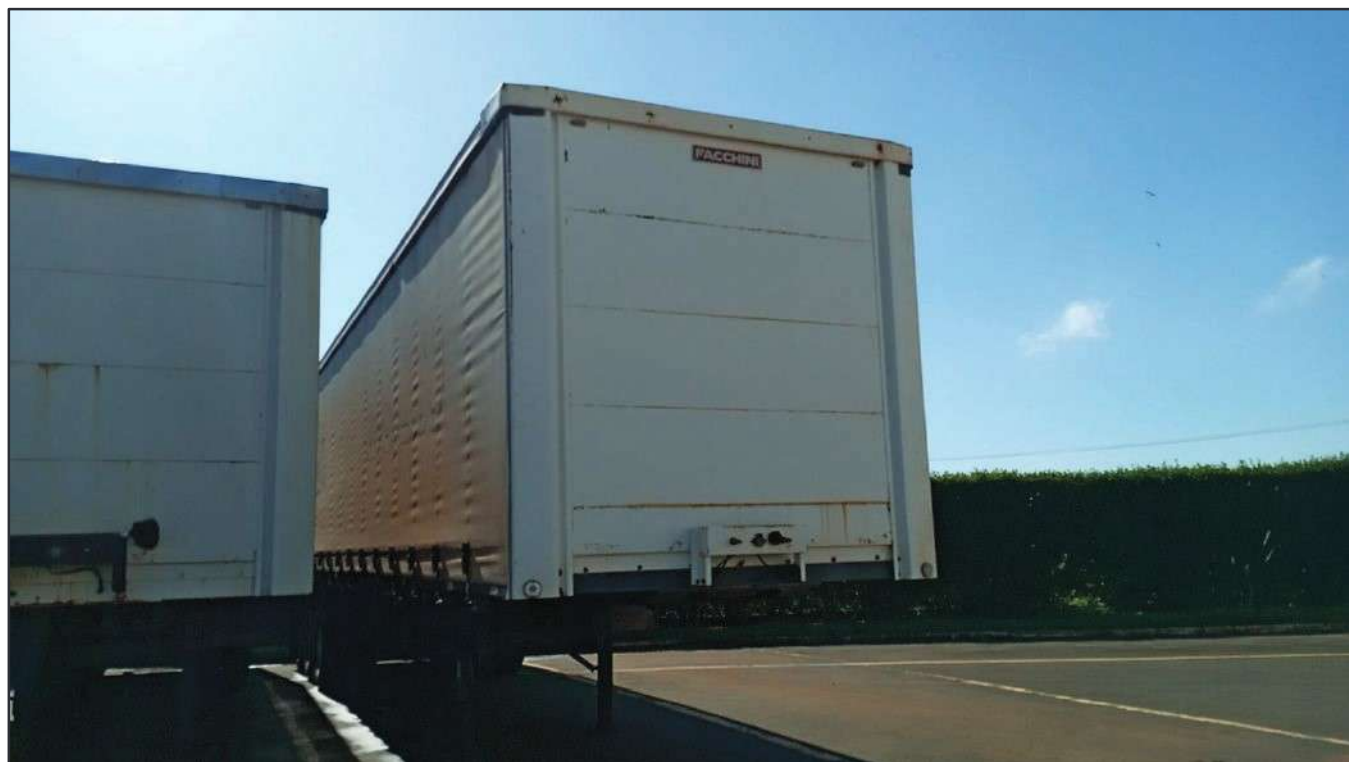
ITEM 007 - SEMI-REBOQUE FURGÃO FACCHINI PLACA: DGQ-0744