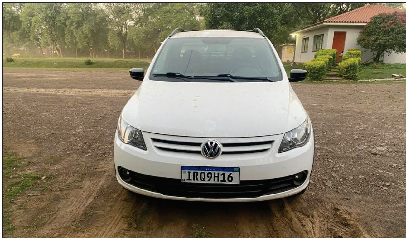
ITEM 001 - AUTOMÓVEL VOLKSWAGEN SAVEIRO 1.6 MI TOTAL FLEX 8V CE PLACA: IRQ-9H16 ANO: 2011