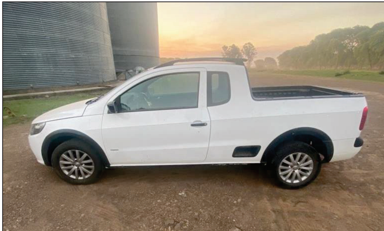
ITEM 001 - AUTOMÓVEL VOLKSWAGEN SAVEIRO 1.6 MI TOTAL FLEX 8V CE PLACA: IRQ-9H16 ANO: 2011