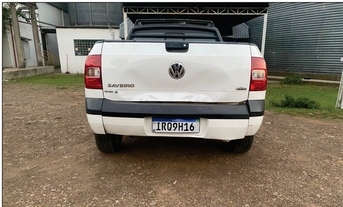
ITEM 001 - AUTOMÓVEL VOLKSWAGEN SAVEIRO 1.6 MI TOTAL FLEX 8V CE PLACA: IRQ-9H16 ANO: 2011