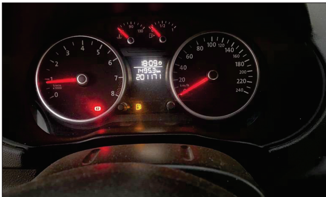
ITEM 001 - AUTOMÓVEL VOLKSWAGEN SAVEIRO 1.6 MI TOTAL FLEX 8V CE PLACA: IRQ-9H16 ANO: 2011