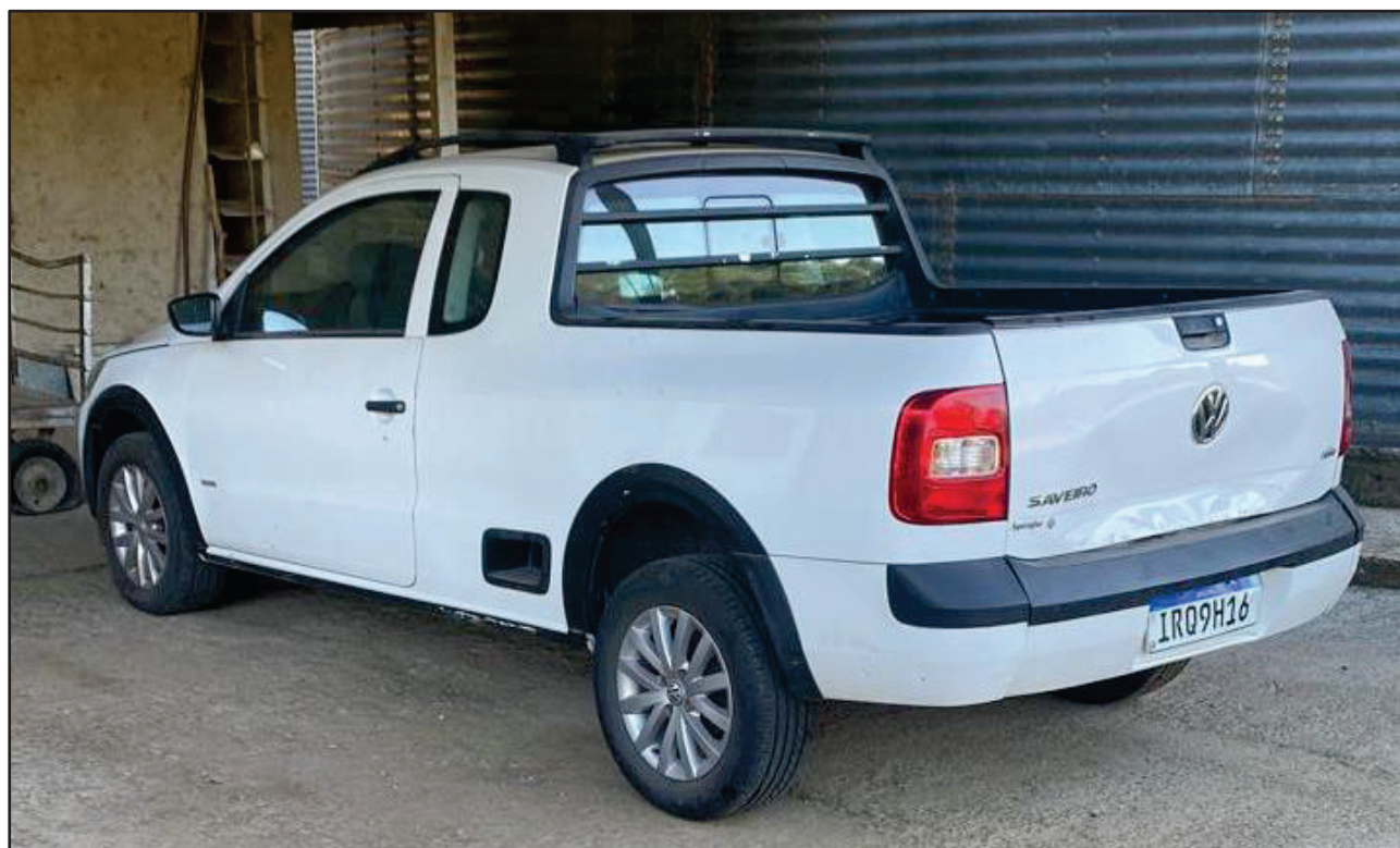
ITEM 001 - AUTOMÓVEL VOLKSWAGEN SAVEIRO 1.6 MI TOTAL FLEX 8V CE PLACA: IRQ-9H16 ANO: 2011