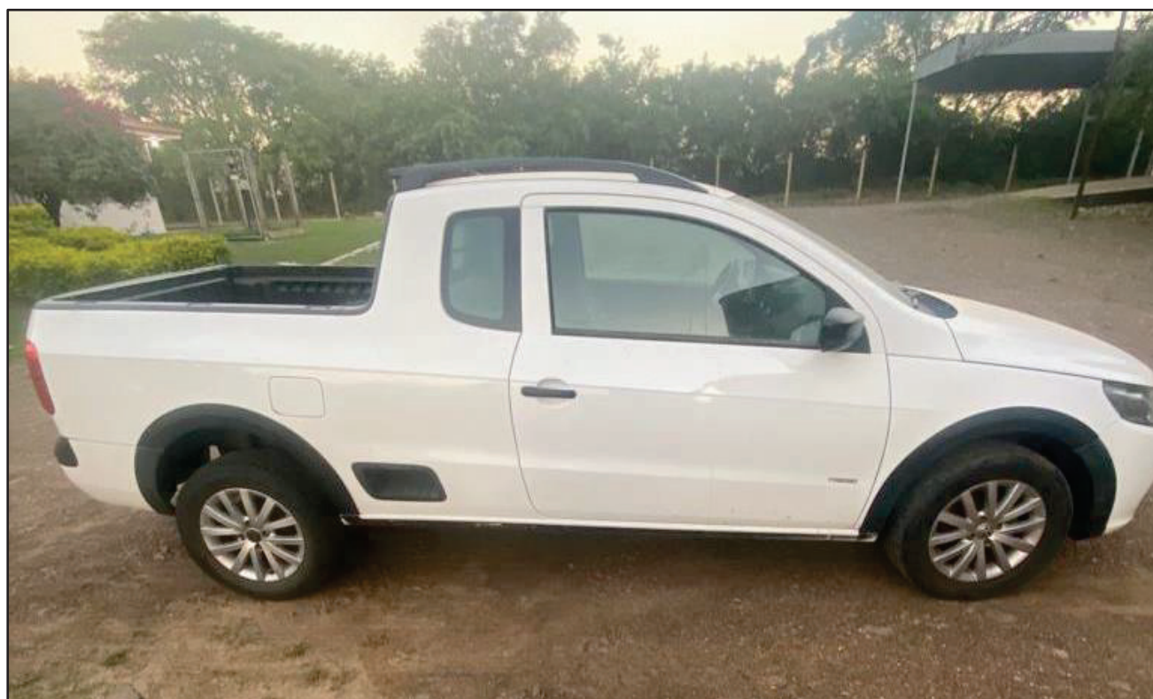
ITEM 001 - AUTOMÓVEL VOLKSWAGEN SAVEIRO 1.6 MI TOTAL FLEX 8V CE PLACA: IRQ-9H16 ANO: 2011